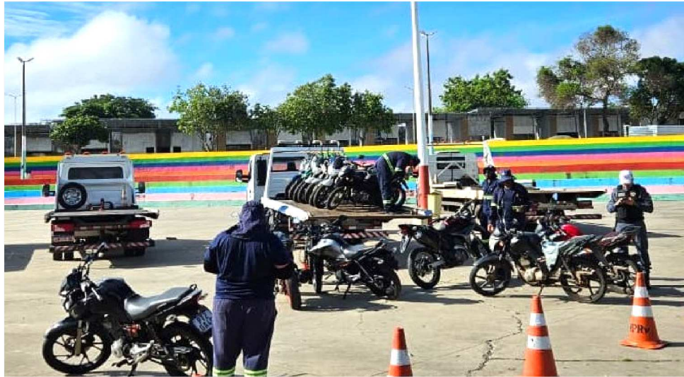
FORAM APREENDIDAS 41 MOTOS COM IRREGULARIDADES E INDÍCIOS DE CRIMES

Durante a fiscalização, foram identificadas diversas motocicletas com escapamentos adulterados, prática