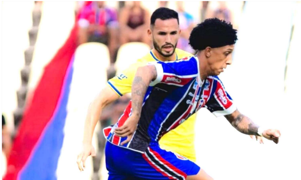
O MARANHÃO ATLÉTICO CLUBE SE PREPARA PARA OUTROS DESAFIOS