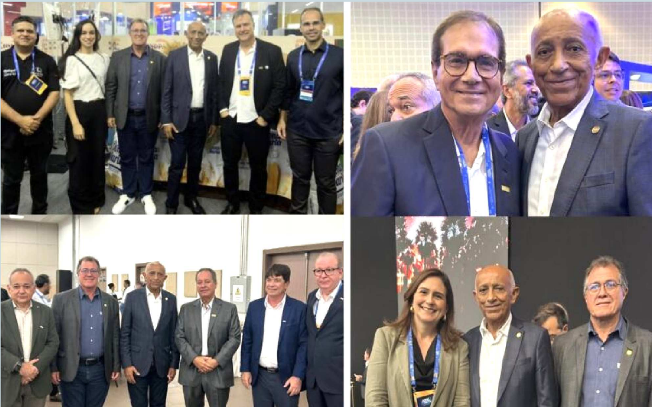
Momentos como este fortalecem parcerias, ampliam debates estratégicos e contribuem para construir uma indústria cada vez mais forte e competitiva no Brasil

Sob o tema "A indústria conectada ao seu dia a dia", a feira mobilizou os 39 segmentos ligados à Federação das Indústrias do Estado do Ceará (FIEC), abrangendo áreas como moda, energia, alimentos, construção civil e metalmeccânica. A programação contou com exposições, palestras e rodadas de negócios focadas em competitividade e atração de investimentos estratégicos para a região. A cerimônia de abertura, liderada pelo presidente da FIEC, Ricardo Cavalcante, reuniu autoridades como o governador do Ceará, Elmano de Freitas, além de empresários, representantes de instituições públicas e privadas e líderes sindicais. Para a comitiva maranhense, a participação no evento é fundamental para o intercâmbio de soluções tecnológicas que podem ser aplicadas ao fortalecimento da indústria no Maranhão.