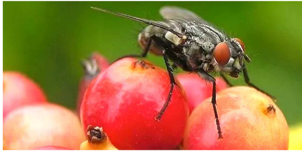
O PROBLEMA COSTUMA SE INTENSIFICAR EM PERÍODOS DE CALOR E CHUVAS

No Maranhão, os números chamam atenção. Últimos levantamentos epidemiológicos indicam que, entre 2019 e 2024, foram registradas 69.304 internações por diarreia e gastroenterite de origem infecciosa no estado, com média anual de cerca de 13,8 mil hospitalizações. A tendência observada é de crescimento ao longo dos anos, chegando a 15.227 interna-