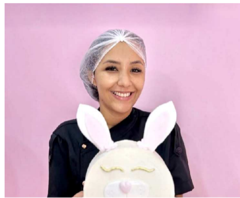
Para Dane Paixão, a data exige planejamento e organização

a Páscoa, costuma contar com ajuda extra para dar conta da demanda. A estratégia inclui produzir as cascas de chocolate com antecedência e deixar para a semana da data apenas a finalização dos ovos.