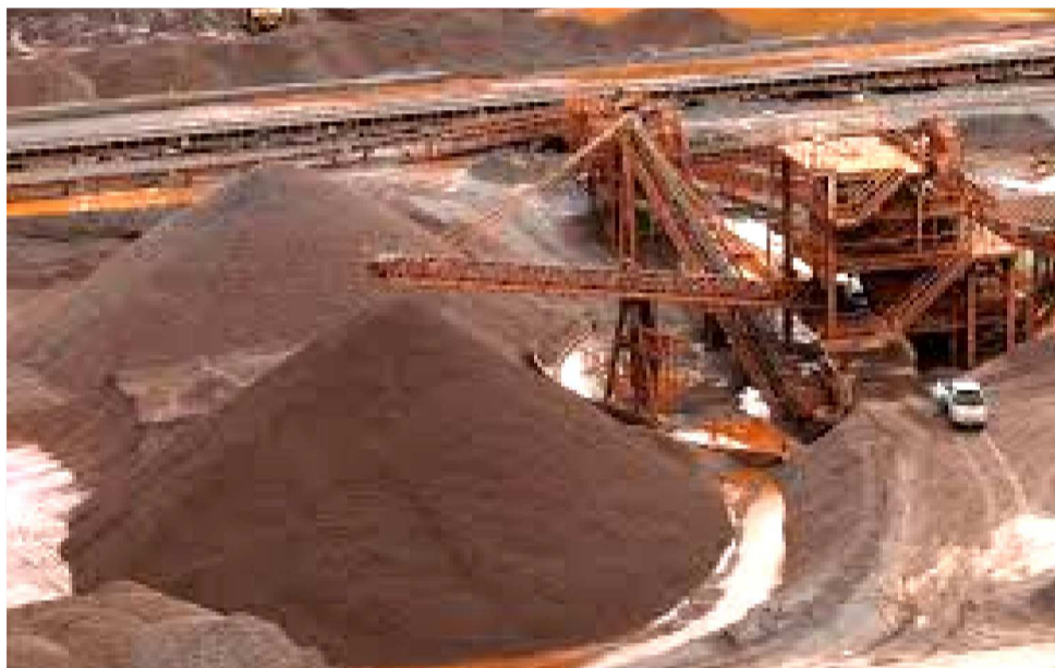
A CIRCULARIDADE EVOLUIU DE FRENTE PILOTO PARA PRÁTICA INDUSTRIAL DE ESCALA

Entre os destaques estão a Areia Sustentável Vale, iniciativa que já ultrapassou 3 milhões de toneladas destinadas desde 2023, e a Fábrica de Blocos da Mina do Pico, que transforma rejeitos em insumos para construção civil. Nas operações, Capanema e Vargem Grande (MG) ilustram o potencial de unir segurança operacional, liberação de áreas, eficiência produtiva e valor socioambiental. “Os resultados de 2025 mostram que a circularidade já é uma alavanca relevante do