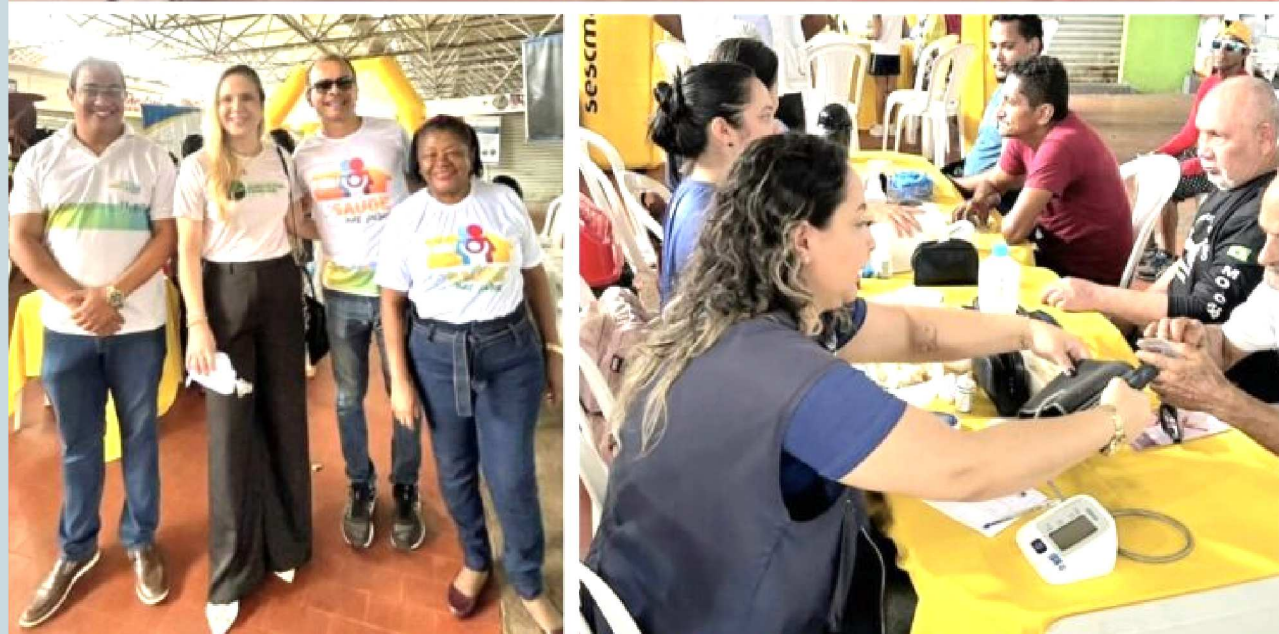
A Fecomércio-MA é um dos principais parceiros do projeto "Saúde nas Feiras", uma iniciativa do Sindicato do Comércio Varejista de Feirantes de São Luís (Sindifeirantes) que desde 2012 oferta um conjunto de atividades e serviços de saúde voltados aos feirantes, empreendedores e seus familiares