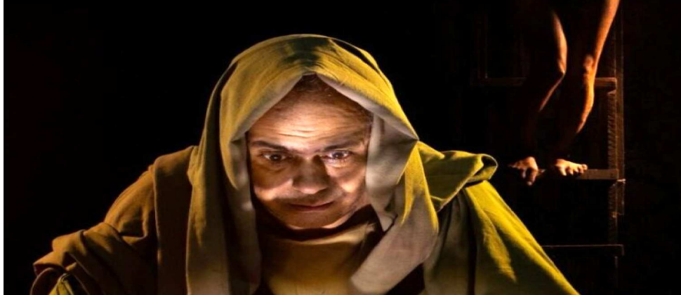
O ESPETÁCULO FOI CRIADO HÁ 37 ANOS, A PARTIR DE UM TEXTO DE TÁCITO BORRALHO

A montagem utiliza recursos do teatro de arena, com o elenco próximo do público, que acompanha de forma