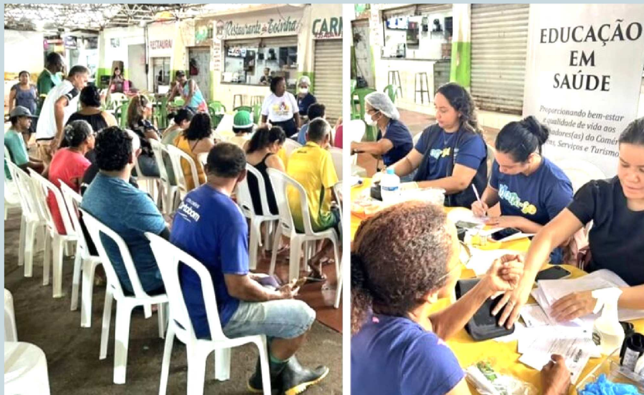
Com uma equipe multiprofissional, a Fecomércio, por meio do Sesc, participou do evento com os serviços de aferição de pressão arterial, teste de glicemia, orientações sobre Infecções Sexualmente Transmissíveis (ISTs), Prevenção às Hepatites Virais, entre outros.

Realizado neste mês de março, o Sindifeirantes, sindicato filiado à Federação do Comércio de Bens, Serviços e Turismo do Maranhão (Fecomércio-MA), realizou mais uma edição do projeto "Saúde nas Feiras". Este ano, o escolhido para a ação social foi o Mercado do João Paulo, onde feirantes e trabalhadores foram beneficiados com serviços de saúde, orientação e prevenção. Foram 864 atendimentos realizados, incluindo consultas médicas, orientações sobre doenças crônicas, entrega de kits odontológicos e ações de prevenção. Entre os serviços disponibilizados estiveram aferição de pressão arterial e glicemia, consultas médicas com clínicos gerais, orientações sobre saúde bucal e a entrega de 200 kits odontológicos. Foram realizadas também ações educativas sobre hipertensão, diabetes, infecções sexualmente transmissíveis (ISTs) e câncer, ampliando o acesso à informação e à prevenção. A programação incluiu ainda a distribuição de preservativos, orientações sobre atendimento de urgência e a oferta de medicamentos básicos, contribuindo para um atendimento mais completo e humanizado. Para muitos feirantes, a ação representou a oportunidade de cuidar da saúde sem precisar se afastar do trabalho.