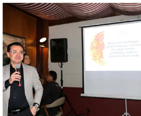
Segundo ele, a qualidade da informação clínica e da coleta da amostra