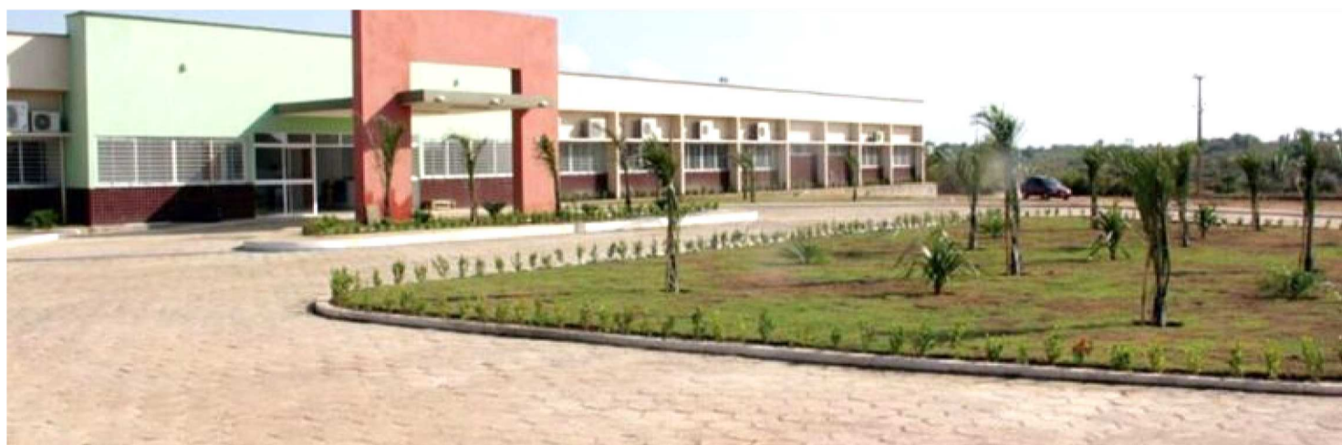
UNIVERSIDADE FEDERAL DO MARANHÃO (UFMA), NO CAMPUS DE PINHEIRO SERÁ SUPERVISIONADA PELO MINISTÉRIO DA EDUCAÇÃO

O Ministério da Educação (MEC) aplicou sanções severas ao curso de Medicina da Afya Faculdade de Ciências Médicas de Santa Inês, além de abrir processos de supervisão contra unidades da Universidade Ceuma (São Luís e Imperatriz) e da Universidade Federal do Maranhão (UFMA), no campus de Pinheiro. As medidas, publicadas nesta terça-feira (17), são decorrentes do desempenho insatisfatório dessas instituições no Exame Nacional de Avaliação da Formação Médica (Enamed) de 2025.