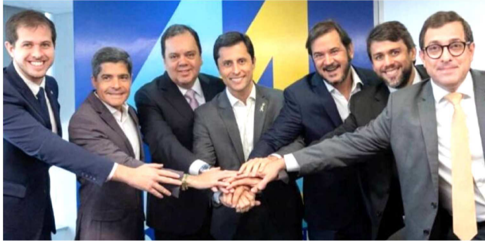
DEPUTADO FEDERAL, DUARTE JR FILIOU-SE AO UNIÃO BRASIL COM FOCO NA REELEIÇÃO

Nesse cenário, o deputado federal Duarte Jr formalizou sua saída do PSB e ingressou no União Brasil, conforme registro do Tribunal Superior Eleitoral. A movimentação, oficializada entre os dias 18 e 19 de março de 2026, não apenas confirma um reposicionamento individual, mas também