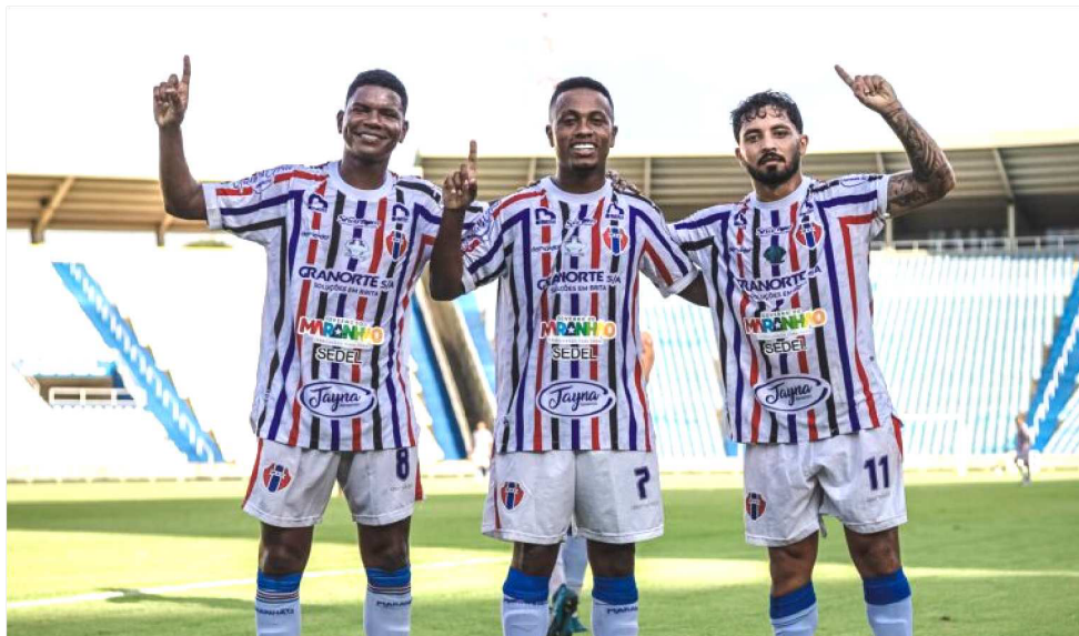
OS ATLETICANOS VOLTARÃO A CAMPO NO DIA 11 DIANTE DO BARRA-SC, NA ARENA BARRA

os ainda indefinidos: MAC x Botafogo-PB, em São Luís (9, 10 ou 11/05); Confiança x MAC, em Aracaju (16,17 ou 18); MAC x Caxias, em São Luís (23, 24 ou 25); Anápolis x Maranhão, em Anápolis-GO (30 ou 31/05 ou 1º de maio), seguindo-se a programação até à 19ª rodada, quando os atleticanos encerrarão a primeira fase enfrentando o Figueirense-SC, fora de casa, em Florianópolis, no dia 30 de agosto.