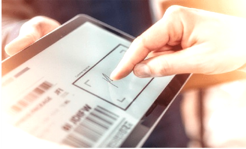
O NÚMERO CONSOLIDA A DIGITALIZAÇÃO DE VÁRIOS SERVIÇOS

Em outubro de 2025 foi registrado o maior volume mensal da história do sistema, com 2.457 atos digitais reali-