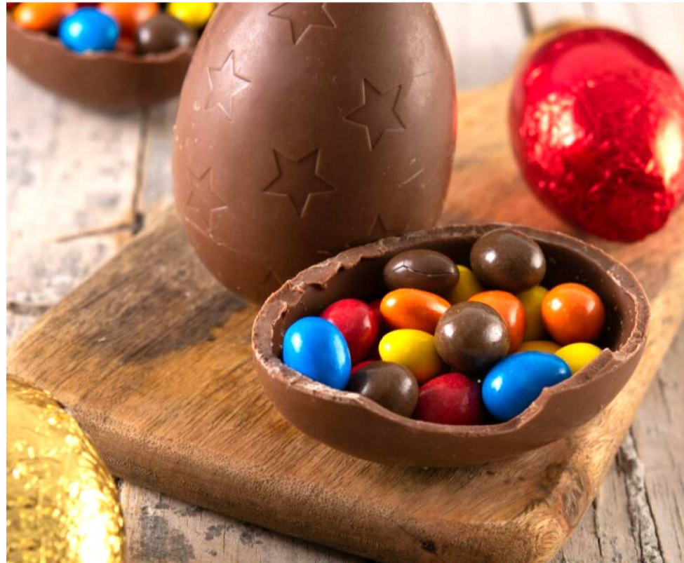
É PRECISO FOCAR PRODUTOS POUCO ATENDIDOS PELA INDÚSTRIA TRADICIONAL

O Sebrae preparou cinco dicas que vão te ajudar a bombar durante as comemorações de Páscoa e que podem ser uma boa ideia para campanhas durante todo o ano.