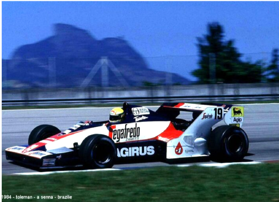
1984 - toleman - a senna - brazilie

Foi com ela que o brasileiro estreou em casa, no GP do Brasil, mas abandonou por falha mecânica. Com o modelo, Senna completou apenas du-