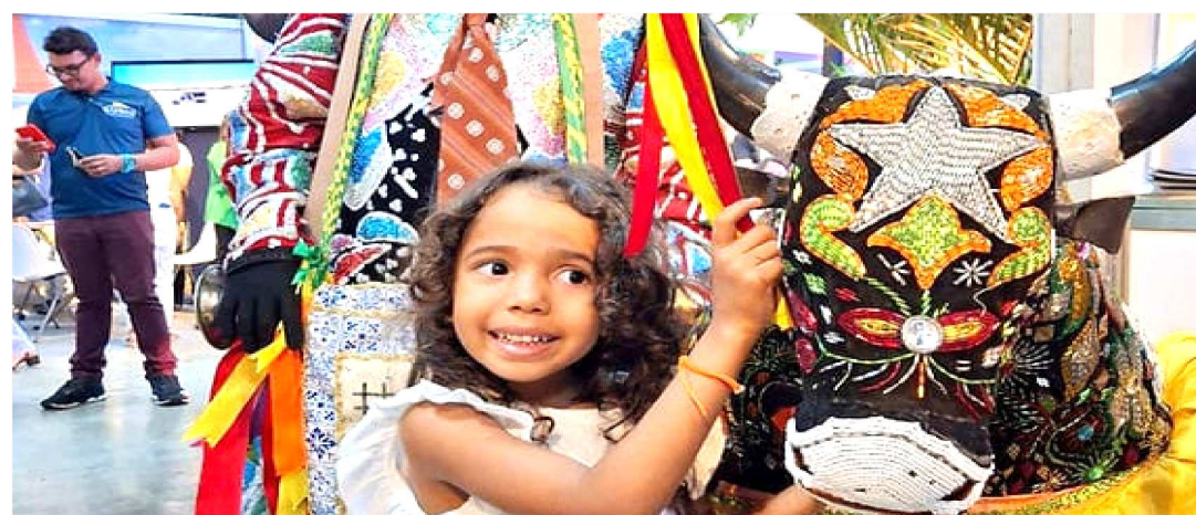
DIVERSIDADE CULTURAL, GASTRONÔMICA E O LITORAL DE SÃO LUÍS, FORAM DESTAQUE NA FEIRA

Com o objetivo de atrair visitantes piauienses, a Secretaria de Turismo de São Luís, participou da II Fetur – edição Piauí, que aconteceu de 19 a 20, no Centro de Convenções de Teresina e reuniu representantes do trade turístico e gestores públicos em torno do fortalecimento do setor no Nordeste. Entre os destaques do es-