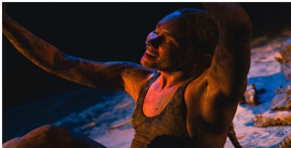
A OBRA-INSTALAÇÃO PROPÕE UMA REFLEXÃO PROFUNDA SOBRE ANCESTRALIDADE

mangue escorre pelos pés, o corpo cai. A lama acolhe. Em ARGILA, a memória não é lembrança distante, é matéria viva que pesa, suja e sustenta. A voz da avó atravessa o tempo, conta histórias, adverte e cuida. Sonhar não é fuga, é compromisso. O corpo aprende a cair, a escutar, a resistir. Uma cidade de barro se ergue e se desfaz diante dos olhos, como tudo o