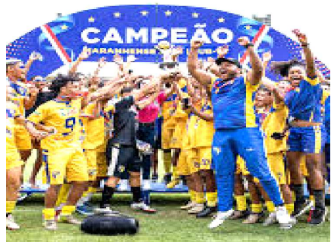
O IAPE é o atual campeão Maranhense de 2026

Sampaio Corrêa, Moto Club e IAPE estão no Grupo A 6 e vão enfrentar nesta primeira fase Maracanã e Iguatu-CE, e Parnahyba-PI. O IAPE estreará contra o Maracanã no Nhozinho Santos, dia 4 de abril. Já o Sampaio Corrêa jogará com o Iguatu fora de casa, enquanto o Moto estreará dia 5, em São Luís, diante do Parnahyba.