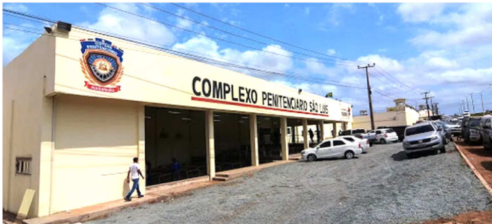
739 PESSOAS (715 HOMENS E 24 MULHERES) FORAM CONTEMPLADAS COM O BENEFÍCIO

As direções dos estabelecimentos prisionais devem informar à Justiça sobre o cumprimento do prazo pelos apenados até as 12h do dia 10 de abril. A saída temporária é um direito garantido (Artigos 122 e 123 da LEP) para quem preenche requisitos específicos: