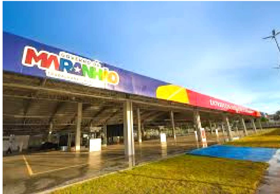
ATÉ O DOMINGO DE PÁSCOA (5 DE ABRIL), O ENTREPOSTO FUNCIONARÁ DAS 2H ÀS 12H

Além de apoiar diretamente pescadores, marisqueiros, feirantes e demais profissionais envolvidos na atividade, a iniciativa também busca ga-