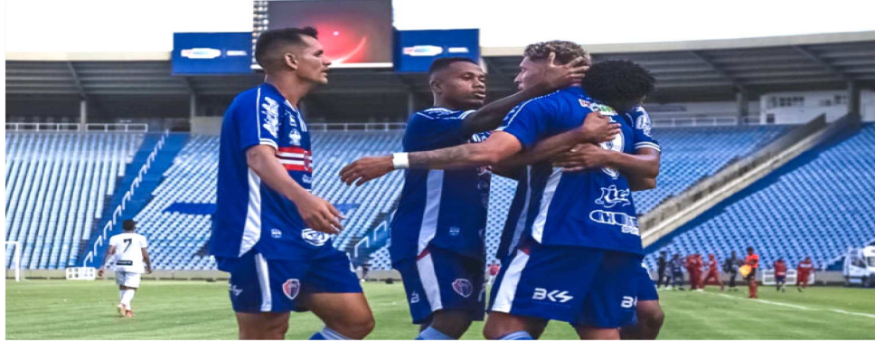
O MARANHÃO ATLÉTICO DEVE JOGAR A SÉRIE C DO BRASILEIRO NO ESTÁDIO CASTELÃO

Depois desta partida, o MAC só voltará a jogar em São Luís no dia 25, contra o Volta Redonda-RJ, e o confronto também está programado para a praça esportiva do Outeiro da Cruz. É bom lembrar que naquele local estará acontecendo o show musical da banda Guns N' Roses no dia 21 de