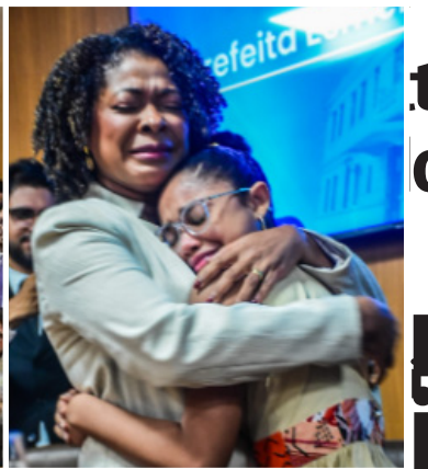
A sessão de posse foi marcada por diversos momentos de profunda emoção. Em seu discurso, ela relembrou sua trajetória pessoal e profissional, quando os desafios e as lutas que enfrentou ao longo da vida.