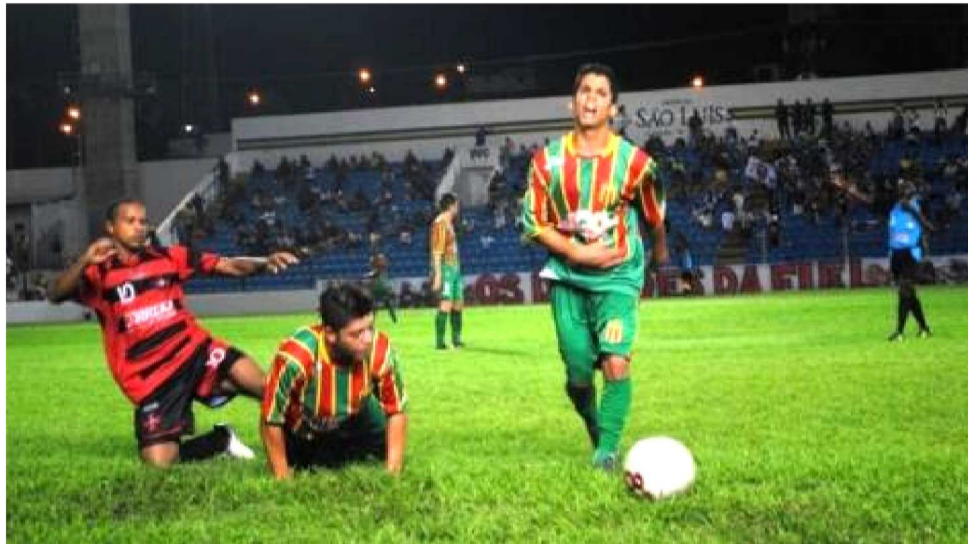
O SUPERCLÁSSICO VAI SER DISPUTADO NO NHOZINHO SANTOS APÓS 14 ANOS