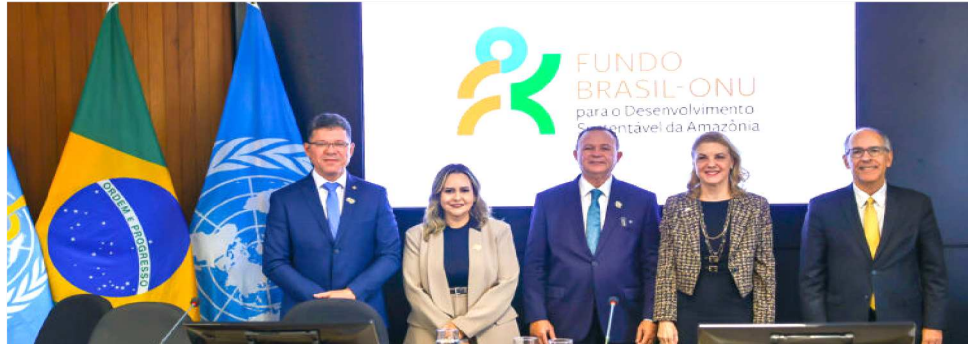
BRANDÃO ASSUME FUNÇÃO POR SER PRESIDENTE DO CONSÓRCIO AMAZÔNIA LEGAL

O governador Carlos Brandão ressaltou que a 4ª reunião do Comitê Diretivo do Fundo Brasil-ONU, em Brasília, foi mais um encontro estratégico para fortalecer políticas públicas e impulsionar o desenvolvimento sustentável na Amazônia. “Alinhamos diretrizes, priorizamos projetos e garantimos a aplicação correta dos recursos