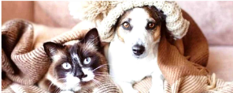
PROJETO ESTABELECE REGRAS E RESTRIÇÕES PARA ESSE TIPO DE GUARDA

O modelo só vale para animais que conviviam com o casal antes da separação. O juiz deve considerar fatores como ambiente adequado, condições de cuidado, zelo, sustento e disponi-