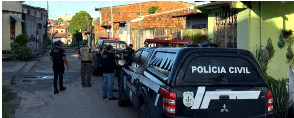
A OPERAÇÃO FOI DEFLAGRADA NAS CIDADES DE SÃO LUÍS E SÃO JOSÉ DE RIBAMAR

A operação foi baseada em uma investigação conduzida pelo Departamento de Combate a Crimes Tecnológicos (DCCT/SEIC), que identificou a exigência de R$ 20 mil por parte dos suspeitos para evitar a divulgação de imagens íntimas de uma vítima. Diante da recusa, o material foi dissemi-