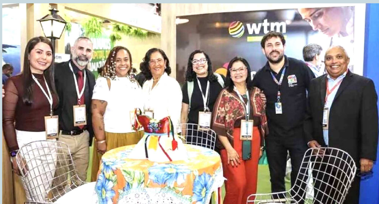
A conquista do Prêmio M&E Awards pelo Turismo de Comunidade encheu de orgulho a caravana maranhense presente no evento

A feira, que acontece no Expo Center Norte até quinta-feira (16), também foi palco de grandes inovações, como o lançamento da plataforma Desbrava pela Embratur e Sebrae Nacional. Para o Maranhão, a WTM 2026 já se consolidou como uma vitrine histórica de inovação e valorização das nossas riquezas.