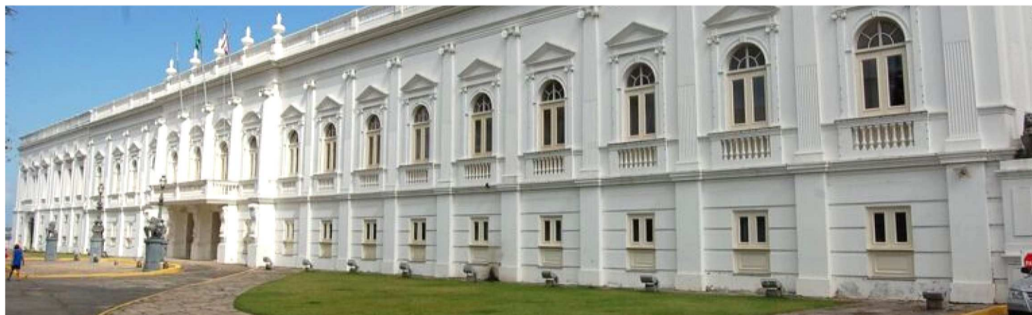
TRANSIÇÃO DE PASTAS É VISTA COMO ESTRATÉGIA POLÍTICA NA CORRIDA À SUCESSÃO AO COMANDO DO PALÁCIO DOS LEÕES

A SECAP, nesse cenário, assume papel central. É o órgão responsável por intermediar a relação entre o governo estadual, prefeitos, vereadores e demais lideranças políticas. A estrutura, inclusive, opera por meio de superintendências regionais que funcionam como braços do governo no interior, reforçando a presença institucional e a execução de políticas públicas em todo o território maranhense. Dessa forma, colocar um nome com perfil articulador no comando da pasta significa ampliar a capacidade de mobilização política do governo às vésperas do ciclo eleitoral.