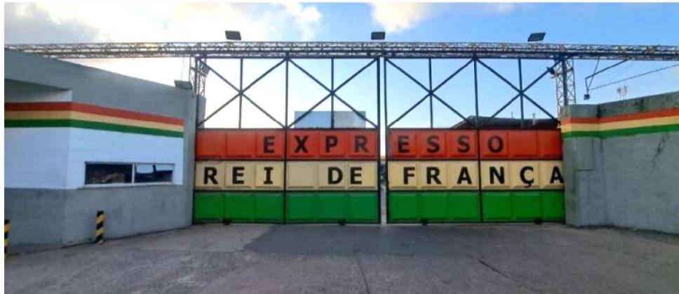
EXPRESSO REI DE FRANÇA, ENCONTRA-SE ATUALMENTE SOB INVESTIGAÇÃO JUDICIAL

Com a decisão, a Prefeitura de São Luís tem o prazo de 48 horas para assumir integralmente a operação das linhas correspondentes. A gestão poderá atuar de forma direta ou por meio de contratação emergencial. Para garantir a continuidade do serviço à população, a Justiça autorizou a requisição administrativa de até 30 ônibus da empresa Vamos Locação. A locadora possui ligações com os antigos proprietários das empresas Rei de