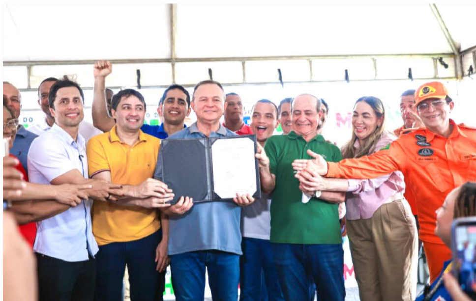
ESPAÇOS PÚBLICOS DE SÃO LUÍS RECEBERÃO INFRAESTRUTURA E REQUALIFICAÇÃO

“Estamos fazendo as obras estruturantes, mas não podemos esquecer dos bairros, então, estamos com várias obras nos bairros, e exemplo de re-