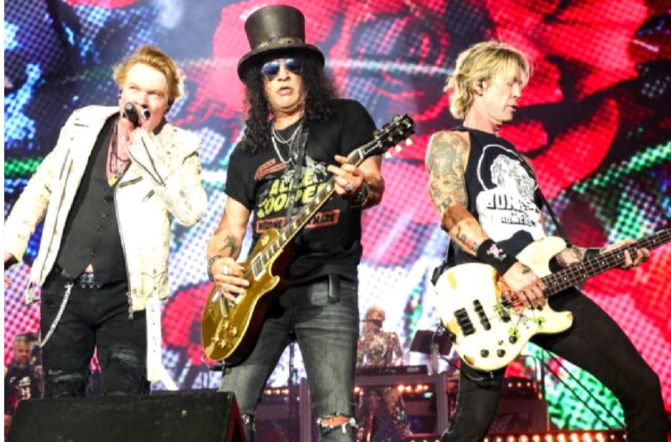
INDIO, CALIFORNIA - OCTOBER 06: (EDITORIAL USE ONLY) (L-R) AXL ROSE, SLASH, AND DUFF MCKAGAN OF GUNS N' ROSES PERFORM ONSTAGE DURING THE POWER TRIP MUSIC FESTIVAL AT EMPIRE POLO CLUB ON OCTOBER 06, 2023 IN INDIO, CALIFORNIA.

Para os empreendedores, o momento exige preparo e estratégia para atender bem o público e aproveitar ao máximo as oportunidades. De acordo com Hildenê Maia, gerente de Empreendedorismo Territorial do Sebrae no Maranhão, o planejamento é o primeiro passo. “É importante que os empresários entendam esse impacto e se antecipem. Mapear os eventos,