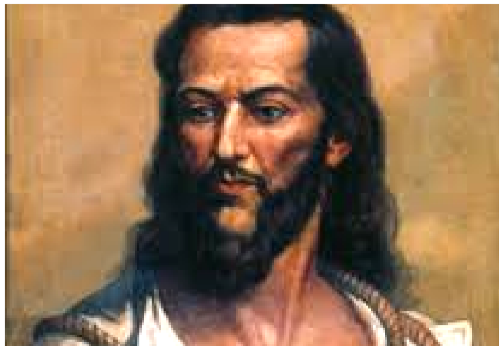
TIRADENTES, MÁRTIR DA INCONFIDÊNCIA FOI ENCORCADO E ESQUARTEJADO

De acordo com os fatos registrados nas páginas da história e em documentos oficiais do país, em 1789, quando a conspiração em Vila Rica foi descoberta, a Coroa Portuguesa rea-