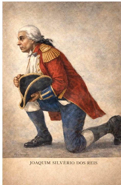
JOAQUIM SILVÉRIO DOS REIS