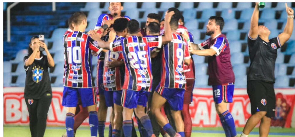
NA SÉRIE C, O MAC DISPUTOU 3 JOGOS, NÃO OBTVEVE NENHUMA VITÓRIA

querdo do goleiro Jean para balançar a rede. No segundo, um lançamento para o lado direito e o zagueiro simplesmente cabeceou para o centro do ataque onde o adversário, outra vez, livre, fez 2 a 0. Estes foram apenas dois de quase uma dezena de erros naquela noite.