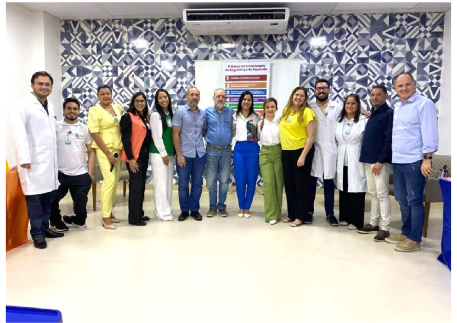
Time de lideranças do HSE – HSLZ reunido no evento de conscientização sobre Segurança do Paciente