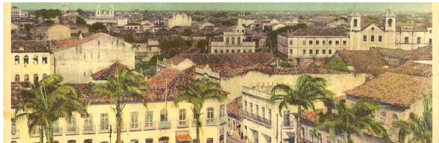
NA "DEVASSA", ESPÉCIE DE MONITORAMENTO DA COROA, SÃO LUÍS, TRADUZIU-SE EM UM AMBIENTE DE SUSPEITA PERMANENTE

Esse processo de "limpeza simbólica" visava romper os laços visuais com o passado colonial e imperial, substituindo-os por novos heróis e símbolos nacionais. A cidade passou a viver sob um rigoroso sistema de fiscalização. Livros considerados subversivos eram monitorados, correspondências eram interceptadas e viajantes submetidos a inspeções constantes. O objetivo era claro: impedir que o debate sobre liberdade, autonomia e república chegasse às elites intelectuais e econômicas maranhenses.