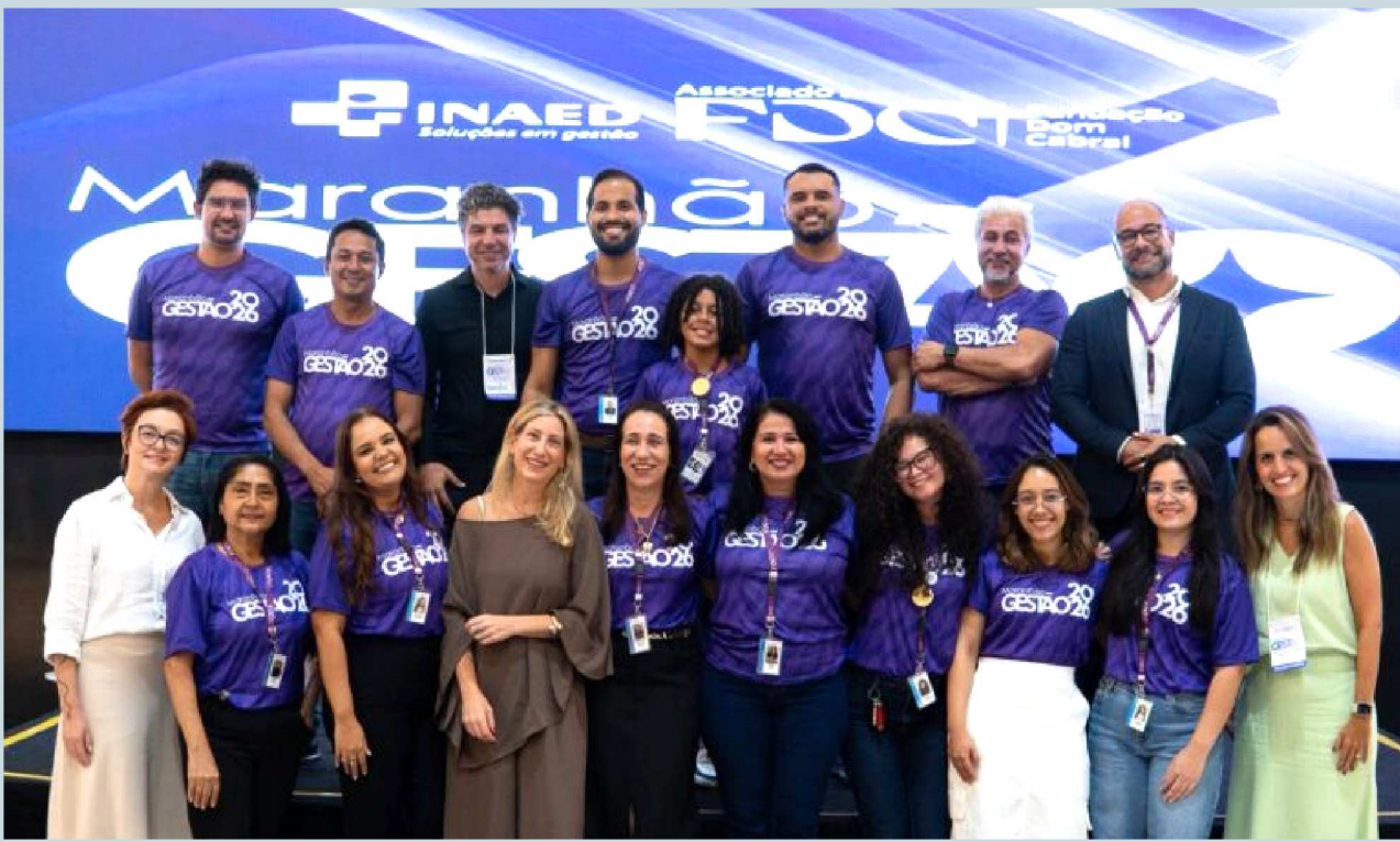
Time Inaed e Fundação Dom Cabral: iniciativas de educação executiva e consultoria da Fundação Dom Cabral voltadas ao desenvolvimento empresarial são conduzidas no Maranhão pelo INAED