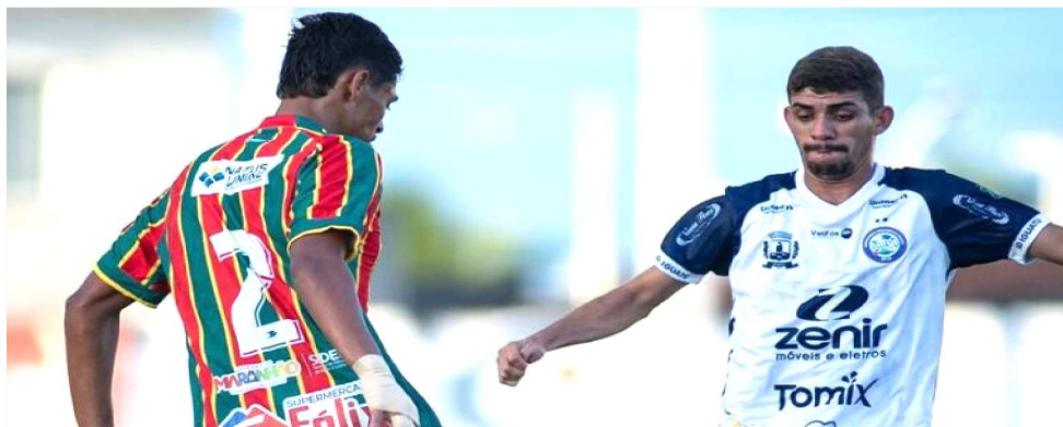
AS EQUIPES MARANHENSES MARCARAM POUCOS GOLS NAS COMPETIÇÕES NACIONAIS

O campeonato está apenas começando, mas nos três primeiros jogos disputados os destaques do Grupo A6 são Iguatu e Maracanã, ambos do estado do Ceará, com 7 pontos e aproveitamento de 77%. Nas últimas colocações estão Parnahyba e Moto Club.