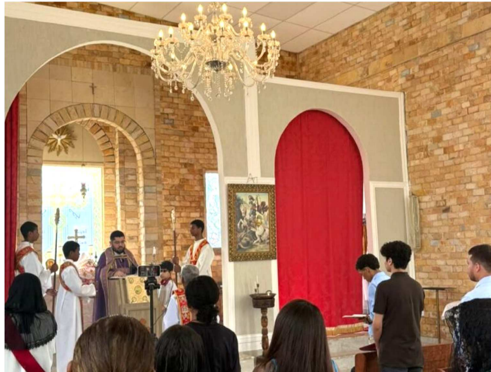
IGREJA DE SÃO JORGE SE CONSOLIDA COMO REFERÊNCIA DESSA DEVOÇÃO

Único templo dedicado ao santo no estado, a igreja carrega uma história ligada à imigração de cristãos do Oriente Médio, que trouxeram consigo a devoção ao mártir conhecido por sua coragem e fidelidade à fé cristã. Com o passar dos anos, a comunidade cresceu e passou a atrair também brasileiros, tornando-se um ponto de en-