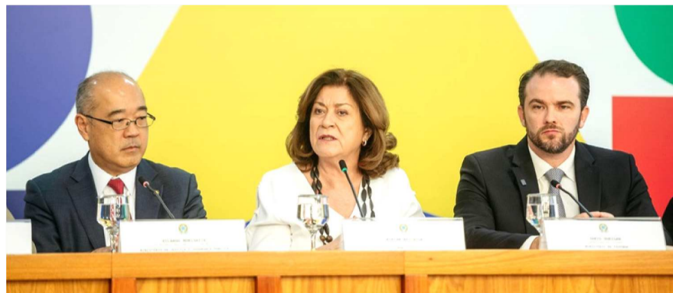
CONFRONTO ÀS BETS ILEGAIS JÁ RESULTOU NO BLOQUEIO DE MAIS DE 39 MIL SITES

Com o objetivo de intensificar o combate ao mercado ilegal e garantir maior proteção ao consumidor e à economia popular, o Ministério da Fazenda comunicou à Anatel a lista de