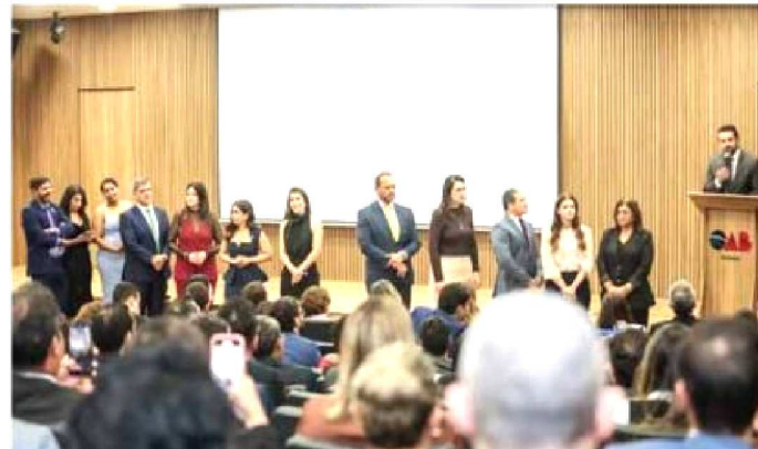
A celebração dos 94 anos conecta passado, presente e futuro, reafirmando o protagonismo da OAB Maranhão como uma instituição essencial não apenas para a advocacia, mas para toda a sociedade,