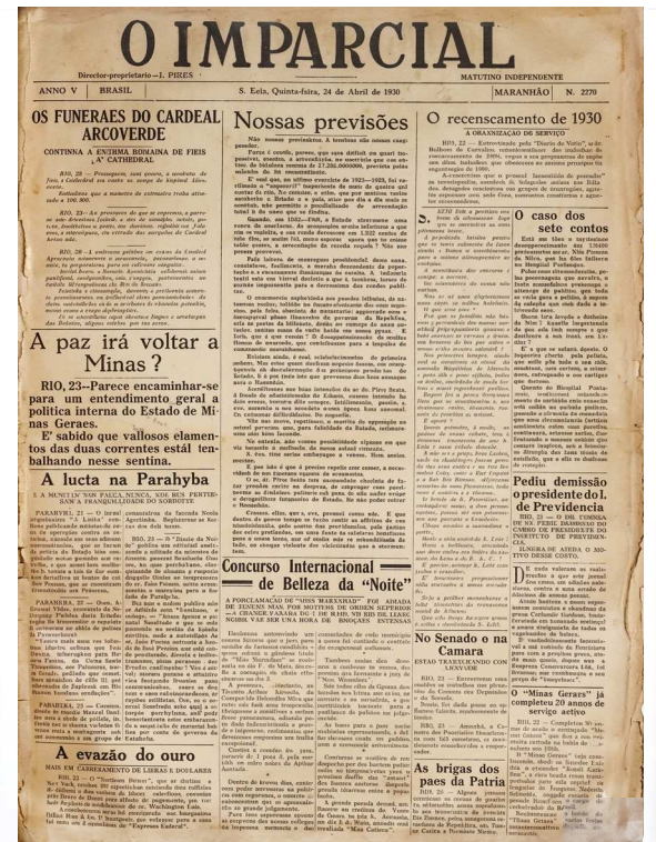
O IMPARCIAL { Neste dia, 24 de abril de 2030, nasceu José Ribamar Ferreira de Araújo Costa (José Sarney)