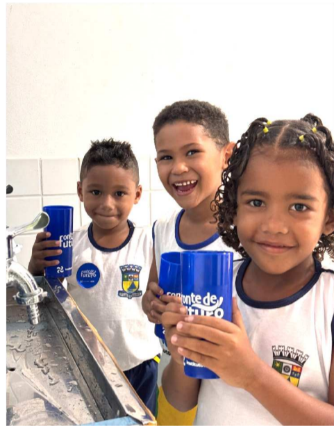
Com a expansão, o Projeto Fonte de Futuro passa a beneficiar 52 institui-

poimentos para um documentário da Organização das Nações Unidas sobre os impactos sociais de iniciativas voltadas ao acesso à água e à educação.