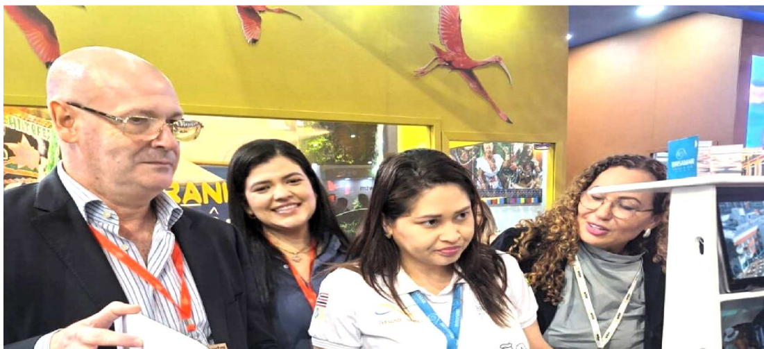
EMPRESARIADO E GESTORES DIVULGARAM O MARANHÃO NA FEIRA DE TURISMO

O Maranhão vive um momento especial, boas expectativas para o segmento turístico e feiras como a WTM, só eleva essa posição no cenário internacional.