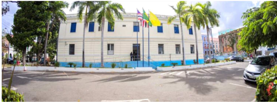
PARLAMENTO MUNICIPAL QUER AMPLIAR A REDE DE PROTEÇÃO NA CAPITAL SÃO LUÍS

Nesse contexto, a Câmara realiza, na próxima terça-feira (28), o painel “Como Fazer uma Cidade Melhor para as Mulheres Viverem”, a partir das 14h, no Plenário Simão Estácio da Silveira. A atividade é fruto de parceria com a Defensoria Pública do Estado do Maranhão, por meio do projeto “Te