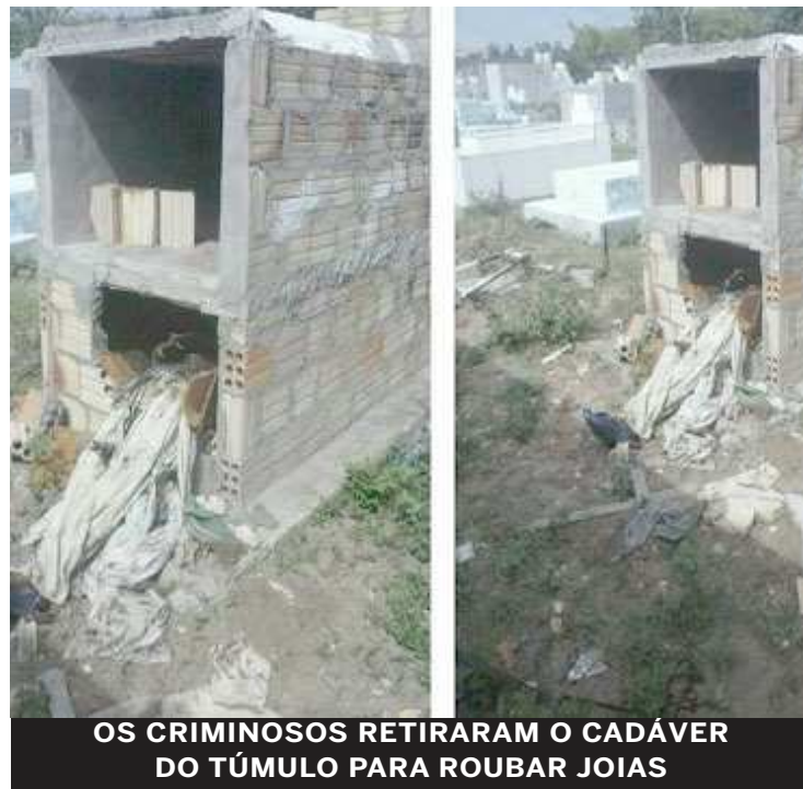
OS CRIMINOSOS RETIRARAM O CADÁVER DO TÚMULO PARA ROUBAR JOIAS

Os ladrões arrombaram o túmulo e retiraram o cadáver, deixando a população chocada. A Polícia foi acionada. Até o momento não houve confirmação se os ladrões obtiveram êxito no ato criminoso e desrespeitoso.