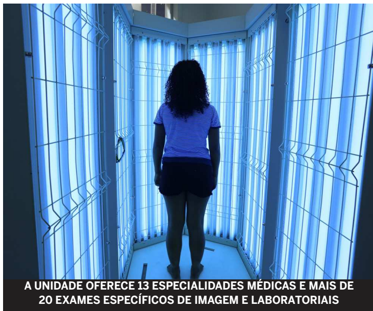
A UNIDADE OFERECE 13 ESPECIALIDADES MÉDICAS E MAIS DE 20 EXAMES ESPECÍFICOS DE IMAGEM E LABORATORIAIS

Na área dermatológica, a Fototerapia, disponibilizada desde maio de 2016, é usada para o tratamento de doenças de pele como psoríase, vitiligo ou linfoma cutâneo. O equipamento oferece acesso ao tratamento, contribuindo para a redução destas doenças. De janeiro a dezembro do ano passado, 5.567 sessões de fo-