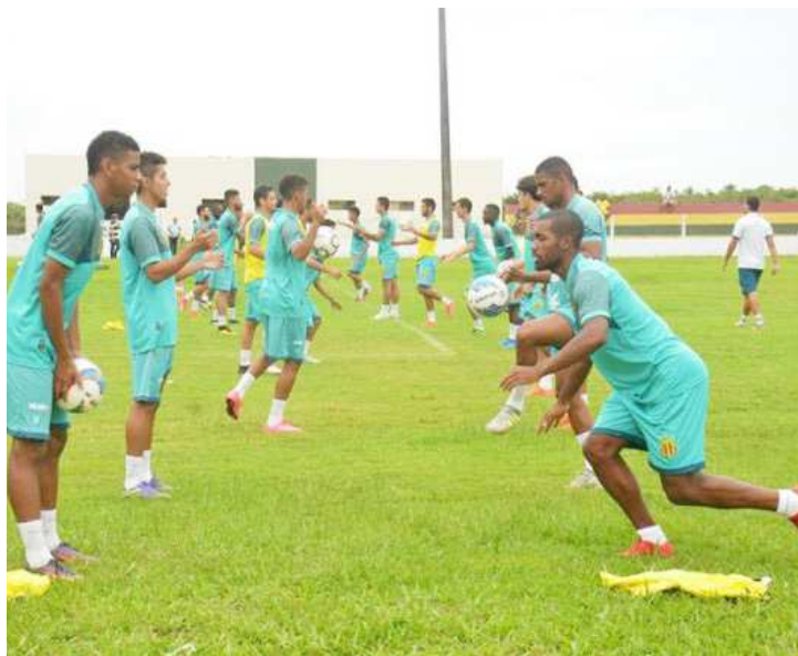
JOGADORES DO SAMPAIO CORRÊA VÃO FAZER APENAS UM TREINO ANTES DO SUPERCLÁSSICO

No entanto, o treinador ainda não definiu quais jogadores serão poupados, nem adiantou os substitutos. Tudo dependerá da avaliação completa que o grupo passará durante a reapresentação, que vai definir o nível de fadiga muscular e condição física de cada atleta individualmente.