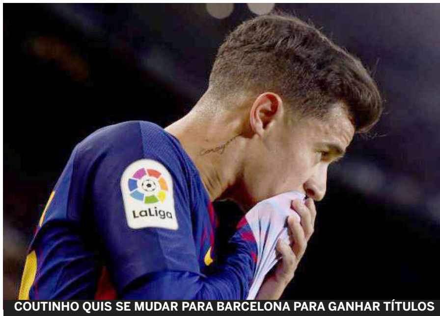
COUTINHO QUIS SE MUDAR PARA BARCELONA PARA GANHAR TÍTULOS

Em seus cinco anos no Liverpool, Coutinho não ganhou um título sequer.