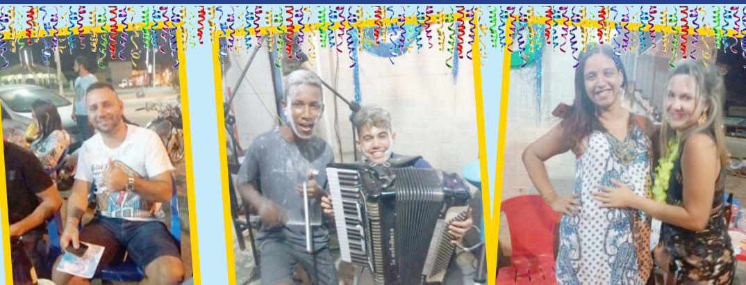
Segunda com Fole no maior clima do carnaval