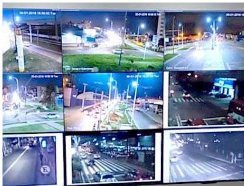
MAIS DE 60 CÂMERAS ESTÃO ESPALHADAS EM VÁRIOS PONTOS DA CIDADE