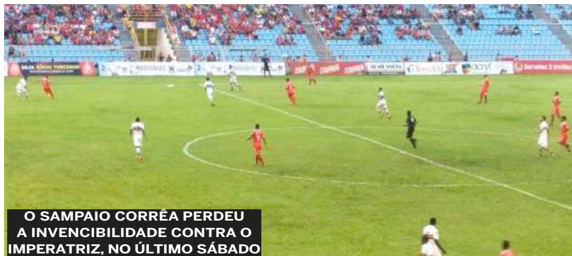
O SAMPAIO CORRÊA PERDEU A INVENCIBILIDADE CONTRA O IMPERATRIZ, NO ÚLTIMO SÁBADO