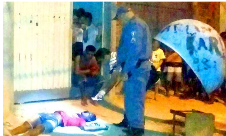
Vítima foi executada com cinco tiros por dois homens não identificados

Cinco disparos acertaram a vítima, sendo um na cabeça, outro no tórax e três no braço esquerdo.