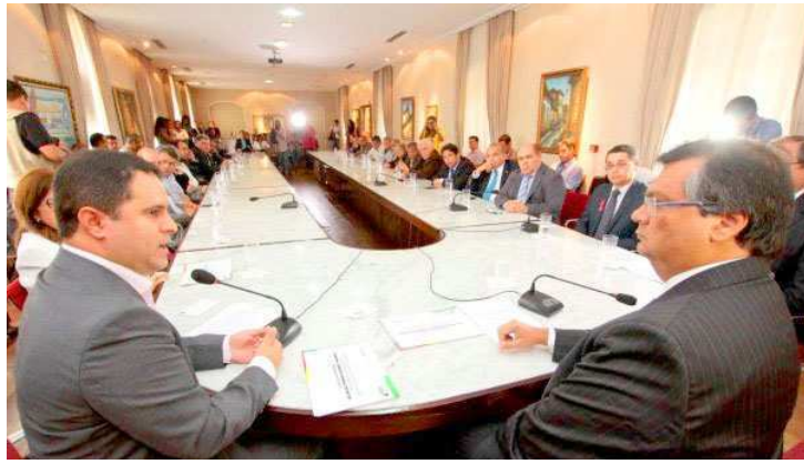
Governador ao lado do prefeito durante a celebração de convênio