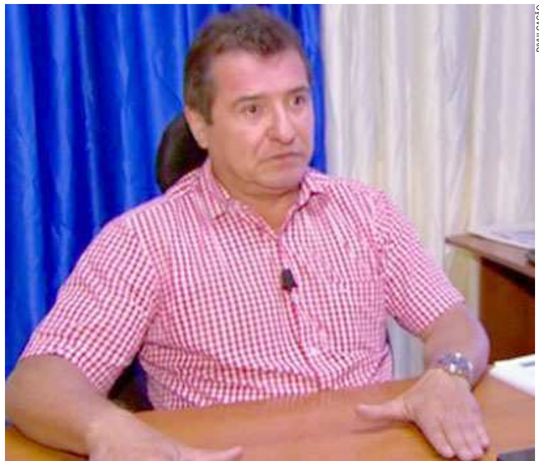
Prefeito de Anajatuba é acusado de receber todo o montante desviado pelo esquema fraudulento