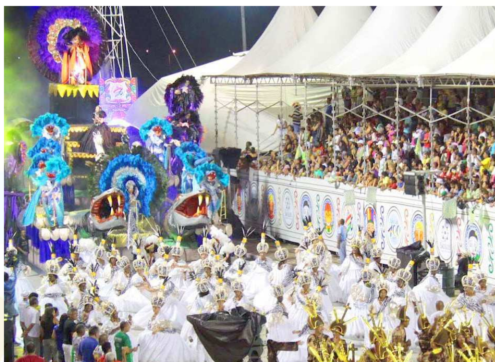
Maioria das escolas já definiu seus temas para disputar mais um título de campeão do carnaval