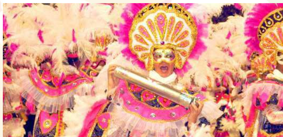
Blocos tradicionais dos grupos A e B desfilarão nos dias 5 e 6 de fevereiro, na Passarela do Samba