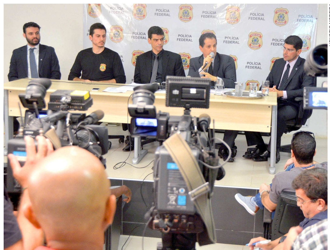
Durante a entrevista coletiva à imprensa, policiais federais revelaram como envolvidos no esquema agiam