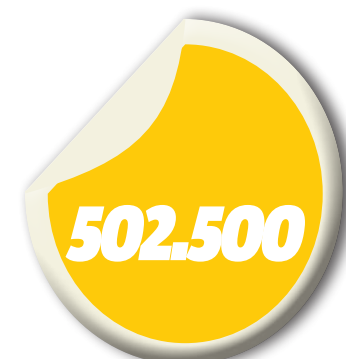
Estimativa do número de migrantes que chegaram ao território grego

Nas mesmas declarações em Genebra, a porta-voz do Acnur lembrou que os refugiados "não são migrantes", uma vez que são pessoas que foram obrigadas a fugir dos respectivos países, onde suas vidas correm perigo, definição prevista no Direito Internacional. "Os sírios, os iraquianos e os eritreus são incontestavelmente refugiados", frisou ainda Melissa Fleming, lamentando que os dois termos, migrantes e refugiados, sejam muitas vezes utilizados como sinônimos, o que não é correto.