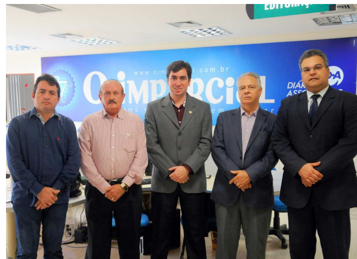
Conselheiros portugueses realizaram visita de cortesia ao jornal