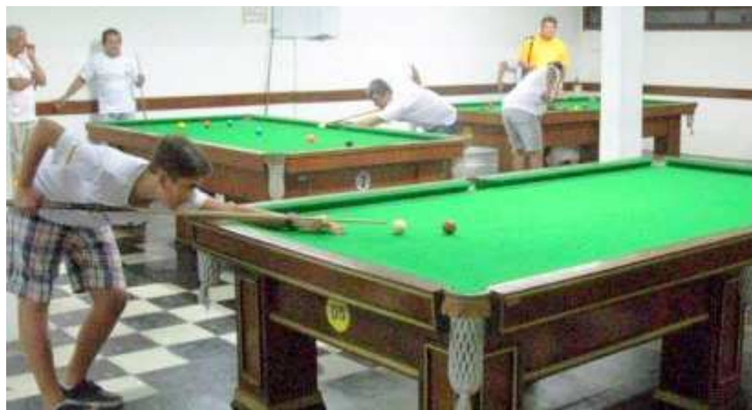
Nos últimos dias, jogadores de sinuca que vão representar o Maranhão intensificaram os treinamentos