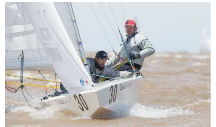
Brasileiros fizeram bonito e conquistaram Mundial de Vela