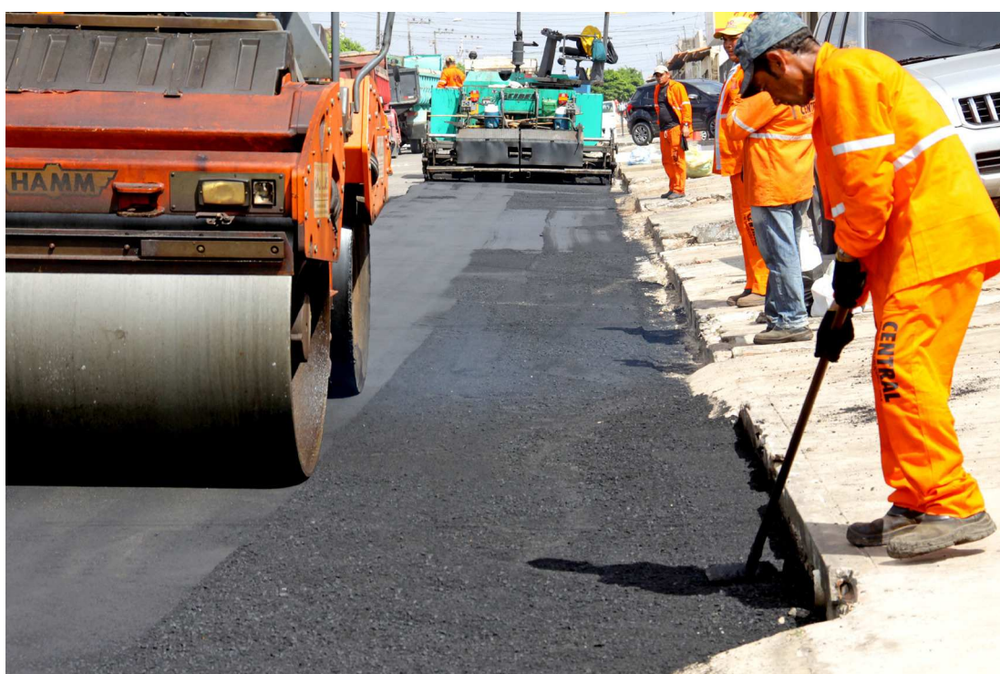
Governo do Estado concluiu neste ano a pavimentação em 17 cidades do Maranhão, com 117km de asfalto

As obras de pavimentação em 59 municípios encontram-se em fase final, previstas para serem concluídas e entregues