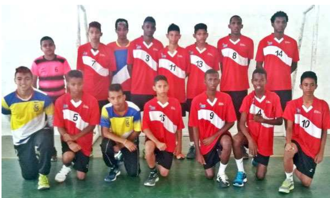
É a quinta vez que a escola Santa Clara participa da competição e a terceira em que retorna com premiações