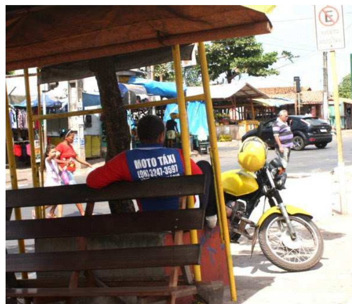
Os autorizatários terão que realizar sua atualização cadastral