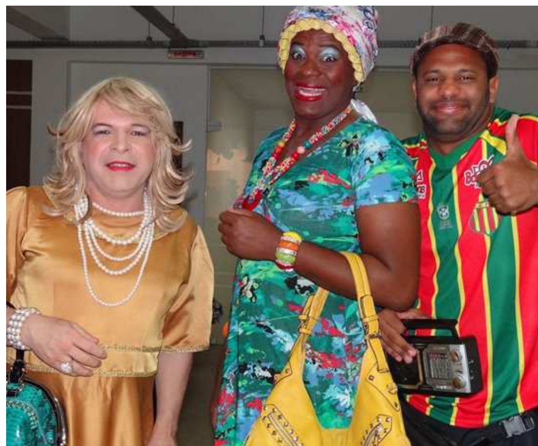
A Vingança de Zé Maria será apresentado logo após a solenidade de abertura da Semana de Teatro do MA