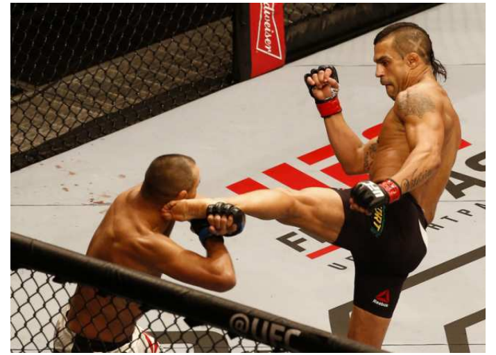
Victor Belfort acerta o adversário e se recupera da derrota para Dan