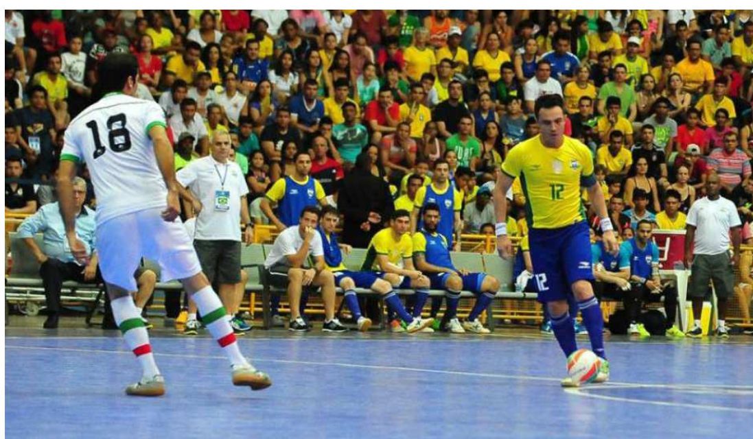
O craque Falcão teve grande atuação e deu de ombros para a lesão que o afastou de boa parte da disputa

“Sou um cara cujo prazer é jogar. Só não jogo se não tiver jeito mesmo. Não foi da forma que eu queria, do jeito que eu