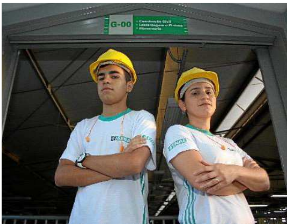
Para o presidente da CNI, Robson Braga: "Sem trabalhadores qualificados, demoraremos para sair da crise"

Segundo Nogueira, o processo negocial evoluiu no início, mas estacionou há três semanas. "A expectativa é de que a ameaça de uma medida provisória reduzindo as alíquotas do Sistema S esteja descartada, até porque isso causaria embate no Congresso, e a redução da receita traria transtorno operacional e a diminuição de serviços oferecidos à população. Esperamos que o governo possa resolver a questão sem se intrometer no