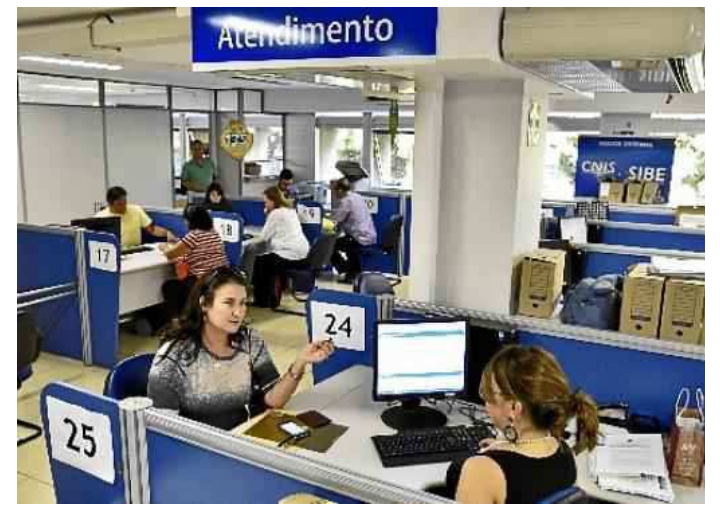
Interessado deve preencher ficha para que a contribuição seja realizada