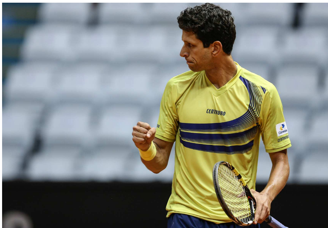
Tenista Marcelo Melo vibrou muito após a conquista do quarto título consecutivo nesta temporada

Após vencer do ATP 500 do Japão, o Masters 1000 de Xangai e o ATP 500 de Viena, o tenista chega a sua 15ª vitória seguida em 2015 e agora se prepara para encerrar a temporada no ATP World Tour Finals, em Londres, na próxima semana.