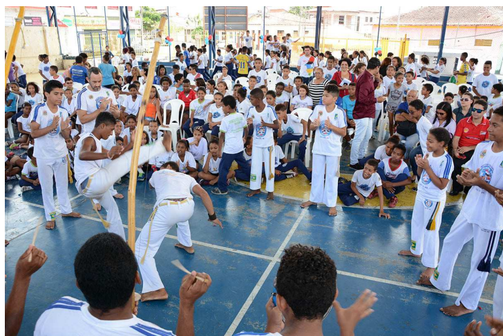
Estudantes em evento que confirmou a escola Barbosa como núcleo

O Maranhão recebeu investimento de R$ 5 milhões para a im-