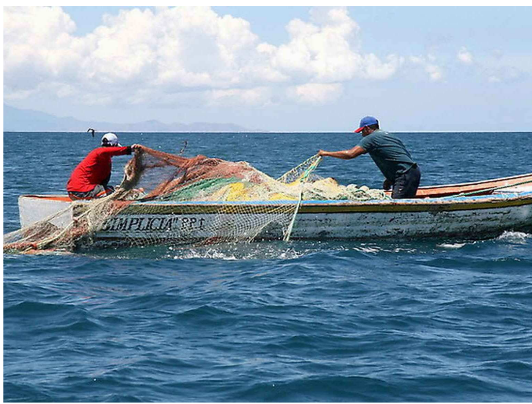
Durante o defeso, o governo paga o seguro-defeso, benefício no valor de um salário mínimo a pescadores

A portaria conjunta dos ministérios da Agricultura e do Meio Ambiente foi publicada no Diário Oficial da União em 9 de outubro. De acordo com os ministérios, a suspensão foi necessária para que os comitês Permanentes de Gestão e Uso Sustentável de Re-