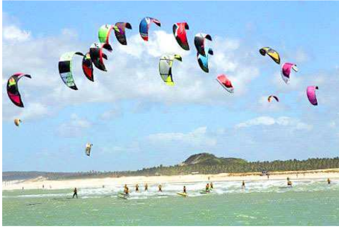
O kitesurf voltará a ser atração e levará muitas emoções às praias de São Marcos e do Meio, em São Luís

A estimativa de público durante todas as etapas é de cerca de 50 mil pessoas circulando pela praia, com a geração de 80 oportunidades de trabalho.