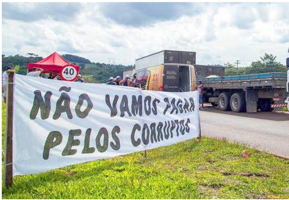
Haverá a suspensão de dirigir, a apreensão, a remoção e o recolhimento dos documentos do veículo

“O governo quer frisar que essas manifestações não têm uma pauta de reivindicações e são claramente políticas. Quando eu obstruo as rodovias, estou praticando atos ilícitos. Não se trata de ação governamental para calar opositor. Trata-se aqui de defender o interesse público