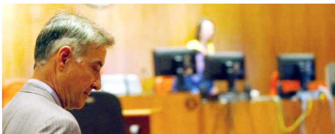
Batista está proibido de exercer cargo administrativo ou de conselheiro fiscal de companhias abertas por 5 anos

Pela legislação, o acionista não pode votar em assembleia