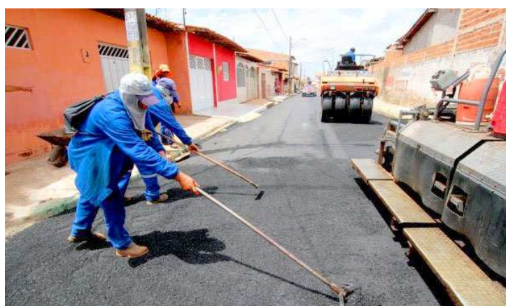
Serviços de requalificação asfáltica realizados na Cidade Operária

A Prefeitura de São Luís, em parceria com o governo do estado, está avançando os serviços de requalificação asfáltica na Cidade Operária, por meio do programa "Mais Asfalto". Ontem, as equipes intensificaram a operação na frente de trabalho aberta na Unidade 201, onde quase a totalidade das ruas foram contempladas com asfalto novo, o que tem sido exaltado pelos moradores da área como a mais ampla obra de pavimentação e melhoria do aspecto urbanístico já executado no bairro. Os serviços são fruto de parceria celebrada entre o município e o governo do estado.