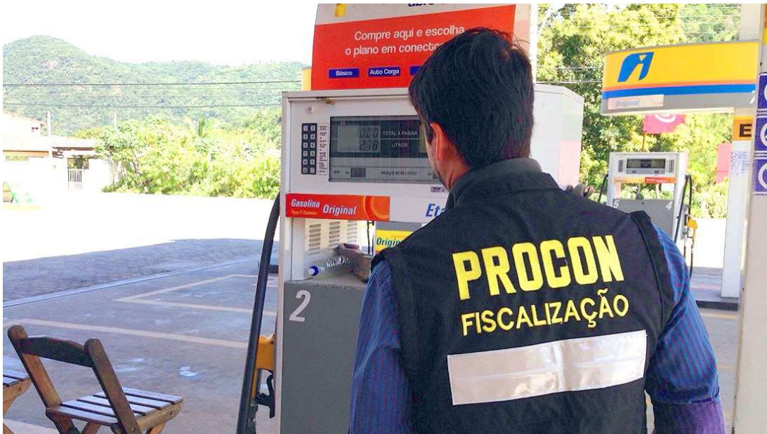
Equipe de fiscalização, com o apoio da PC, constatou a irregularidade e determinou a adequação dos preços

tos também estão proibidos de trocar qualquer tipo de comunicação sobre preços de venda com concorrentes, visando à uniformização, majoração ou manutenção de preços de revenda de combustíveis – prática que configuraria cartel - sob pena de multa de R$ 100 mil por estabelecimento.