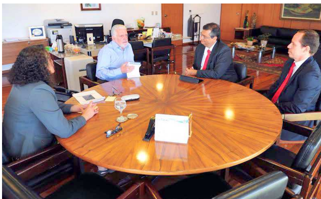
Deputada Jandira Feghali, ministro Jaques Wagner, governador Flávio Dino e o secretário Ricardo Capelli

A retomada dos investimentos na Base de Alcântara e o projeto de instalação no Maranhão, da 2ª Esquadra da Marinha no Brasil, foram apresentados pelo governador ao ministro da Defesa. Estudos