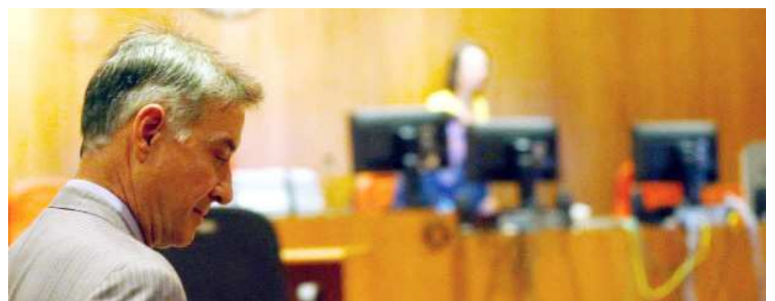
Batista está proibido de exercer cargo administrativo ou de conselheiro fiscal de companhias abertas por 5 anos

Pela legislação, o acionista não pode votar em assembleia