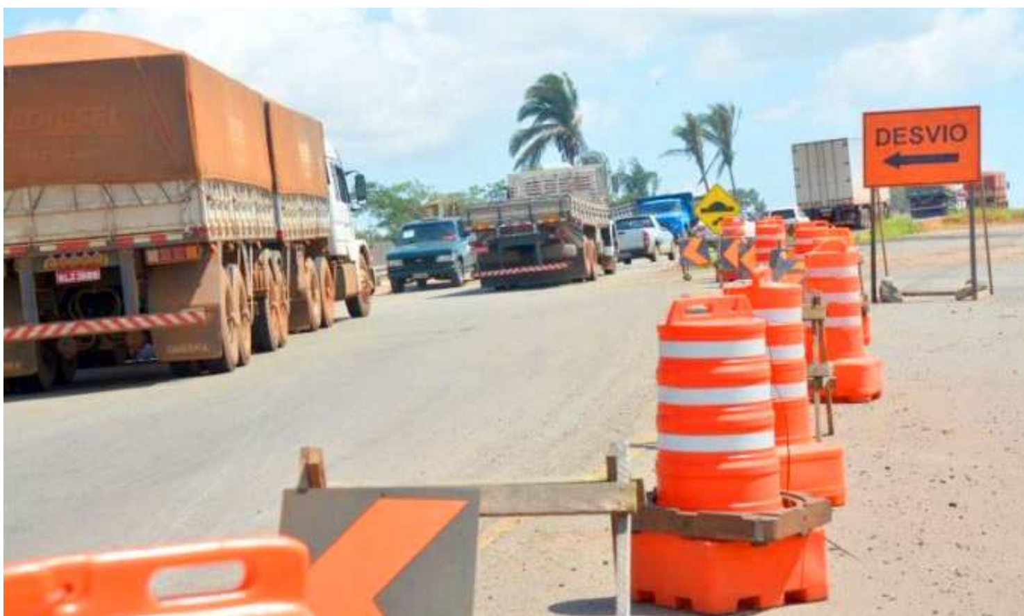
Para evitar acidentes automobilísticos, Dnit colocou em alguns pontos das BR-135 sinalização para orientar os motoristas em Campo de Perizes