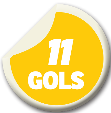
Marca do Sampaio contra o Bragantino

A última vitória do Massa Bruta ocorreu há mais de 13 anos pela Série B de 2002, em Bragança Paulista, quando os donos da casa venceram por 1 a 0. Aquele campeonato, porém,