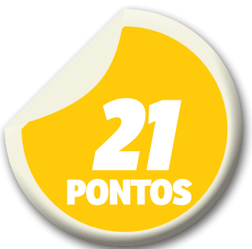
Diferença de Rosberg para Sebastian Vettel, da Ferrari

Em seguida, o piloto garantiu estar motivado para voltar a vencer em São Paulo no próximo domingo, embora tenha como único objetivo maior neste final de temporada apenas assegurar a vice-liderança do Mundial - ele está 21 pontos à frente de Sebastian Vettel, da Ferrari, a duas provas para o final do campeonato.