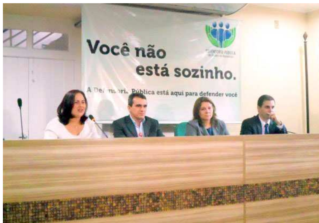
Gestores de instituições acreditam que iniciativa impulsionará cadastro das famílias ao benefício social

As famílias contempladas com a tarifa social podem ter um desconto de até 65% no valor da conta de energia. O cálculo é feito a partir do consumo mensal. Todas as pessoas inseridas no CadÚnico, com dados atualizados, que apresentarem o número da unidade consumidora podem ser incluídas no Programa Tarifa Social, estabelecido pela Lei 10.438/2002 e regulamentado pela Agência Nacional de Ener-