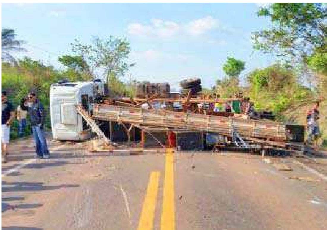
Em outro acidente na BR-010, caminhão tombou e ficou atravessado, fechando por completo a rodovia

Na sexta-feira, dia 13, foram registrados dois acidentes com três feridos nas rodovias do estado. Já no último sábado, ocorreram sete acidentes com seis pessoas feridas. No Km 274 da BR 010, o condutor de um Fiat/Uno perdeu o controle do veículo, bateu em um barranco e retornou para a rodovia, invadindo a pista oposta e colidindo lateralmente com dois veículos que vinham em sentido contrário. Um dos veículos atingidos era um caminhão que ficou atravessado no meio da BR, fechando-a por completo. Todos os envolvidos no acidente saíram ilesos. No domingo (15), a PRF registrou cinco acidentes com três feridos e dois mortos.