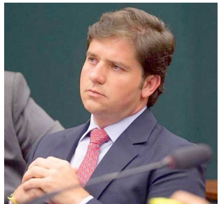
Ex-deputado Argôlo é o terceiro político condenado no âmbito da Lava-Jato

Argôlo é o terceiro político condenado no âmbito da Lava Jato. Em setembro, Moro condenou o ex-deputado federal André Vargas a 14 anos e quatro meses de reclusão. Em outubro, o ex-deputado federal Pedro Corrêa foi condenado a 20 anos e sete meses de prisão.