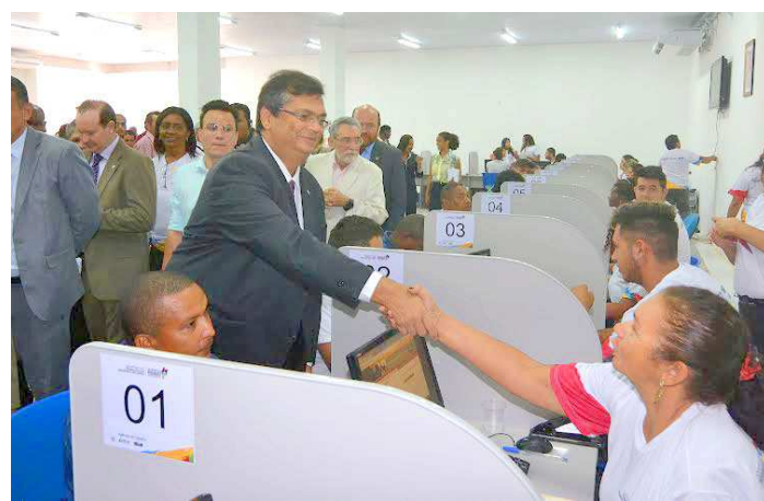
Flávio Dino lançou o 'Mais Trabalho, Mais Renda' para os trabalhadores