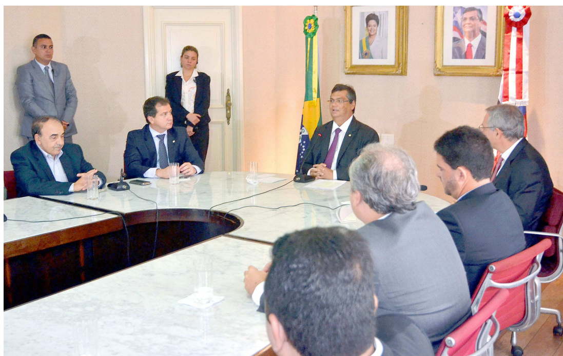
Governador Flávio Dino em reunião com o prefeito de Imperatriz e representantes da empresa Suzano

O investimento de mais de R$ 500 milhões no Maranhão possui dimensão social, à medida que contribui com a geração de emprego, criando oportunidades para o trabalhador maranhense, ao mesmo tempo em que amplia a verticalização da cadeia produtiva no estado. “Os investi-