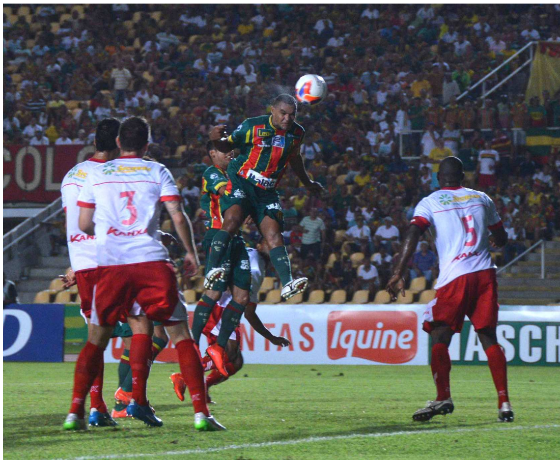
Sampaio empatou muitos jogos. Poderia estar em melhor posição na Série B do Campeonato Brasileiro

De lá para cá, a melhor posição do Tricolor foi o nono lugar em 1991, quando acabou eliminado pelo ABC nas cobranças