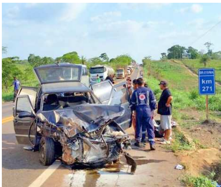
Na BR-010, um veículo saiu da rodovia, invadindo a pista oposta