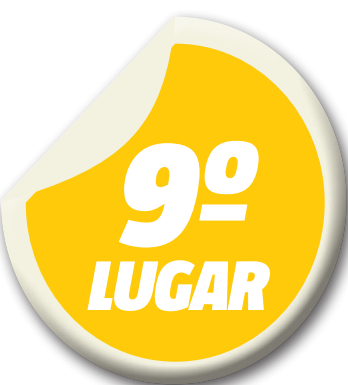
Melhor colocação do Sampaio desde 1972 na Série B

de pênaltis dentro do Estádio Castelão, ainda nas oitavas de final. Para isso, o time tem que somar o maior número de pontos possíveis para não ser ultrapassado por Paysandu e Bahia, que estão logo atrás.