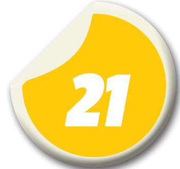
Dia da estreia do Sampaio Basquete

Companheiro de equipe de Holly Holm, o ex-campeão dos pesos-meio-pesados do UFC Jon Jones já havia feito um post parabenizando a nova campeã dos pesos-galos logo após sua chocante vitória sobre Ronda Rousey no UFC 193, na madrugada do último domingo. Ontem, “Bones” voltou a publicar uma mensagem para-