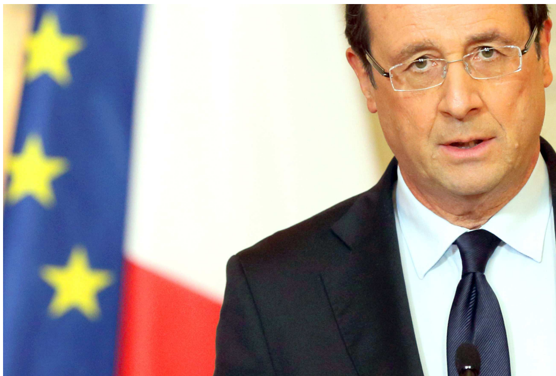
Hollande voltou a dizer que o país está em guerra e afirmou que vai triplicar o poder contra o Estado Islâmico

"Nós erradicaremos o terrorismo, porque nós estamos comprometidos com a liberdade, com a influência da França no mundo", concluiu Hollande, muito aplaudido pelos parlamentares, que logo depois entoaram o hino "La Marseillaise".