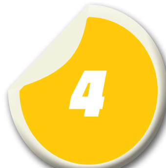
Número de pontos do Brasil nas Eliminatórias

Depois do confronto com o time do Peru, o Brasil só volta a atuar pelas Eliminatórias em março do ano que vem, com jogos contra Uruguai e Paraguai. Del Nero tem uma carta na manga, que se chama Tite, o técnico cada vez mais provável campeão brasileiro de 2015 pelo Corinthians. Tem