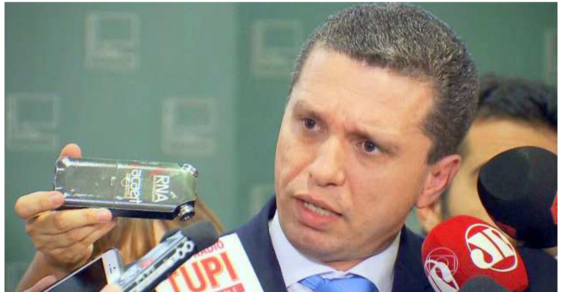
Fausto Pinato informou que o próximo passo ocorrerá no dia 24, quando o Conselho de Ética analisará o relatório

De acordo com o regimento da Casa, o relatório prévio deveria ser entregue por Pinato até quinta-feira (19). Como se declarou convicto, Pinato decidiu antecipar a apresentação. Conforme o relator, "se o caso passar no exame de admissibilidade na votação do Conselho, poderemos fazer um conjunto probatório, de modo a apurarmos melhor. Daí, entraremos no mérito, fase em que Eduardo Cunha terá todo o direito de defesa e poderá trazer qualquer tipo de prova, dentro do contraditório".