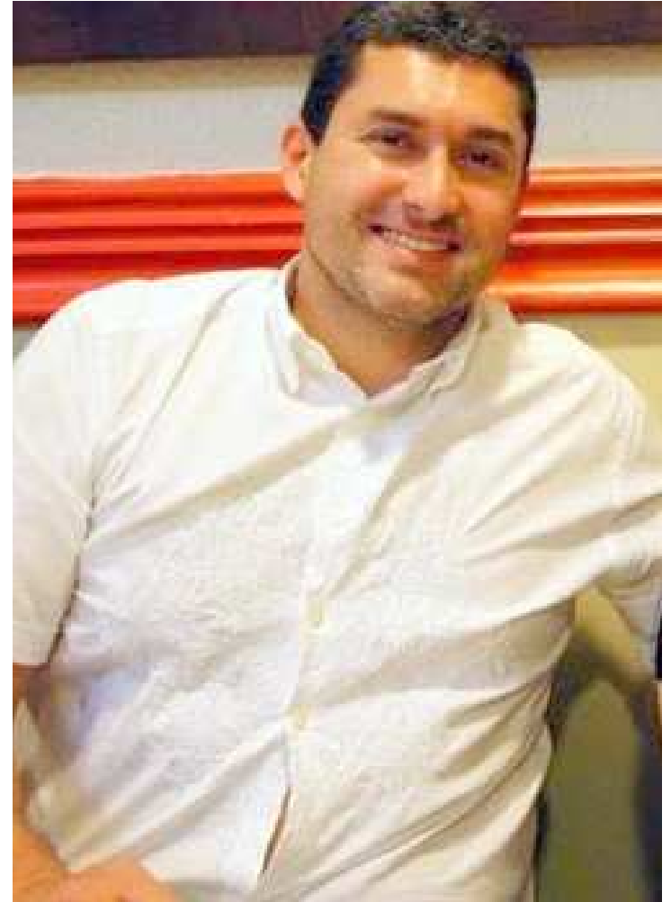
Ex-prefeito do município de Coroatá foi um dos primeiros a serem detidos

A operação foi batizada de Sermão aos Peixes, uma referência à obra literária de autoria de Padre Antônio Vieira, e tinha como objetivo a apreensão de bens e prisão de algumas pessoas ligadas a desvios de verbas, tendo como alvos ex-prefeitos, ex-secretários, outros políticos e empresários. Poucos detalhes foram repassados. A assessoria da Polícia Federal promete divulgar mais informações hoje, às 10h, quando será concedida entrevista coletiva.