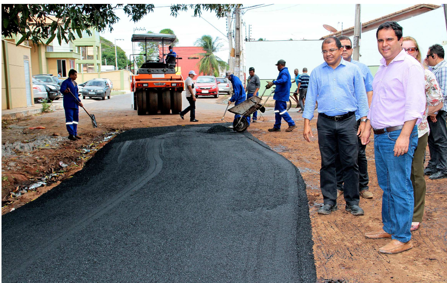
Prefeito Edivaldo Júnior visitou, acompanhado por equipe técnica, as obras de infraestrutura urbana na Vila Apaco e na região da Vila Fialho

"A obra vai proporcionar às comunidades não apenas o melhoramento do escoamento da água, mas também um conjunto de benefícios que vão desde a melhoria na mobilidade urba-