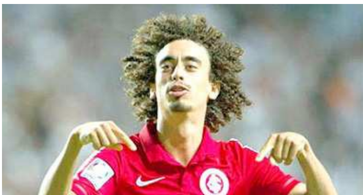
Internacional perde um de seus melhores jogadores nesta temporada