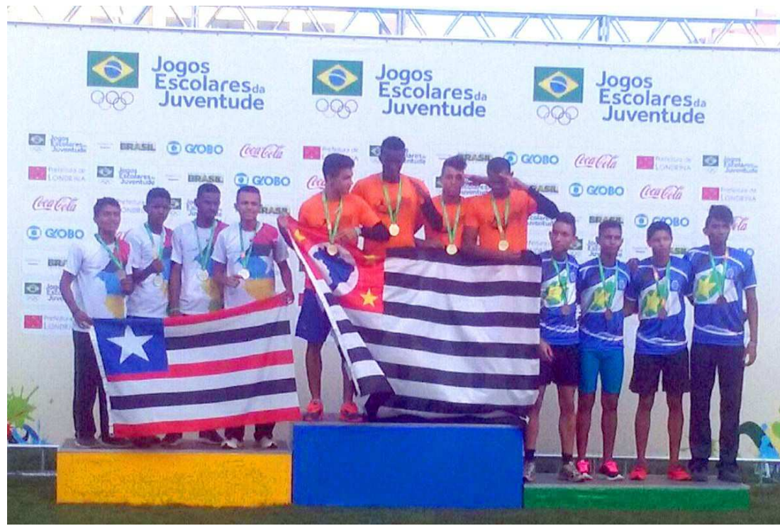
Maranhão no pódio dos Jogos Escolares da Juventude, onde conquistou três medalhas até ontem

Participam da etapa infante dos Jogos Escolares mais de 3.800 jovens atletas de 15 a 17 anos. O evento é organizado pelo Comitê Olímpico do Brasil (COB), com