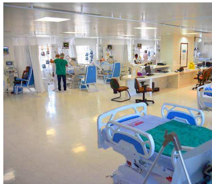
Treinamento visa ao controle de infecção em ambiente hospitalar