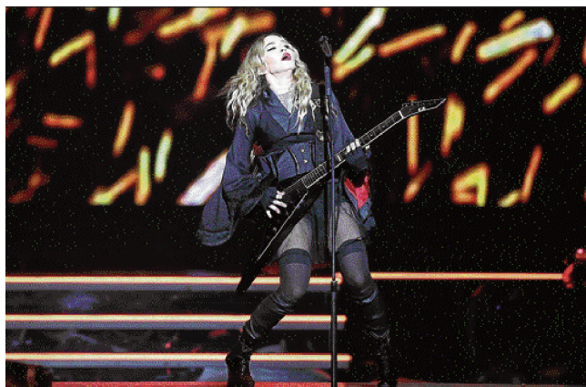
Oliver Berg/AFP - 4/11/15