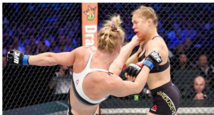
Chute fatal de esquerda em que Holly nocauteou Ronda Rousey