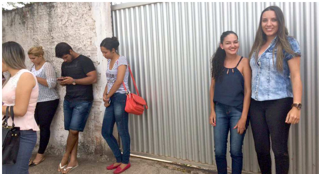
O seletivo é para atuação no fortalecimento e efetivação da atenção primária em municípios de baixo IDH

A Fundação Sôsândrade de Apoio ao Desenvolvimento da Ufma (FSADU) foi responsável pela elaboração e aplicação das provas. As inscrições foram feitas pelo site da Fundação. Foram 12.646 pessoas inscritas, das quais 18%, isto é 2.276 candidatas, faltaram às provas de ontem.