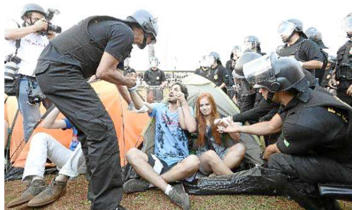
A Polícia Legislativa contou com cerca de 50 homens bem equipados

A PM usou spray de pimenta para dispersar a briga entre os defensores da ditadura e as cerca de 20 pessoas que começaram a gritar contra a volta dos militares ao poder dizendo que não haveria golpe. A troca de socos e empurrões foi imediata e a