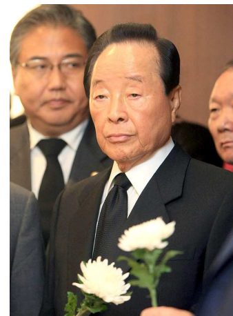
Kim Young-Sam representava o movimento pró-democracia

A presidenta sul-coreana, Park Geun-Hye, expressou “profundas condolências”, de acordo com o seu porta-voz. Seul anunciou que o funeral será quinta-feira (26), após quatro dias de luto. O mandato de Kim ficou marcado por dois grandes eventos: a crise nuclear com a Coreia do Norte, em 1994, e a crise financeira asiática de 1997/1998, quando aceitou um resgate de