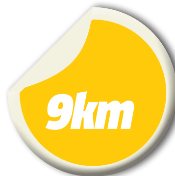
extensão da barreira instalada na Foz do Rio Doce

A água com elevada turbidez ultrapassou as boias de contenção da barreira de 9km instalada por uma empresa, a pedido da Samarco, na Foz do Rio Doce. Segundo a Secretaria de Estado de Meio Ambiente, isso já era esperado, porque as boias são para conter óleo e não lama. Entretanto, a Samarco informou que o esperado com a instalação é isolar a fauna e a flora que vivem no entorno, mas que as bóias conseguiram também conter a parte mais grossa da lama.