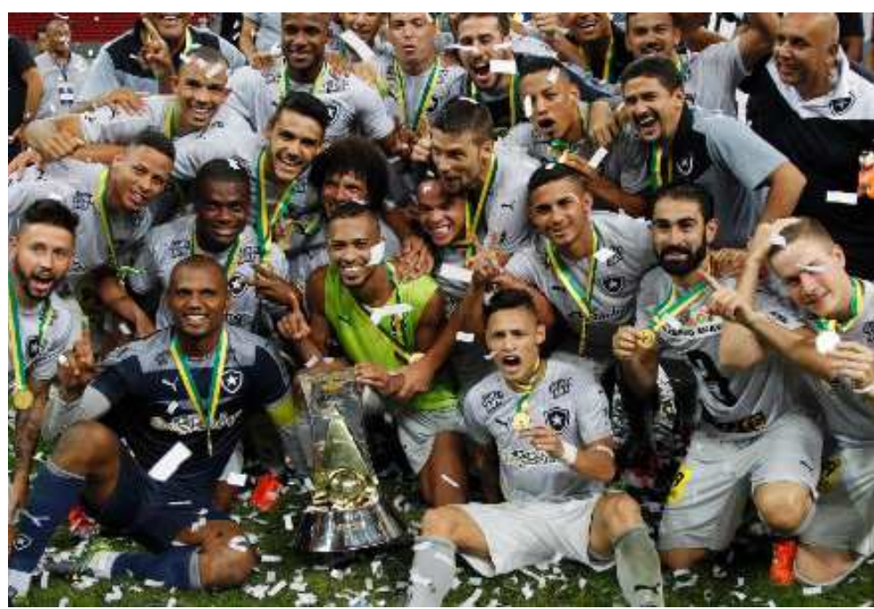
Botafogo fez a festa de campeão da Série B na noite da sexta-feira, ao derrotar o time do ABC

não pode mais ser alcançado pelo quinto colocado, o Bragantino, que chegou aos 60 e permaneceu na quinta colocação, após vencer o 12º colocado Paraná. O Luverdense, por sua vez, ficou estacionado nos 51 pontos e caiu para a 11ª posição. Mais de 41 mil pagantes que viram um primeiro tempo truncado e sem gols, mas que se animaram com o show de Ivete Sangalo no intervalo. Daí o estádio e o time pegaram fogo e a vaga caiu no colo.