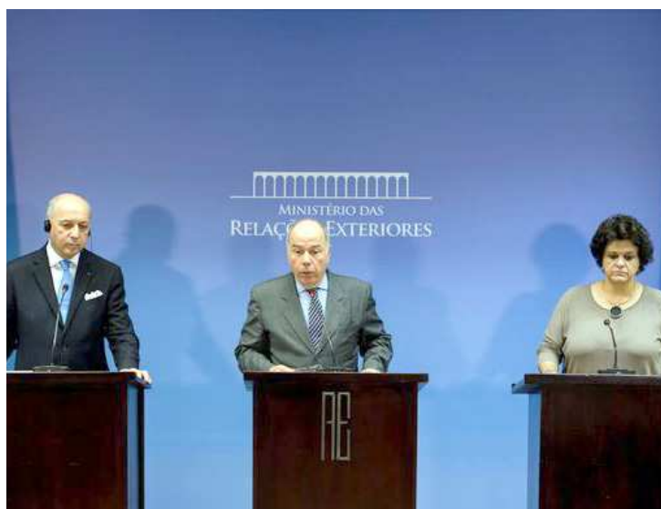
O anúncio do ministro da França foi feito em uma coletiva de imprensa

Para o ministro das Relações Exteriores, Mauro Vieira, a ajuda é muito bem-vinda. Fabius, visita o Brasil para tratar da 21ª Conferência do Clima das Nações Unidas (COP 21), que reunirá representantes de 195 países, de 30 de novembro a 11 de dezembro, em Paris. Ontem reuniu-se