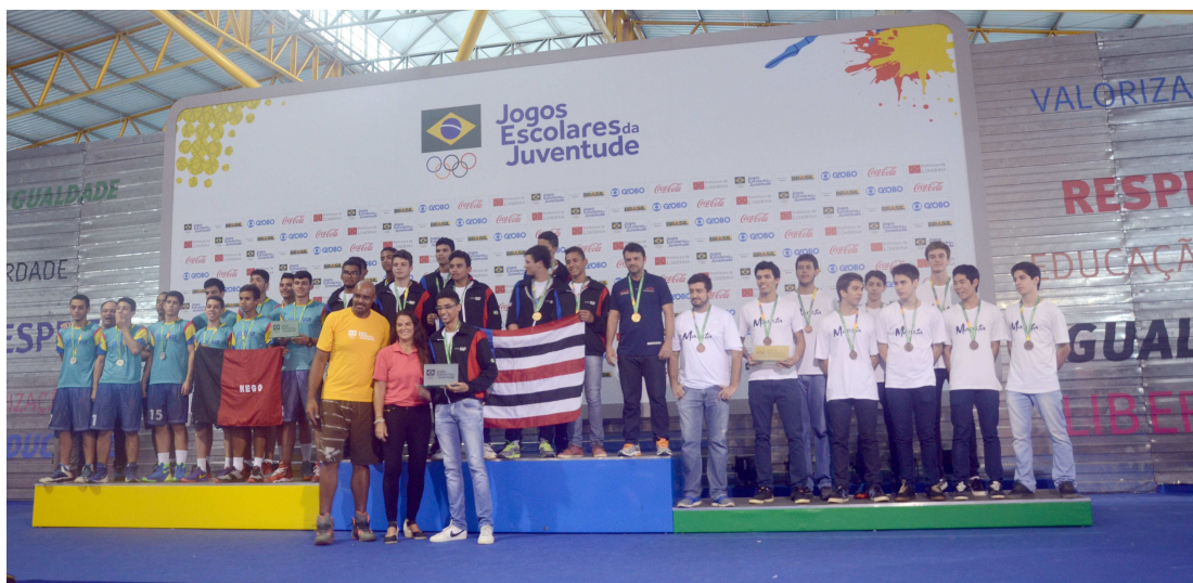
Pelo basquete masculino da terceira divisão, os meninos fizeram uma competição com 100% de aproveitamento

Também na manhã do sábado, as meninas do Colégio Educalls disputaram a final do basquete feminino da segunda divisão com o time de Pernambuco, ficando com a medalha de prata. No handebol feminino, as atletas do Cegel (São