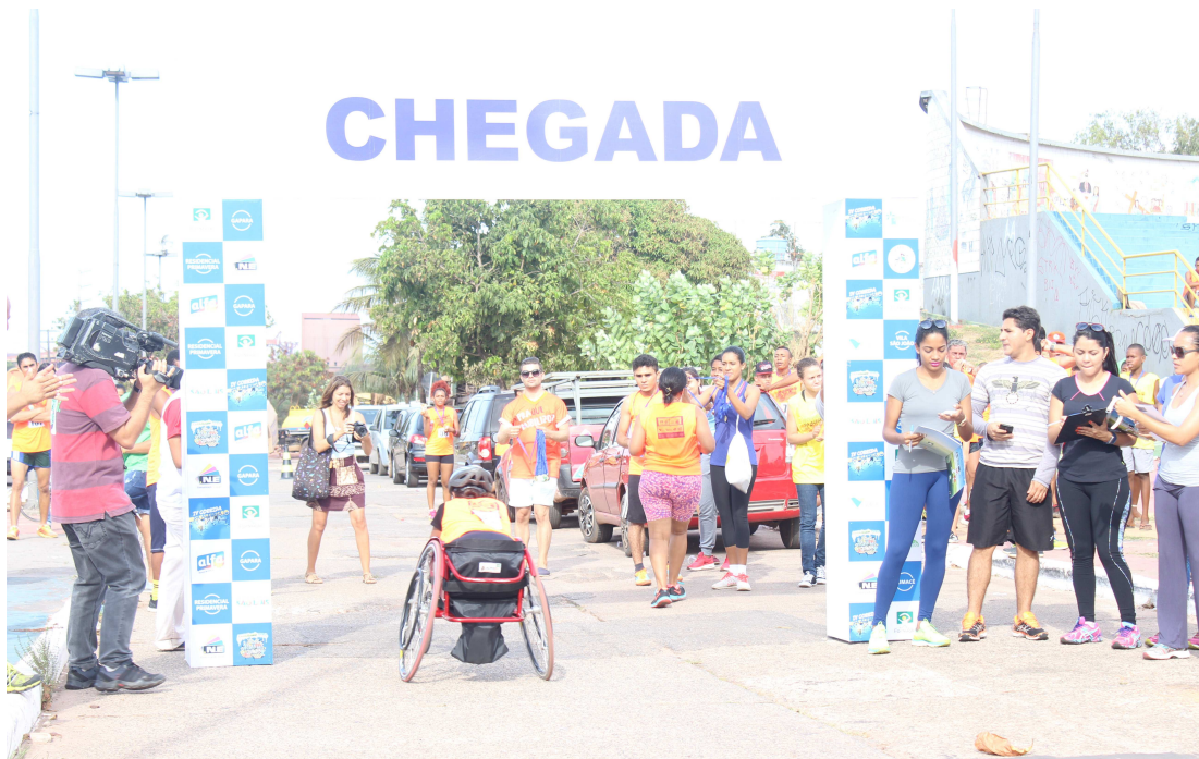
A largada da corrida começou na frente do Terminal de Integração da Praia Grande e a chegada foi no Viva Anjo

A corrida teve duas categorias, modalidade geral masculino/feminino e modalidade especial masculino/feminino. O ven-