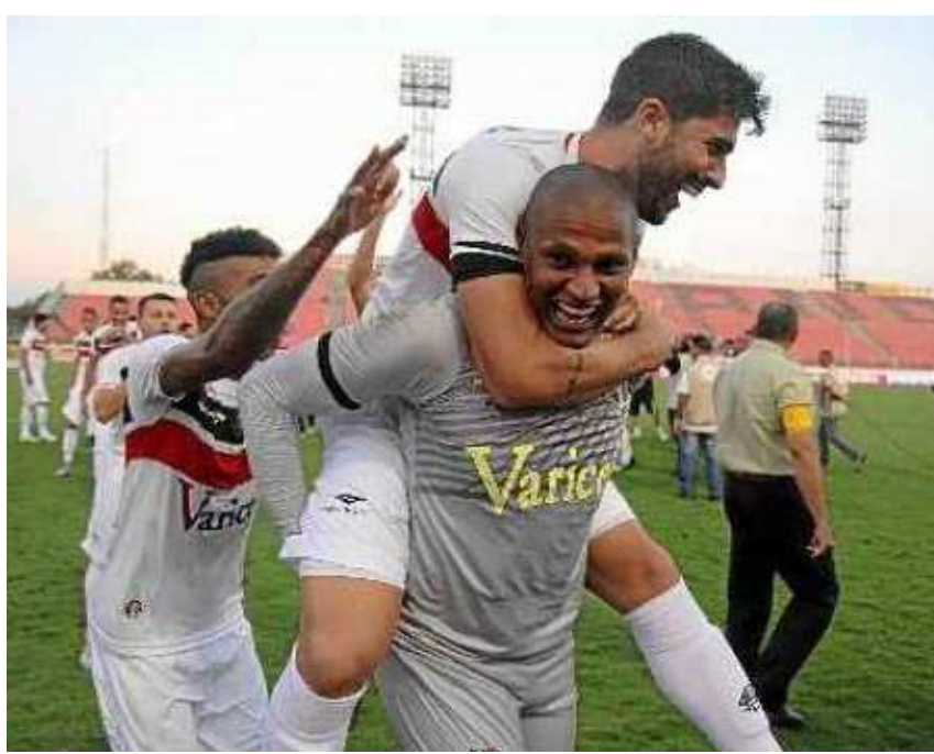
Jogadores do Santa Cruz festejaram muito a subida para a primeira divisão do Brasileiro

Na Arena Fonte Nova, em Salvador, o Vitória venceu o Luverdense-MT por 3 a 0 e garantiu seu retorno à Série A, depois de cair para a Série B no ano passado. Com o resultado, o Leão foi a 66 pontos, chegou à segunda colocação. Com a pontuação, o time