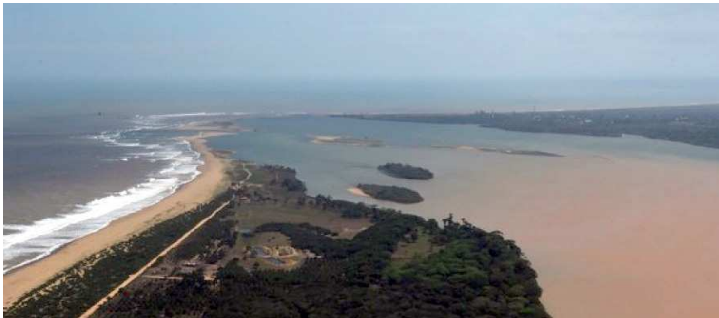
A prefeitura da cidade alerta para que os banhistas e turistas que estão na cidade não entrem nas praias de Regência, Povoação e Pontal do Ipiranga