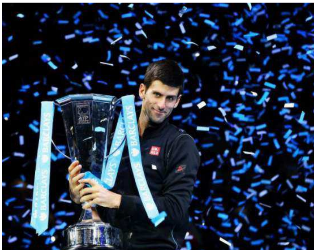
Mais uma vez, o sérvio NovaK Djokovic conquista importante competição internacional de tênis, em Londres

A vitória teve um sabor especial para Djokovic porque ele havia perdido para Federer na primeira fase da competição - por 7/5 e 6/2, na última