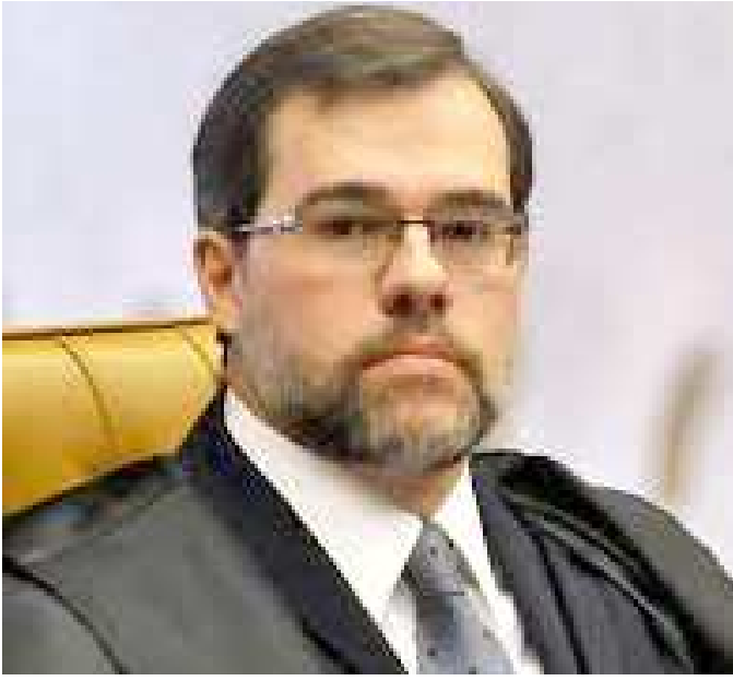
Toffoli está esperançoso que haja exceção para as eleições de 2016