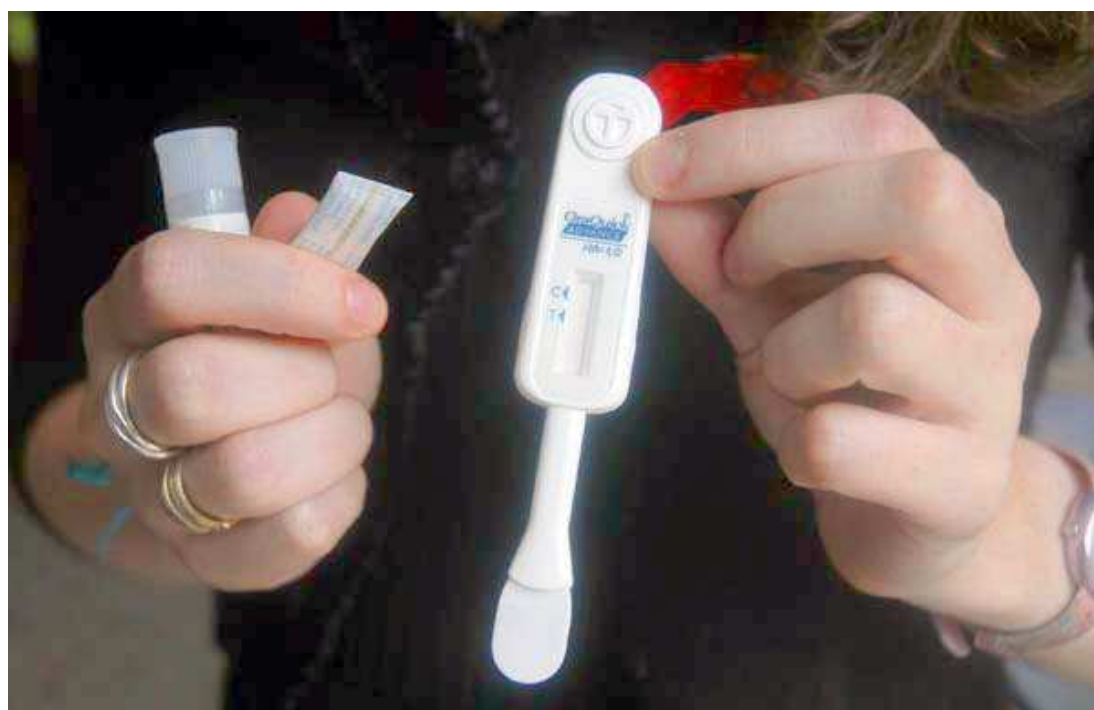
População terá acesso ao serviço que é disponibilizado gratuitamente pelo governo federal os postos de saúde

A Resolução N° 52 da Anvisa determina que os produtos devem trazer informações claras sobre o uso eficaz e seguro e para a correta interpretação dos dados, incluindo ilustrações. Prevê também que os produtores devem colocar à disposição dos usuários um telefone de suporte 24 por dia durante toda a semana, além de ter na embalagem a indicação do Disque Saúde (136), do Ministério da Saúde. De acordo com