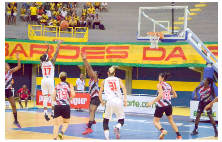
Lance do jogo entre Sampaio Basquete e Maranhão, no Castelinho