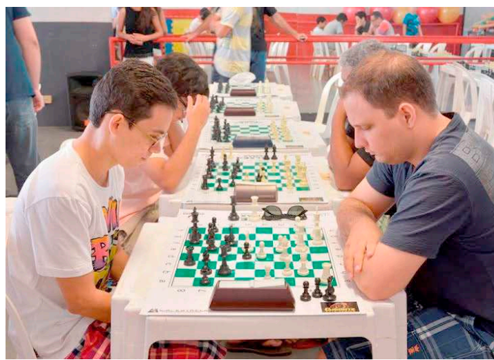
Torneio de xadrez foi uma das modalidades disputadas no Sesi em 2015

No ginásio da Associação Atlética Banco do Brasil (AABB), a rodada foi iniciada com o confronto entre o time feminino da casa enfrentando a Universidade Infantil Rivanda Berenice (UIRB). A partida terminou com vitória da AABB por 2 sets a 0, com parciais de 25 x 14 e 25 x 19. Pelo torneio masculino, a Semdel enfrentou Aerca e aproveitou melhor as oportunidades, vencendo a partida por 2 sets a 0, com parciais de 25 x 21 e 27 x 25.