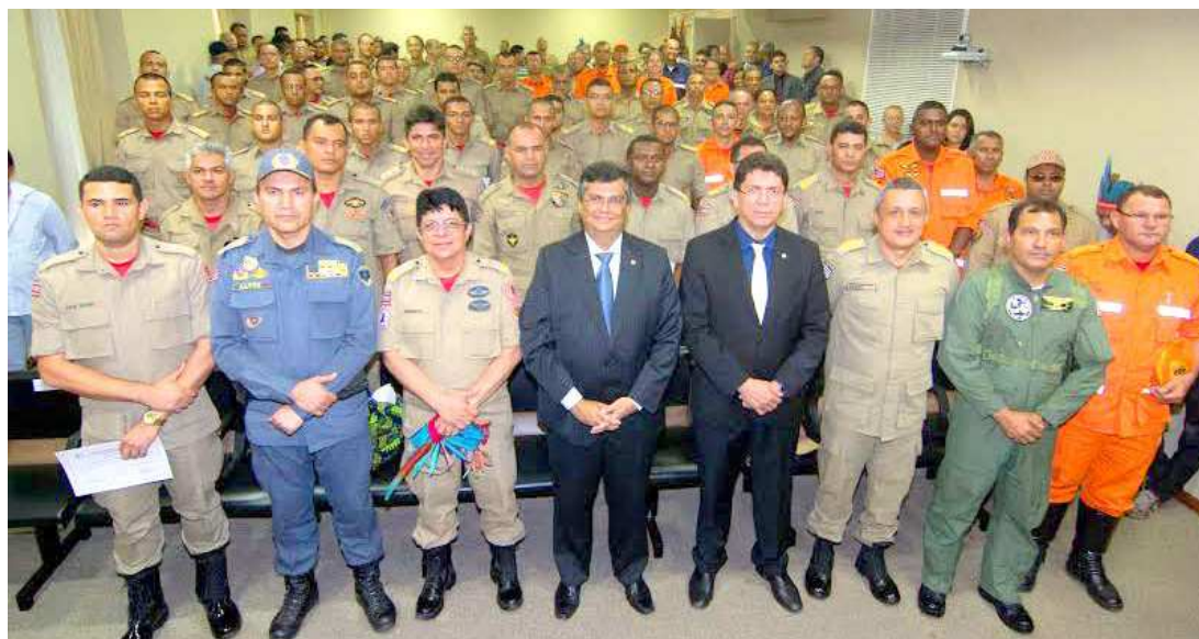
Governador Flávio Dino e o secretário de Segurança Pública, Jefferson Portela, prestaram homenagens à tropa

“Ficamos felizes em saber que o nosso esforço para combater a tragédia em Arariboia tem o reconhecimento dos povos indígenas. Esse é um processo de responsabilidade do governo federal, mas que contou com todo o nosso suporte, com a presença do Corpo de Bombeiros e dos equipamentos