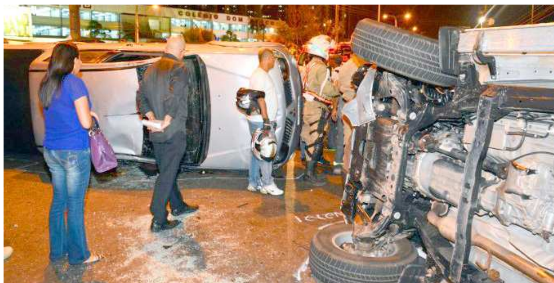
Testemunhas contaram que a motorista saiu em alta velocidade do estacionamento e atropelou um pedestre