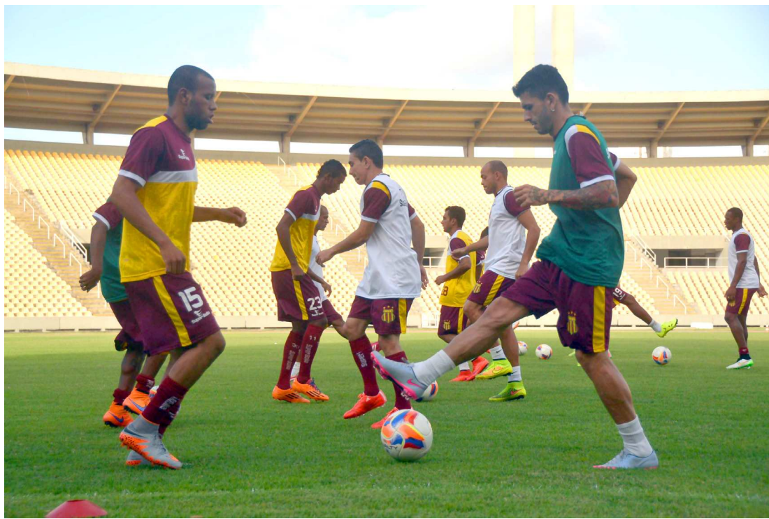
Castelão foi palco dos treinos na Série B do Brasileiro. Lá estiveram 37 jogadores orientados por Condé

O meia Válber foi o jogador mais utilizado por Condé com 35