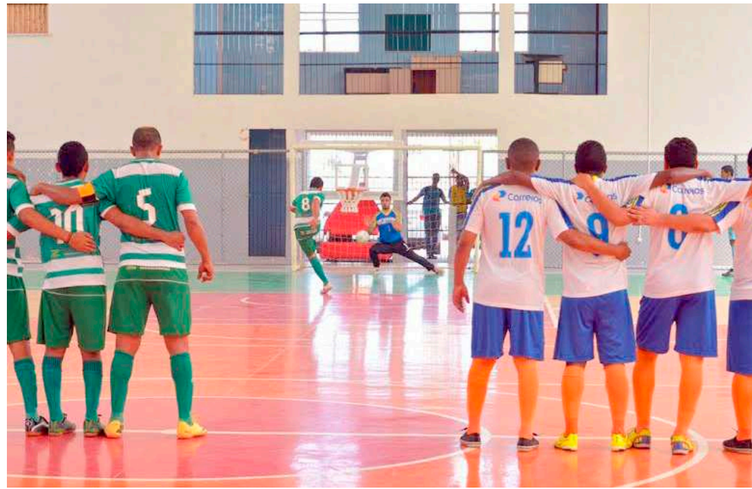
Final do futsal foi bastante equilibrada e teve de ser decidida nas cobranças de chutes da marca penal