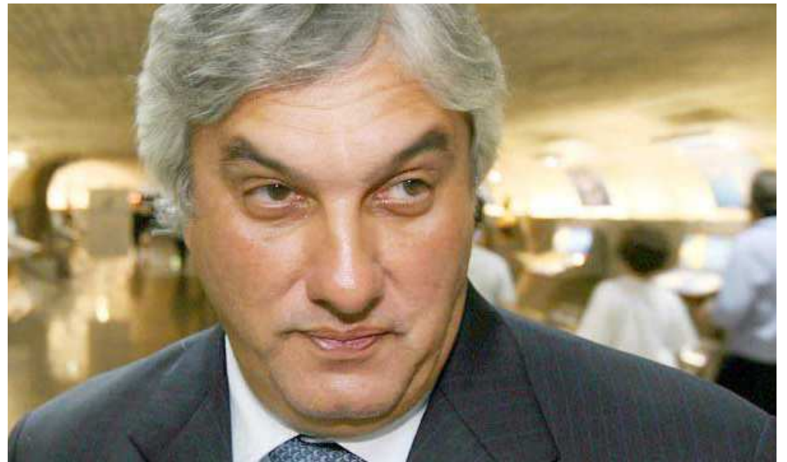
Caso o conselho decida pela abertura do processo de cassação, Delcídio terá novo prazo para apresentar defesa

Se a opção for o prosseguimento da representação, será aberto prazo de dez dias úteis para