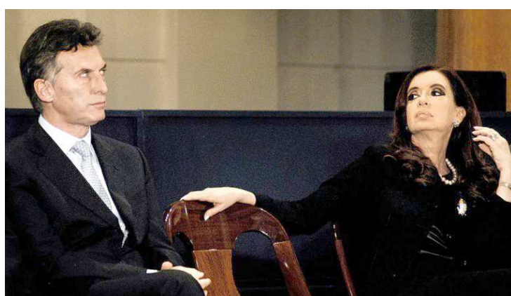
Macri quer receber a faixa na Casa Rosada, mas Kirchner não quer entregar

cerimônia ocorra no Congresso. Foi assim na posse do marido dela, Néstor Kirchner, em 2003 – primeiro presidente eleito pelo voto popular, depois de sucessivos governos interinos, escolhidos pelo Congresso para fazer a transição. Ela sucedeu o marido em 2007 e foi reeleita em 2011, um ano após a morte dele. Nas duas ocasiões, Cristina tampouco fez cerimônia de posse na Casa Rosada.