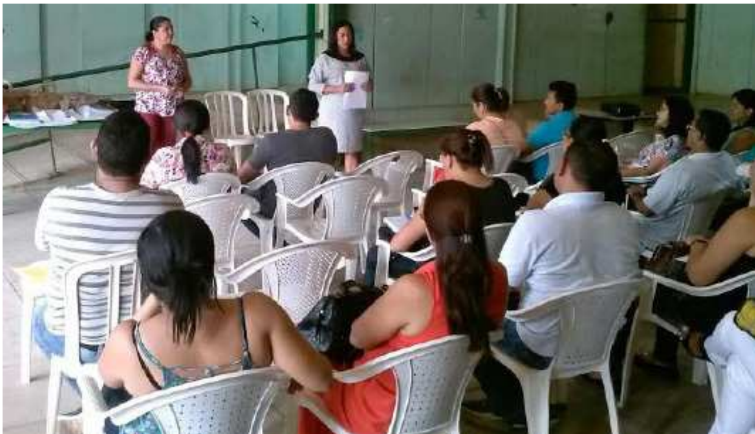
Profissionais da área de educação estadual participaram de capacitação para tirar eventuais dúvidas do processo para a escolha dos gestores

A preparação para o dia de eleição contou com curso de capacitação para os gestores das escolas, eleições simuladas e reunião com estudantes. Em