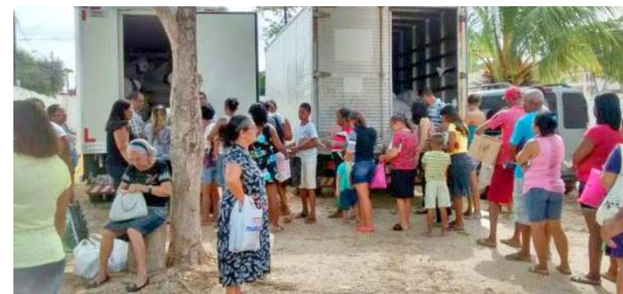
Mais de duas mil pessoas da Cidade Operária foram beneficiadas