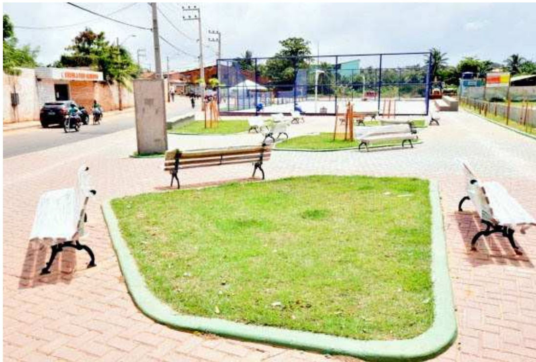
População será beneficiada com praças dotadas de playground, academia aberta, entre outros equipamentos