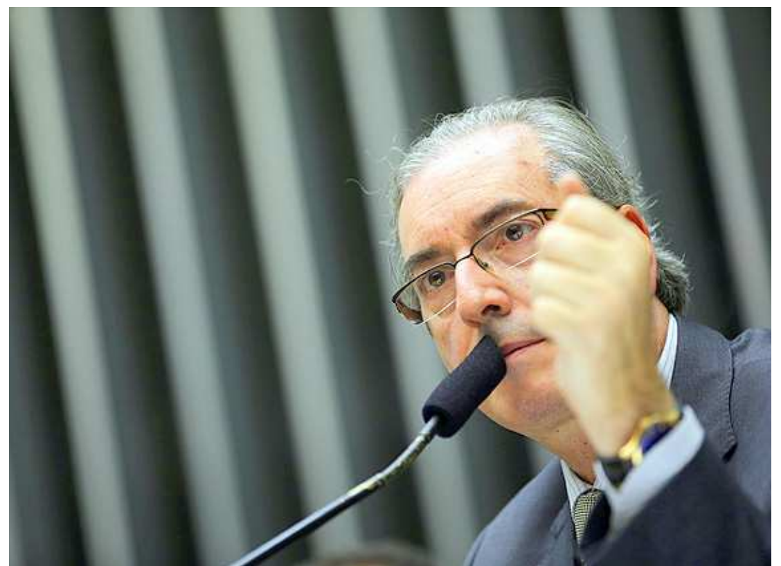
Cunha disse que a votação nas chapas será o primeiro item da pauta e deverá começar por volta das 17h de hoje

“Quem conhece o presidente Michel Temer e me conhece sabe que conspiração não cabe no nosso vocabulário. Ele é um homem que é um democrata vocacionado à observância da Constituição e da Lei. Então, ninguém espere de Michel e de mim golpe. Nós não seremos parceiros de golpe nenhum, nunca”, afirmou Padilha durante entrevista