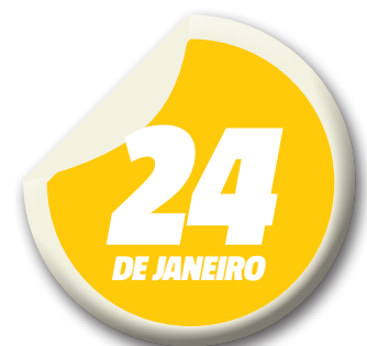
Data da estreia do Imperatriz no Campeonato Maranhense