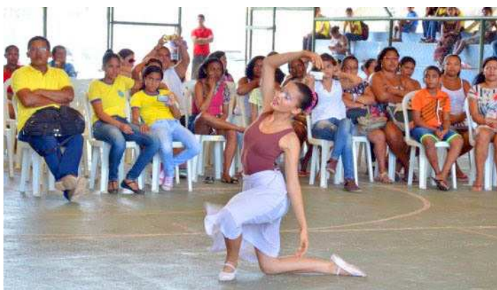
Estudantes da rede municipal realizaram ações de conscientização

A partir do diagnóstico, feito com informações coletadas pelos próprios estudantes, é realizada uma construção coletiva de alternativas para prevenção e enfrentamento à violência. Durante quatro meses, os estudantes das Unidades