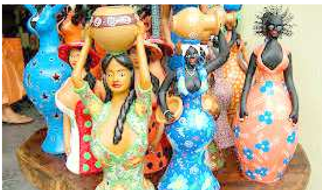
Produção artesanal maranhense será o tema do seminário que contará com artesãos de todo o estado

Com o tema Entrelaçando Saberes e Moldando o Futuro , o seminário vai reunir artesãos de todo o Maranhão e