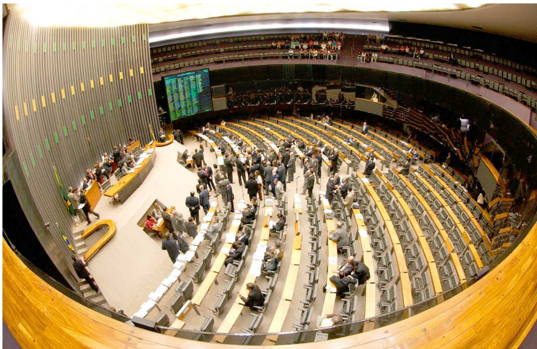
Os partidos com representação na Câmara Federal têm até hoje, às 14h, para indicar os nomes para a comissão

Hildo Rocha (PMDB) e Sarney Filho (PV) foram os indicados por seus respectivos partidos para compor comissão do processo de impeachment