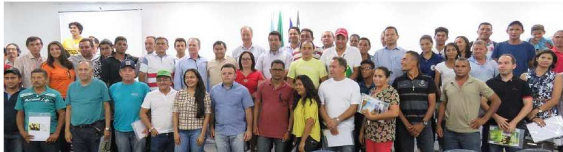
Criadores de ovinos e caprinos dos municípios visitados pelo Fida participaram do encontro com o governador

Para dar apoio à criação de caprinos e ovinos no Maranhão, o governo do estado, por meio do Sistema de Agricultura Familiar (Agência Estadual de Pesquisa Agropecuária e de Extensão Rural do Maranhão - Agerp, Instituto de Colonização e Terras do Maranhão - Iterma e Secretaria de Estado da Agricultura Familiar - SAF), reuniu-se nos municípios de Chapadinha e Vargem Grande, nos últimos dias 4 e 5, com representantes de instituições internacionais, instituições financeiras, academia, Poder Executivo e Legislativo para buscar soluções para o fortalecimento da cadeia de ovinocaprinocultura no Estado. A visita ao governador Flávio Dino na manhã de ontem marcou o encerramento desta primeira etapa da missão