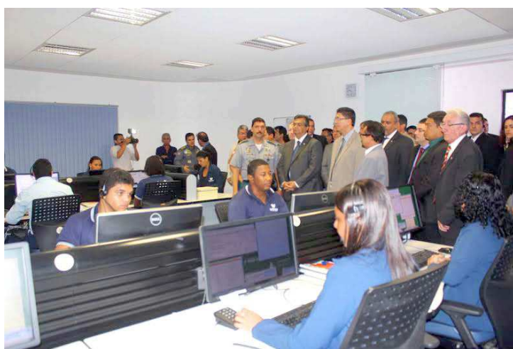
Softwares avançados serão usados para fazer o cruzamento de dados

O espaço está equipado com computadores de alta performance