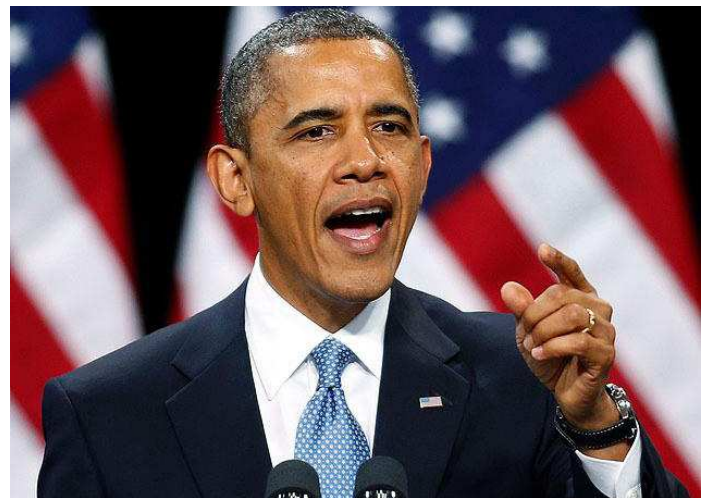
Obama fez o pronunciamento na TV, em rede nacional, nos EUA