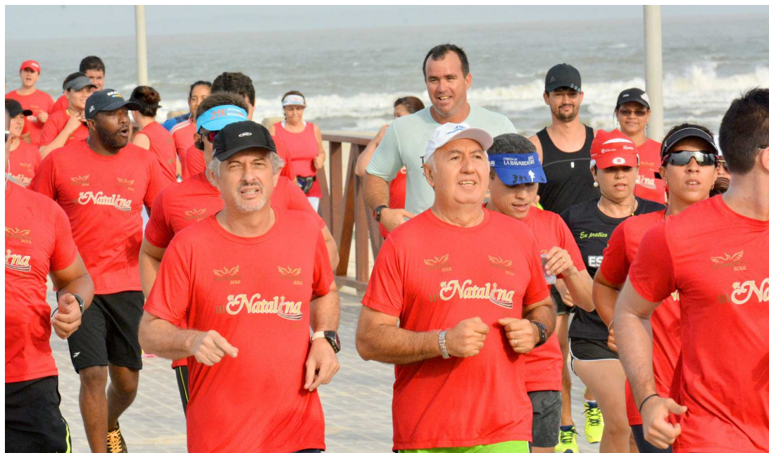
Atletas de todas as idades participam da corrida na manhã da véspera do Natal, na Avenida Litorânea

Os inscritos irão receber um kit para participar do evento no dia 24 de dezembro. A distribuição das camisas está marcada para o dia 22.