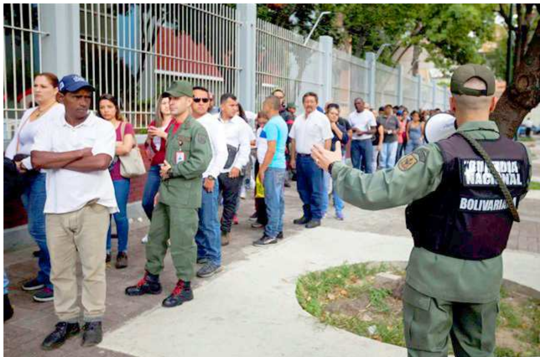
A oposição venezuelana conquistou 99 assentos de um total de 167 que compõem a Assembleia Nacional

Além do resultado na Venezuela, Caldas cita a vitória de Mauricio Macri, novo presidente da Argentina, eleito há pouco mais de 15 dias. O professor lembra que no modelo neopopulista não há abandono total das políticas econômicas, mas a preocupação com orçamen-