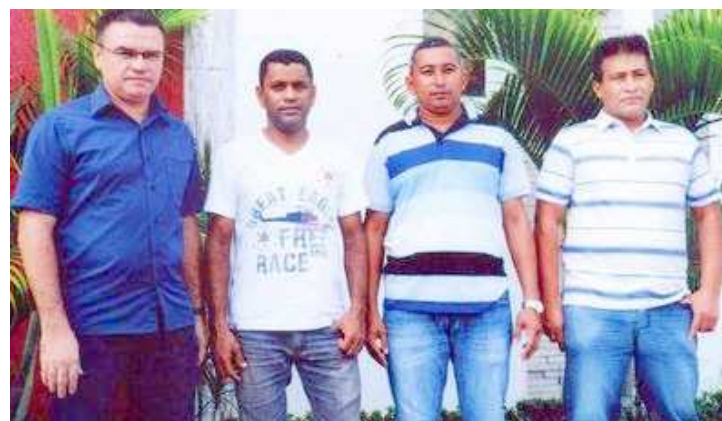
Dirigentes acreditam em votação em massa na Liga de Imperatriz