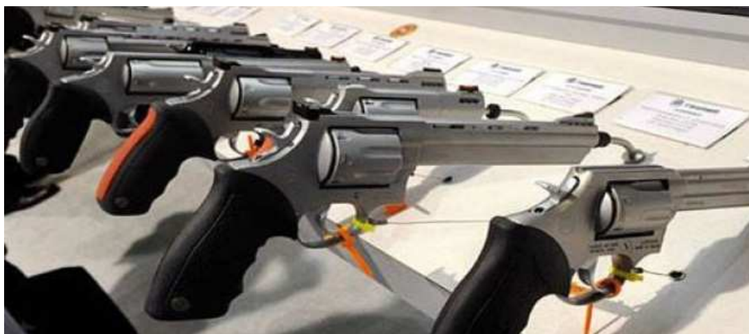
No Brasil, 6,8 milhões de armas estão registradas, segundo o levantamento realizado pelo Mapa da Violência 2015

Segundo o Mapa da Violência 2015, do total de armas no Brasil, 6,8 milhões estão registradas