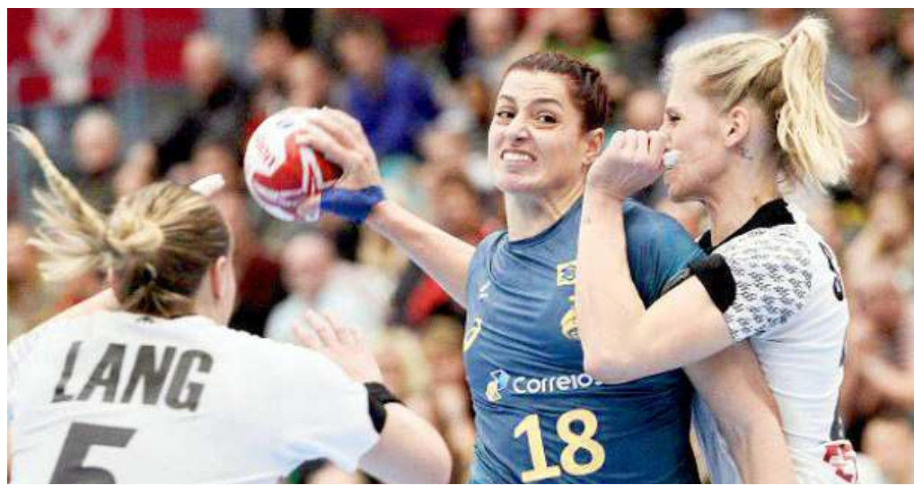
Brasil vence Alemanha em duelo dramático pelo Mundial de Handebol Feminino