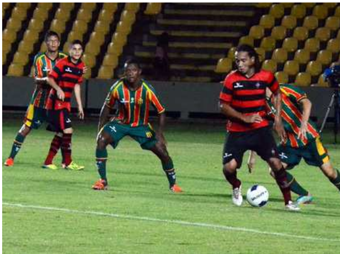
Mesmo parado em todo segundo semestre de 2015, Moto Club sobe 31 posições no ranking da CBF

Vale ressaltar que caso o Maranhão ultrapasse o Mato Grosso, décimo quarto colocado, no fim de 2016, o estado terá direito a um terceiro representante na Copa do Brasil de 2017, pelos critérios atuais da competição.