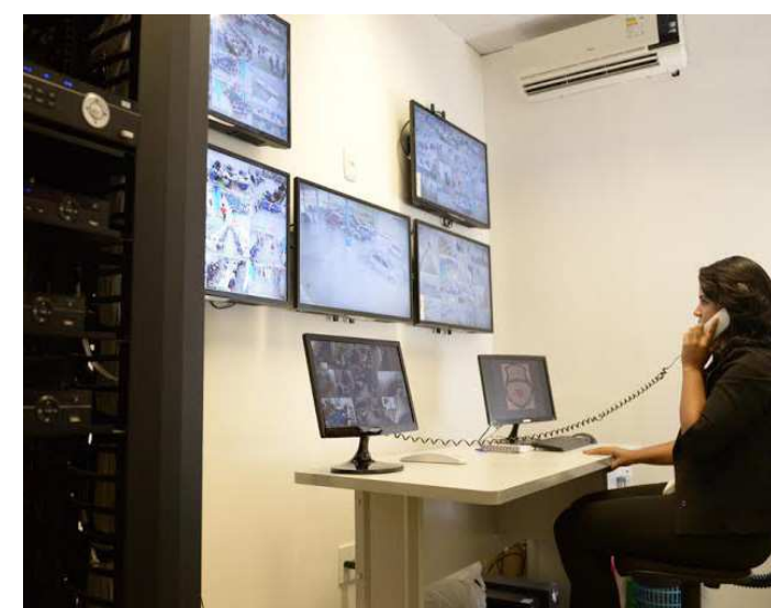
Candidatos podem solicitar imagens capturadas durante os exames

A área de provas práticas, anexa ao prédio-sede do Detran-MA, na Vila Palmeira, passou a ser monitorada 24 horas por oito câmeras, sendo cinco de resolução 1.280 x 720 pixels em HD, que facilitam um foco com melhor visibilidade.