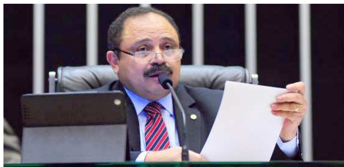
Waldir Maranhão (PP-MA) que determinou a substituição do relator do processo contra o Eduardo Cunha

O líder do Psol, deputado Chico Alencar (RJ), elogiou o trabalho do deputado Fausto Pinato. “É importante saber o inteiro teor da decisão e quem participou