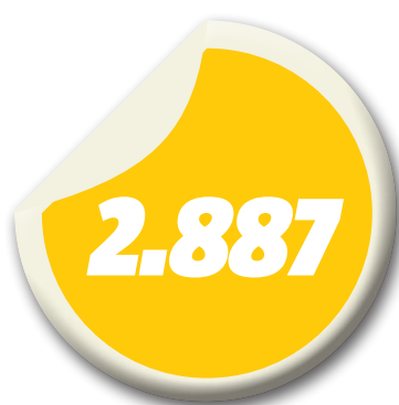
número extra oficial de zika vírus no Maranhão em 2015

ser assistida por um pediatra e por uma equipe de multiprofissionais, tais como fisioterapeuta, terapeuta ocupacional