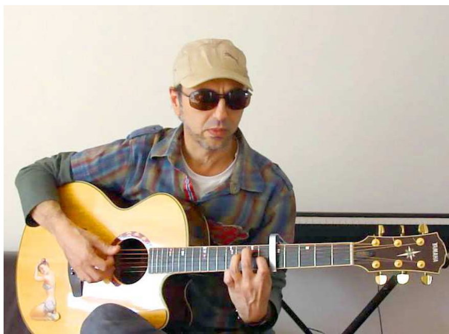
Músico fará releituras de autores como Martinho da Vila, Sergio Sampaio e Luiz Ayrão

Além do show de Zeca Baleiro, a música continua no clima super positivo da discotecagem roots de Neto