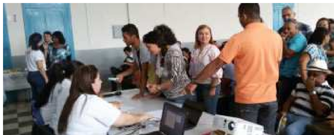
Gestores passaram por eleição simulada para que gestão escolar seja democrática e transparente no processo

“Estamos vivenciando um momento importante na educação do Maranhão. O governador Flávio Dino compreende que a gestão escolar democrática é aquela que rompe com as práticas individualistas e leva a produzir melhores resultados de aprendizagem dos es-