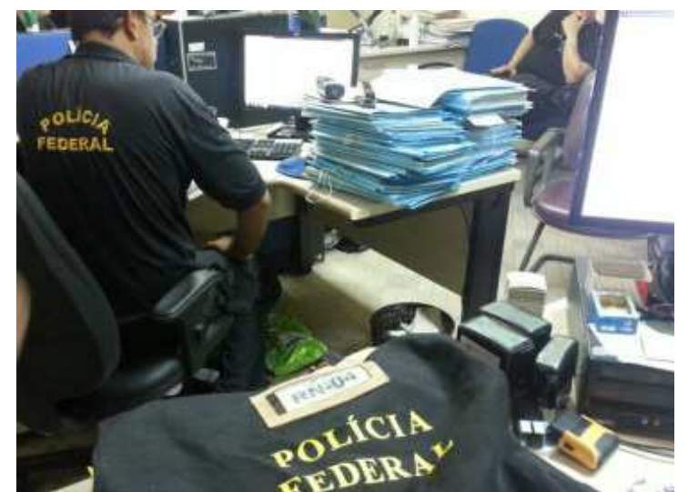
PF investiga conexão entre filho de Lula e ex-ministro com fraudadores

Já o ex-ministro Gilberto Carvalho é apontado como parte de um suposto “conluio” com suspeitos de pagar propinas em troca de benefícios fiscais. Documentos obtidos pela PF indicam relação de Carvalho com duas empresas. Ao G1, em outubro, o ex-ministro negou ter obtido qualquer benefício no cargo. Pelo menos cinco empresas e mais uma pessoa ligada a uma delas tiveram a quebra de sigilos autorizada.