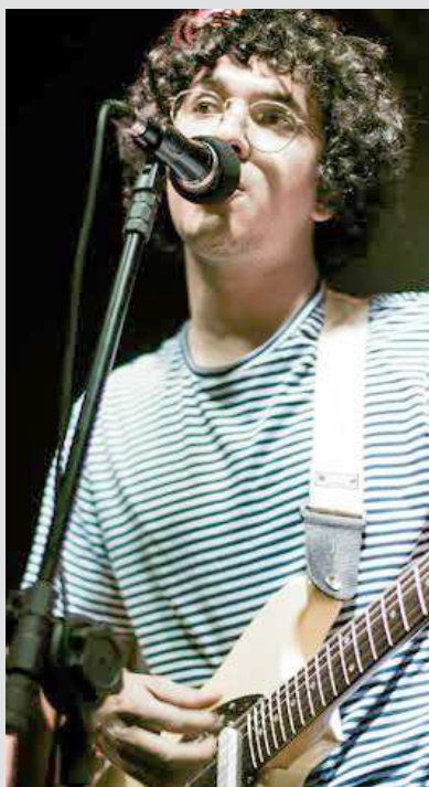
linda manifestação cultural. Um festival de verdade! O Reviver (Praia Grande) em festa é uma coisa muito emocionante e eu amo aquele lugar.

Muito Pouco , A Casa é Sua , entre outros.