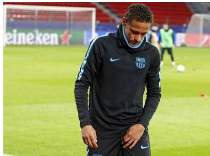
Neymar pode ficar fora da semifinal do Mundial de Clubes