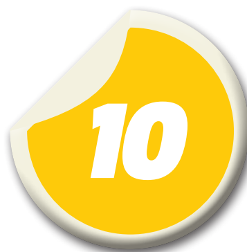
jogadores contratados pelo Moto Club

Apesar de ter recebido propostas de outros times, o zagueiro acabou optando por permanecer no Quadricolor e trabalhar novamente com o técnico Meinha no Estadual.