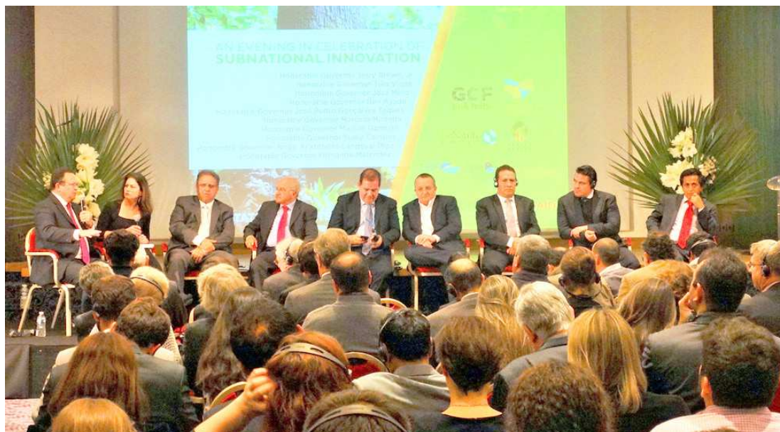
O vice-governador Carlos Brandão chegou em Paris no último dia 5 e cumpre extensa agenda até o dia 12

“Foi um longo caminho que decidimos trilhar, na certeza de que a partir de 2016 poderemos debater igualmente com os estados e as nações os