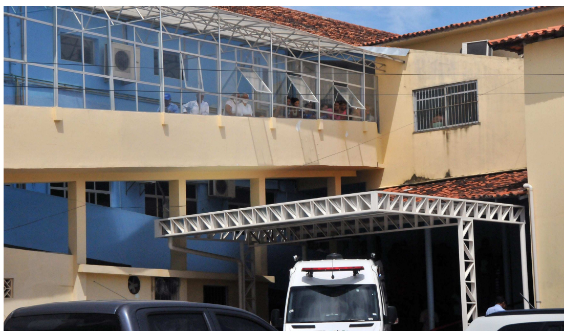
Hospital Dr. Juvêncio Mattos será uma das unidades de referência para tratamento de casos de microcefalia