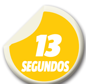
Tempo que McGregor levou para vencer José Aldo

pletamente Ronda Rousey, em novembro de 2015, e definiu o duelo com um plástico e impiedoso chute alto de esquerda, que derrubou a faixa preta de judô.