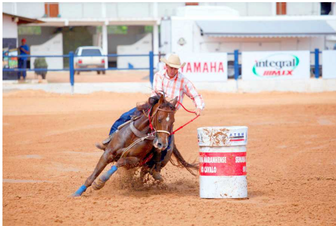
O Mundialito de Tambor e Baliza terá três eventos em São Luís, com competidores de seis países

O Maranhão, mais precisamente São Luís, foi escolhido para sediar o Mundialito, que é efetivamente um torneio mundial de tambor, esporte equestre em que o Estado é uma das três maiores forças do Brasil. O evento contará com a participação de seis países, além dos integrantes da equipe brasileira. O Mundialito de Tambor será