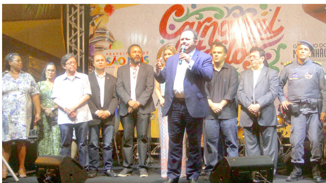
Governador em exercício Carlos Brandão e o secretário de Cultura, Botão, no lançamento do 'Carnaval de Todos'

O governador em exercício, Carlos Brandão, disse que a ideia é trazer de volta brincadeiras esquecidas e reerguer a cultura popular carnavalesca, levando também uma estrutura para que os municípios mantenham a tradição. "A ideia é resgatar o Carnaval popular de rua em períodos matutinos e vespertinos e proporcionar ao público entretenimento de qualidade durante as festas de carnaval, e, aos artistas