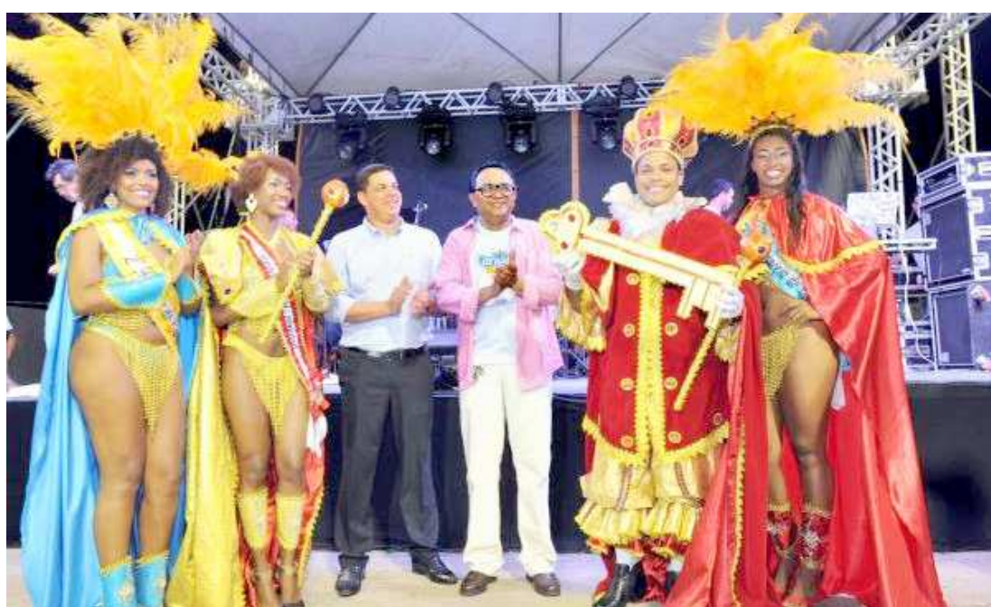
Rei Momo, rainha e princesas serão anunciados ao som eletrizante das baterias de escolas de samba

Os candidatos interessados em participar do concurso deverão entregar a ficha de inscrição preenchida e cópias dos documentos dispostos no edital na nova sede da Secult - rua do Mocambo, 253, Centro, São Luís -, no prazo de 8 a 15 de janeiro, no horário de atendimento, de segunda à quinta, de 14h às 18h, e na sexta-feira, de 9h às 13h. Após a análise documental realizada pela Comissão de Avaliação Técnica, os candidatos serão