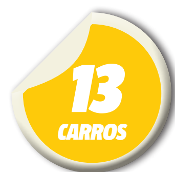
foram alvos dos bandidos na última semana

Contudo, nem sempre os motoristas têm a mesma sorte. Só nesta semana, 13 veículos foram roubados na Grande São Luís. O maior número de casos foi registrado na Delegacia Especializada da Cidade Operária (Decop). Nos registros, não são somente carros os alvos dos criminosos. Na noite