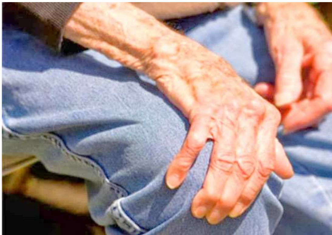
Em São Luís ainda é baixo, os registros de crimes de estelionato contra idosos na Delegacia de Defraudações

“Nestes casos, indicamos o acusado e aplicamos o Artigo 102 do Estatuto do Idoso e encami-