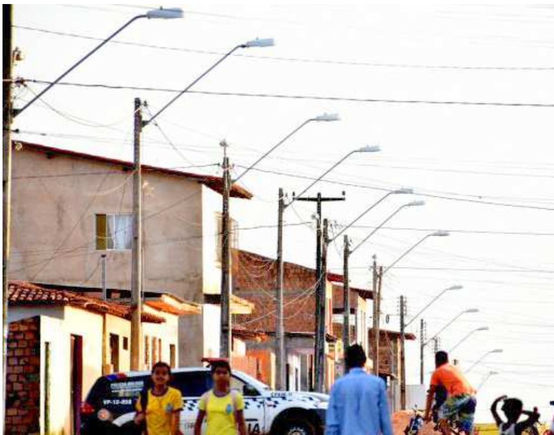
No São Raimundo, vias receberam iluminação que ajudará na segurança e qualidade de vida dos moradores

Além de Rio Grande e São Raimundo, a Prefeitura de São