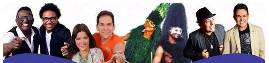
As atrações ficam por conta de Vamu di Samba, Kizoieira, Argumento, Bicho Terra e muita música eletrônica

Na Casa das Dunas, a festa não para. As atrações ficam por conta de Vamu di Samba, Kizoieira, Argumento e Bicho Terra. As músicas eletrônicas ficam