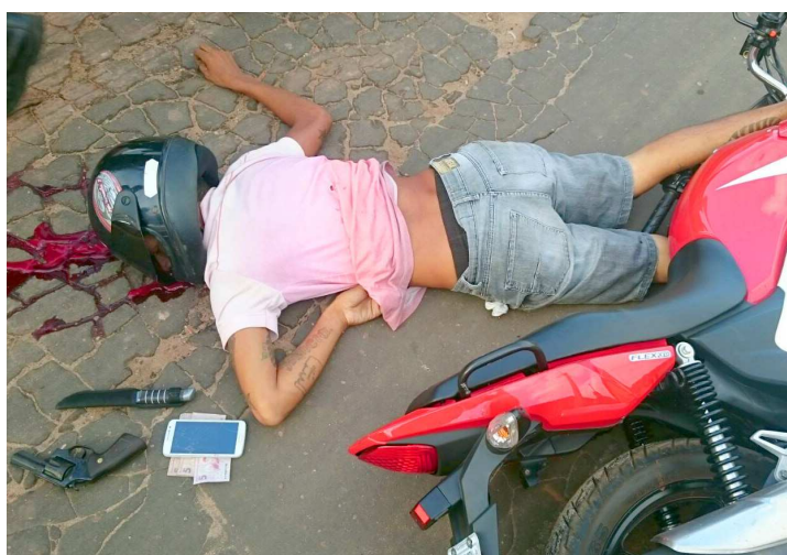
Suspeito sacou arma e atirou nos PMs, que revidaram, atingindo o homem

O segundo suspeito parou a moto em que estava, uma CG 150 vermelha, de placa OXV 9029 (produto de assalto), sacou o revólver que carregava e trocou tiros com os policiais. Ele foi atingido por dois disparos e veio a óbito no local. Nenhum dos dois indivíduos foi identificado até agora. Com o assaltante que foi a óbito estavam uma faca, R$ 15, um celular Samsung branco, um revólver calibre 38, de numeração F121303, com uma munição intacta e outra deflagrada.