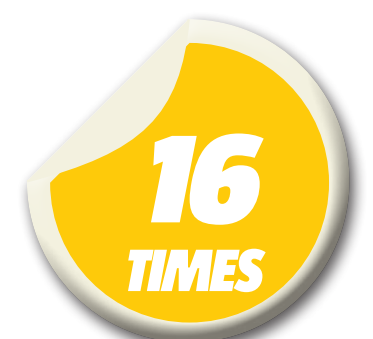
Número de participantes da chave mundial da Copa Davis

David Haggerty, presidente da ITF, disse que o formato de jogos "em casa e fora" funciona para as fases iniciais, mas quer ver semifinal e final sendo realizadas em apenas uma semana em local neutro. "Nós seríamos capazes de planejar com antecedência onde seria,