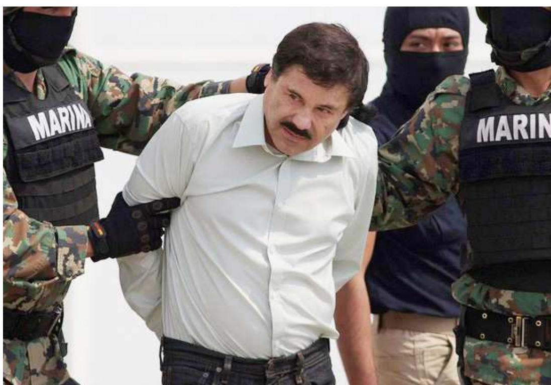
O anúncio da captura de ‘El Chapo’, chefe do Cartel de Sinaloa, foi feito pelo presidente do México

A detenção aconteceu num motel localizado nos arredores da cidade de Los Mochis, no noroeste do México, onde tinha se refugiado para escapar de uma