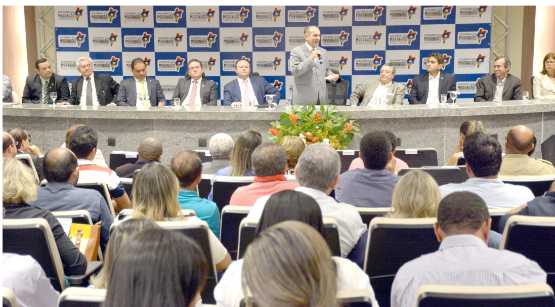
A meta do Ministério é reduzir o índice de infestação por Aedes aegypti para menos que 1% nos municípios

O ministro da Saúde, Marcelo Costa, ressaltou que todos os gestores públicos e a população precisam unir esforços e as ferramentas necessárias para combater e destruir os criadouros do mosquito. "Só tem uma maneira de combater o mosquito, não deixando ele nascer. E isso se