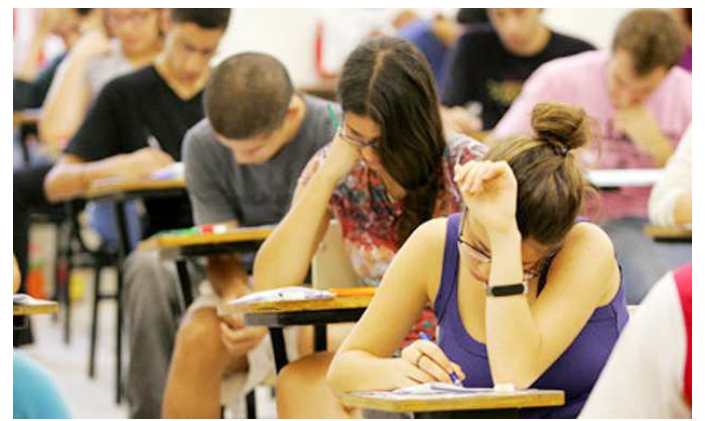
O exame serve para os candidatos ingressarem em universidades