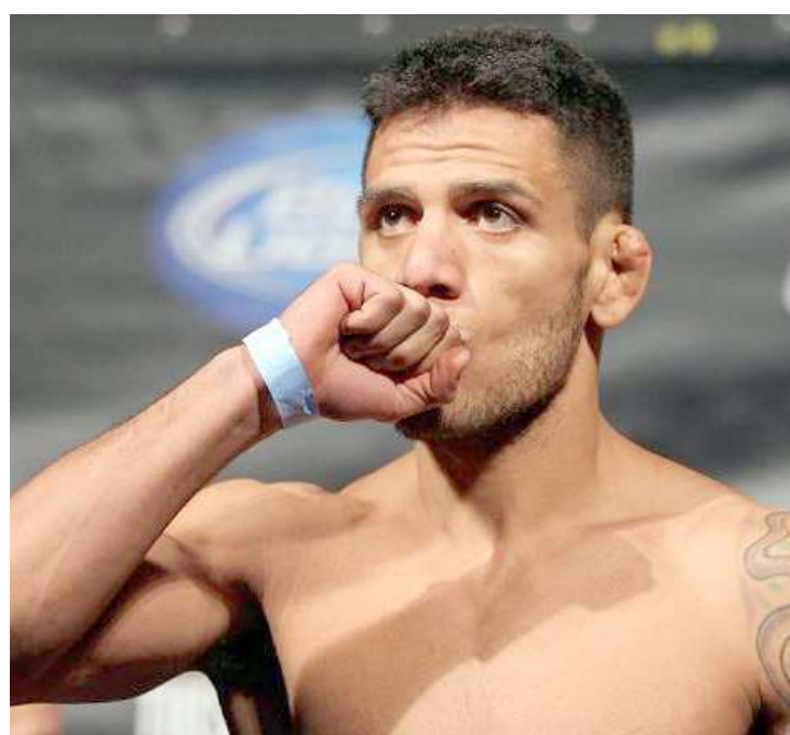
Brasileiro Rafael dos Anjos defende cinturão dos leves no UFC 197