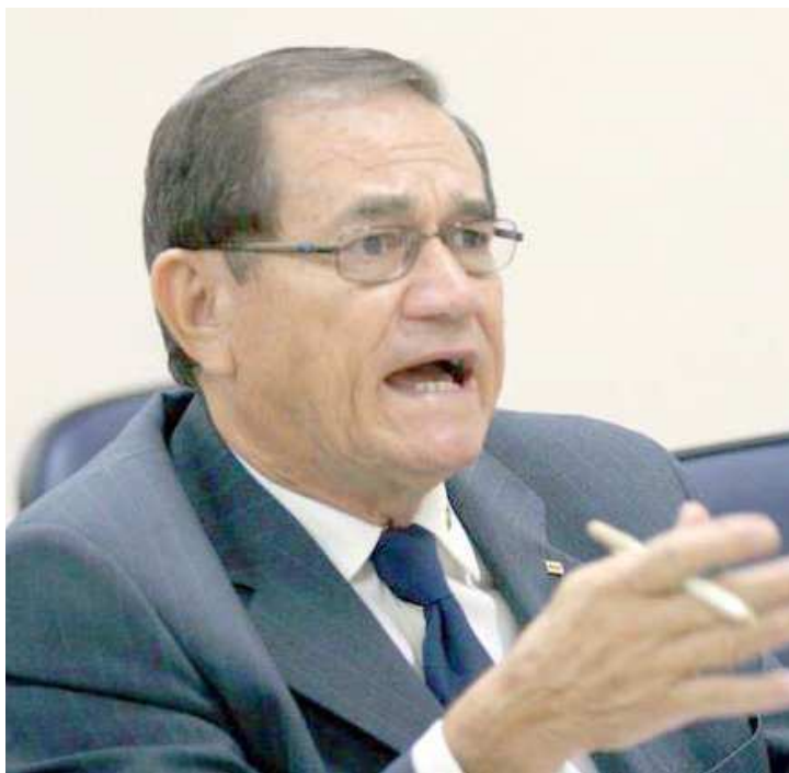
Coronel Nunes é o atual presidente em exercício da CBF desde o fim de 2015

Preferiu o silêncio ao ser convidado para exercer um cargo similar ao de diretor de seleções, com um salário de R$ 50 mil. A CBF já ajuda cada federação com um suporte de 50 mil reais mensais, sem necessidade de prestação de contas. Além disso, cada presidente dessas entidades recebe da confederação uma mesada de R$ 15 mil.