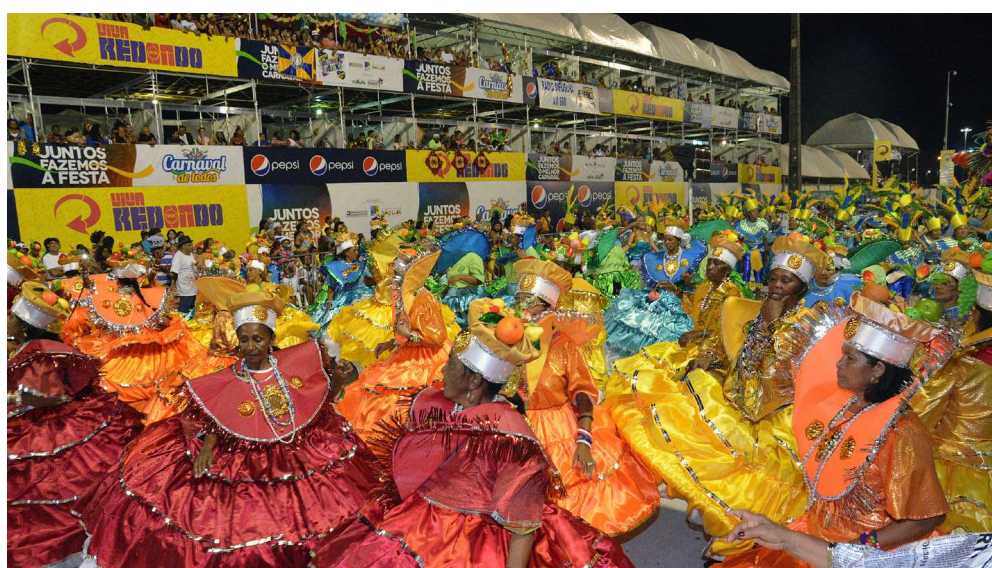
Ensaios abertos de Escolas de Samba pela primeira vez incluídos na lista de atrações carnavalescas

Aos domingos, a já tradicional Madre Deus recebe blocos e bandas variadas a partir das 16h.