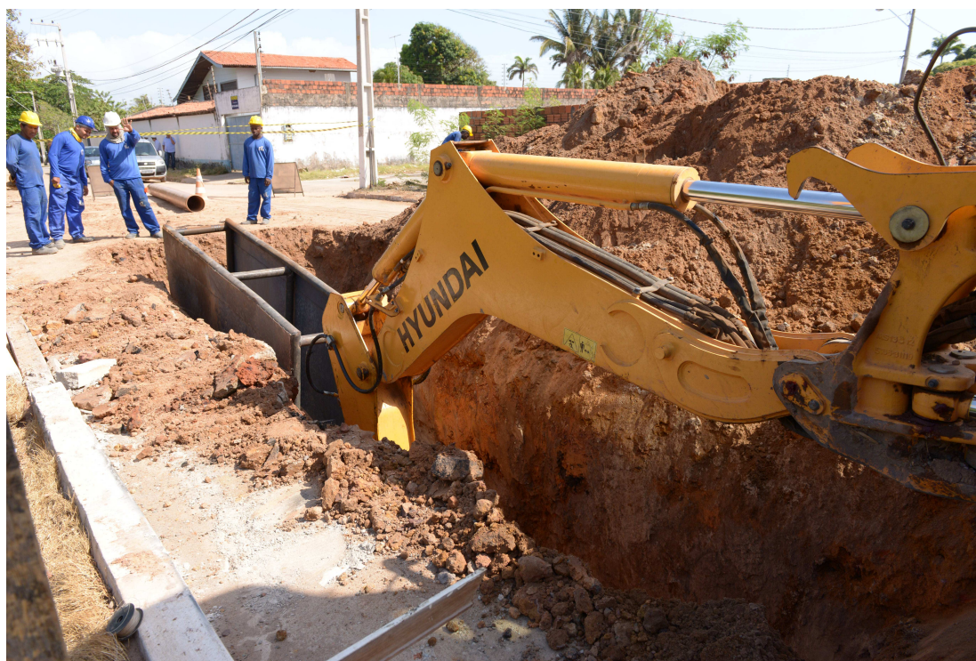
As intervenções fazem parte de um conjunto de ações para melhorar a balneabilidade das praias da capital

Outros dois importantes rios também estão incluídos no “Mais Saneamento”. O Rio Claro já está com obras em andamento, sendo implantadas tubulações às