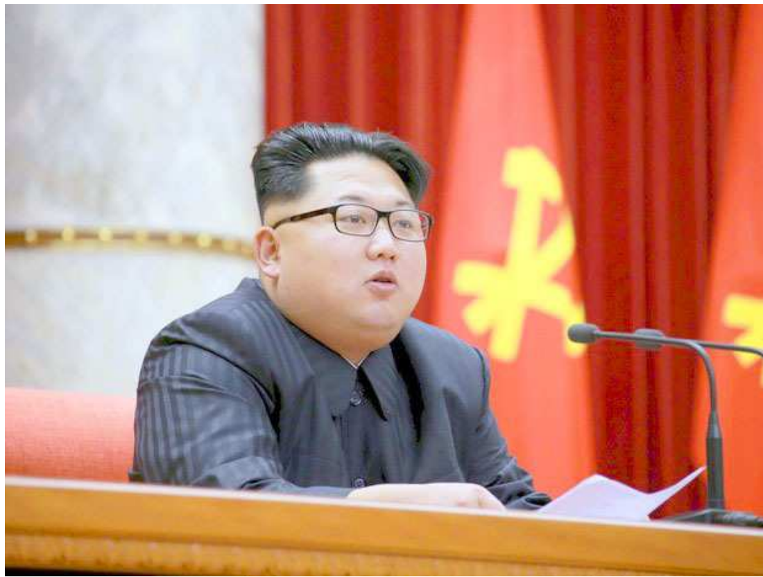
O regime de Pyongyang na Coreia do Norte está sob sanções da ONU sobre seus programas nucleares e de mísseis

As duas Coreias permanecem em estado técnico de guerra uma vez que o conflito de 1950-1953 terminou com uma trégua, e não um tratado de paz. A Coreia do Norte disse em 6 de janeiro que havia testado uma bomba de hidrogênio, o que gerou condenação de seus vizinhos e dos Estados Unidos. Especialistas expressaram dú-