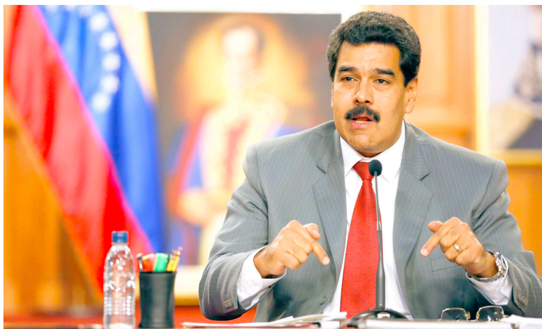
Maduro decretou estado de emergência a fim de que o Executivo atenda à situação econômica da Venezuela