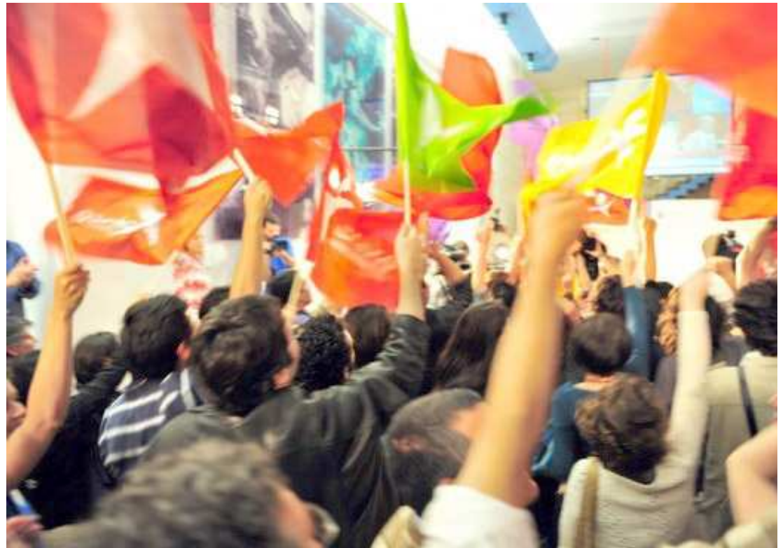
A medida ‘moralizadora’ para as eleições 2016 só foi possível após aprovação pelo Supremo Tribunal Federal