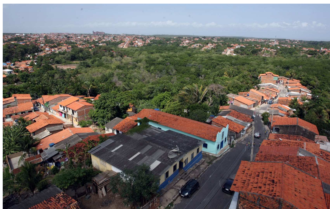
Região agrega as maiores empresas do estado, como a Vale, Porto do Itaqui, distribuidores de gás, entre outros

Ele explica que ainda existe sim muitos problemas na região, como por exemplo o saneamento básico. Todo o esgoto é despejado no Rio Bacanga e na Praia d' Guia. Algumas comunidades precisam de abastecimento de água, pois utilizam poços artesanais.