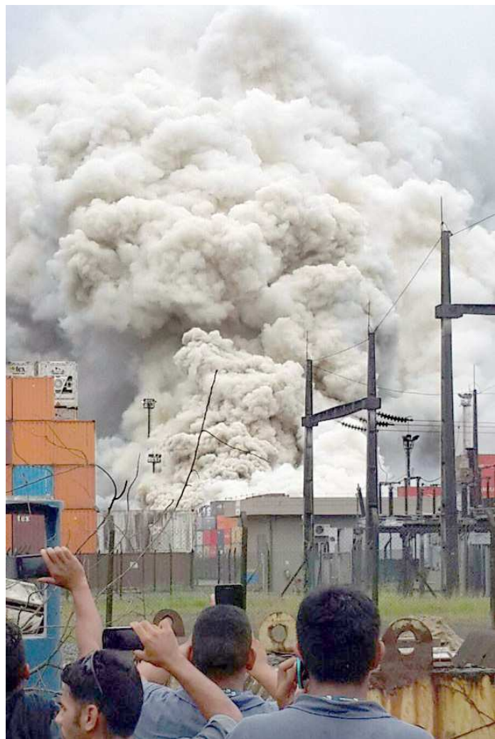
O incêndio começou na última quinta-feira e atingiu 80 contêineres