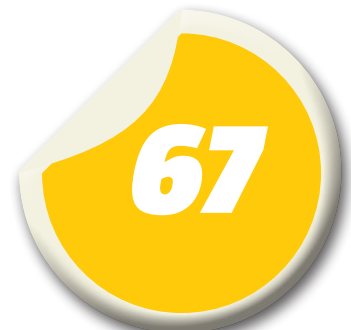
Número de votos de uma possível eleição