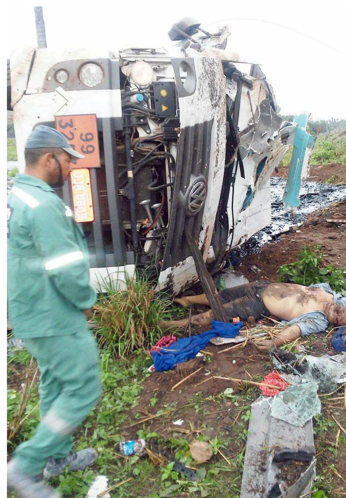
Produto tóxico utilizado na produção de asfalto escoou no acostamento