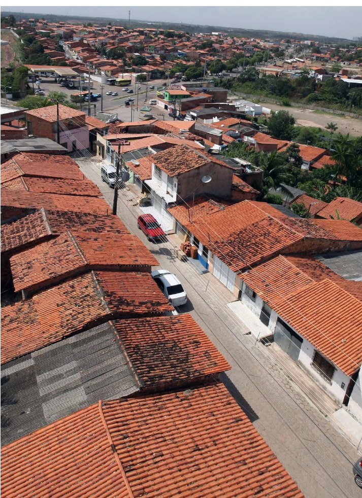
Moradores estão preocupados com saneamento básico da área

Mas a luta voltou a ganhar fôlego há dois anos, depois que o mesmo Congresso aprovou a criação de 138 municípios, onde entraram os bairros do Maiobão (Paço do Lumiar) e Maracanã (São Luís).