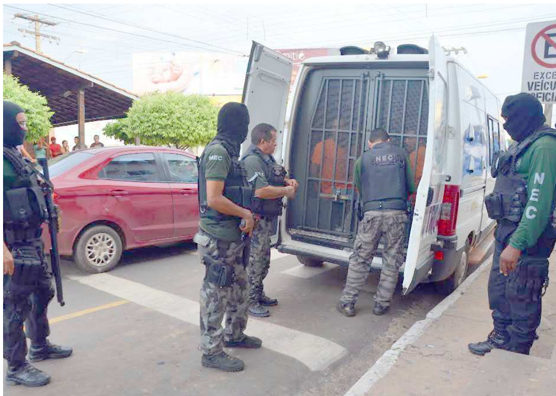
Agentes da supervisão de segurança externa da Sejap escoltam presos para audiências judiciais no Fórum