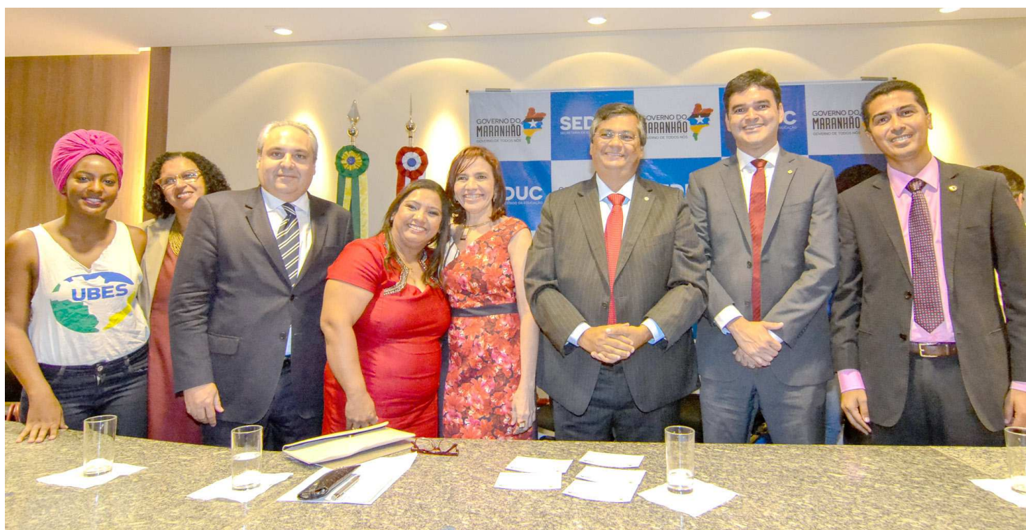
No dia da posse, os gestores selecionados e eleitos assinaram um termo de gestão por uma escola pública de qualidade, com metas a serem executadas

A secretária estadual de Educação, Áurea Prazeres, comemorou o dia como um marco histórico na educação maranhense e afirmou que esta é mais uma ação integrante do conjunto de metas do Executivo Estadual para garantir ensino de qualidade para todos.