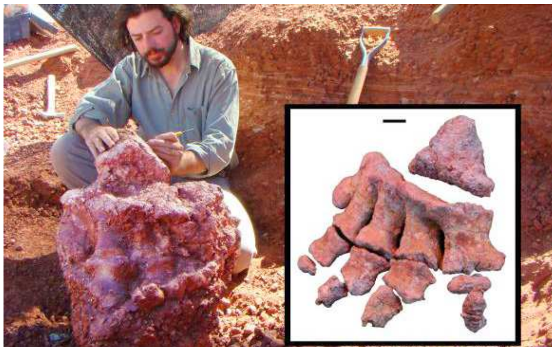
Os fósseis, encontrados na província argentina de Mendoza, têm cerca de 86 milhões de anos, disse Gonzalez

"Apesar do caráter incompleto do esqueleto impedir a realização de estimativas precisas do seu tamanho, o úmero (osso do braço) tem 1,76 metros de comprimento, sendo maior do que o e qualquer outro tiranossauro conhecido." O paleontólogo acrescentou que o animal teria entre 25 e 28 metros de altura e pesaria entre 40 e 60 toneladas.