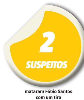
mataram Fábio Santos com um tiro

efetuado por um dos criminosos e, infelizmente, veio a óbito no local. A Polícia Militar realiza diligências na tentativa de prender os suspeitos.