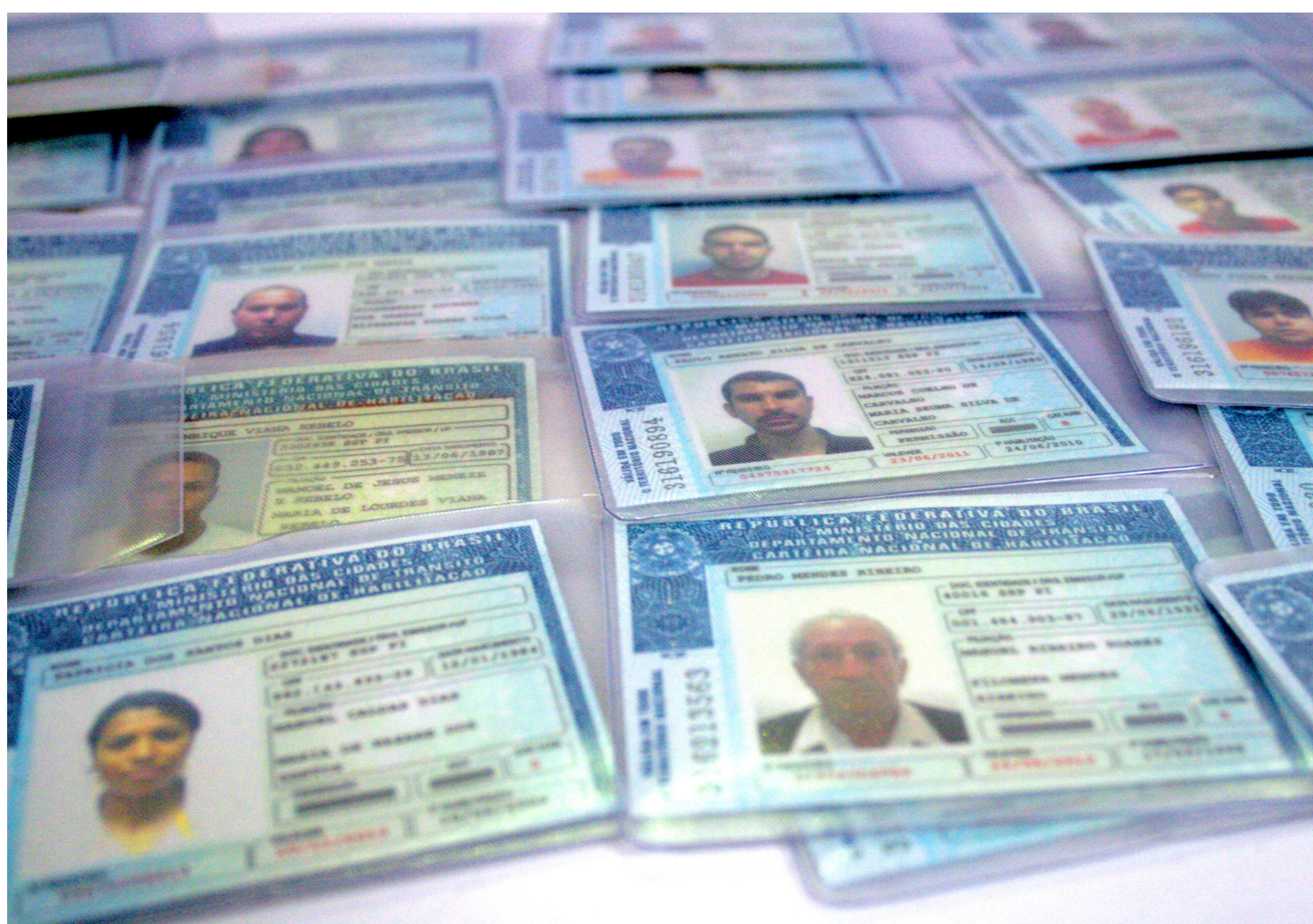
Suspensão da CNH pode ocorrer quando o motorista praticou algum crime de trânsito, como lesão corporal culposa ou embriaguez ao volante