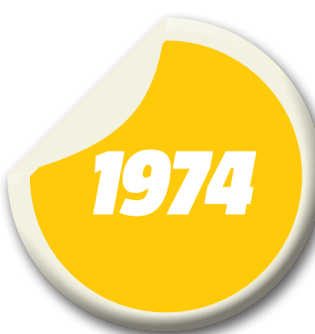
Ano em que o Arquivo Público foi fundado

O segundo setor, o de Avulsos, reúne as documentações “soltas”, o que inclui correspondências enviadas por autoridades aos governantes do Maranhão e ao Chefe de Polícia. Nesse acervo estão séries documentais que são as cartas de datas e sesmarias, cartas patentes, passaportes, mapas de nascimento, batismos, casamentos, entre outras.