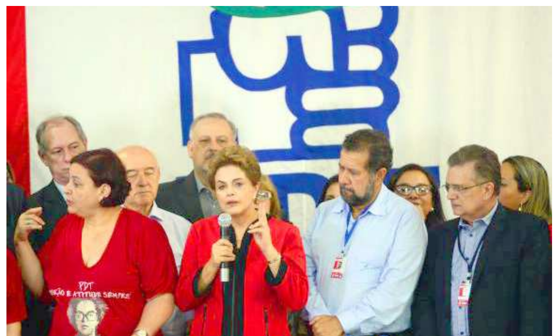
Durante a convenção do PDT, realizada ontem, a presidente Dilma anunciou que os investimentos voltarão ao país

Para Dilma , os investimentos voltarão ao país e o Brasil retomará o crescimento. “Temos todos os fundamentos sólidos para isso”, garantiu, ao acrescentar que o processo de inclusão social não será inter-