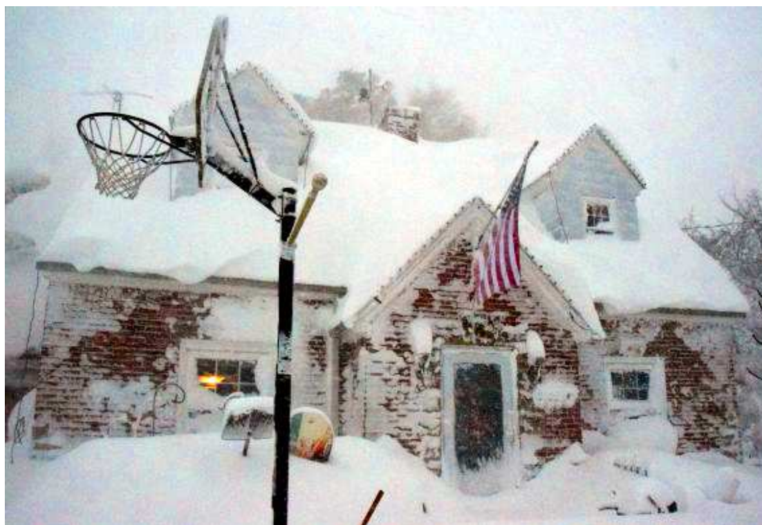
Previsões meteorológicas indicam que o mau tempo nos EUA pode deixar até 60 centímetros de neve nas ruas

O metrô de Washington, que serve os estados vizinhos de Ma-