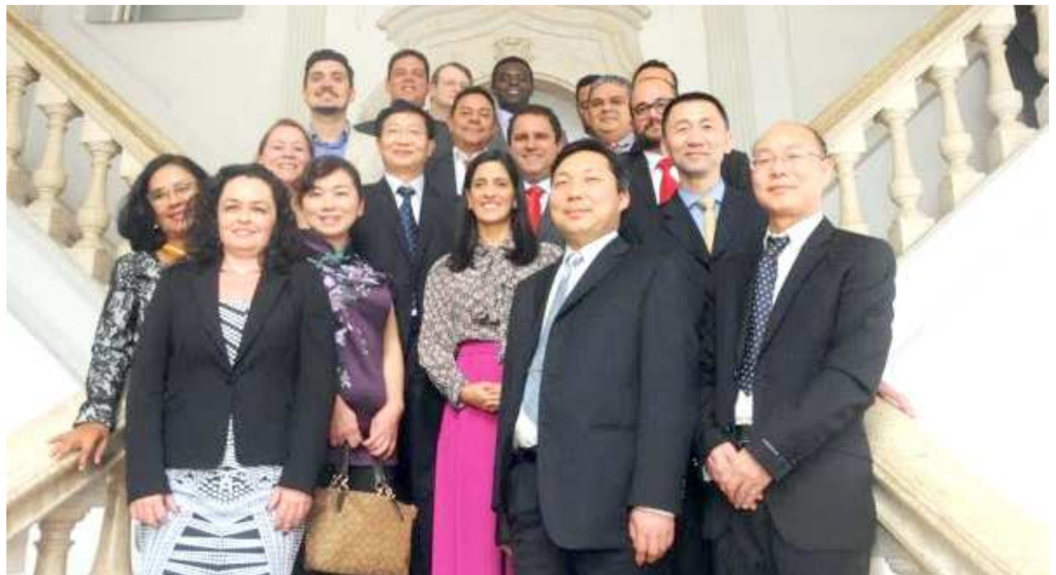
Durante a reunião, os secretários municipais presentes fizeram uma breve explanação sobre as principais ações desenvolvidas em suas pastas

Ainda na área esportiva, a cidade de Wuhan pretende convidar treinadores de futebol em São Luís para visitar Wuhan, regularmente, com a finalidade de dar treinamento de futebol e instrução, com a duração de curto prazo, para equipes adolescentes de futebol na localidade chinesa.