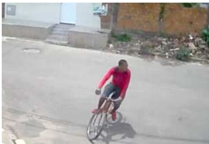
Novas imagens de suspeito podem atrapalhar as investigações da polícia