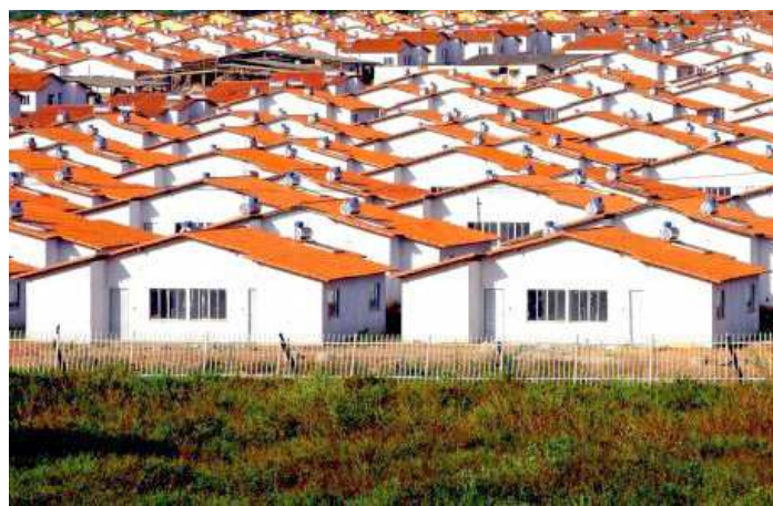
A iniciativa faz parte do Plano de Ações 'Mais IDH', do governo estadual