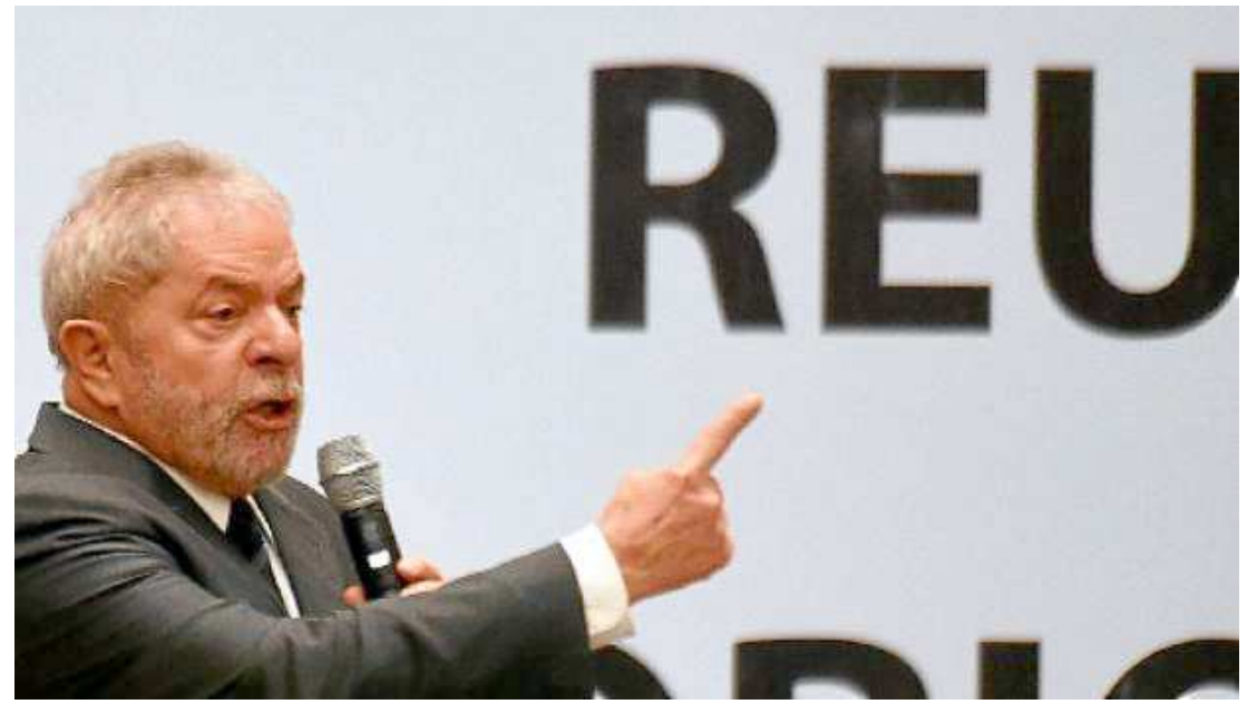
Lula foi intimado por um oficial de Justiça, o que o obriga a comparecer à 10ª Vara, salvo por motivo de força maior