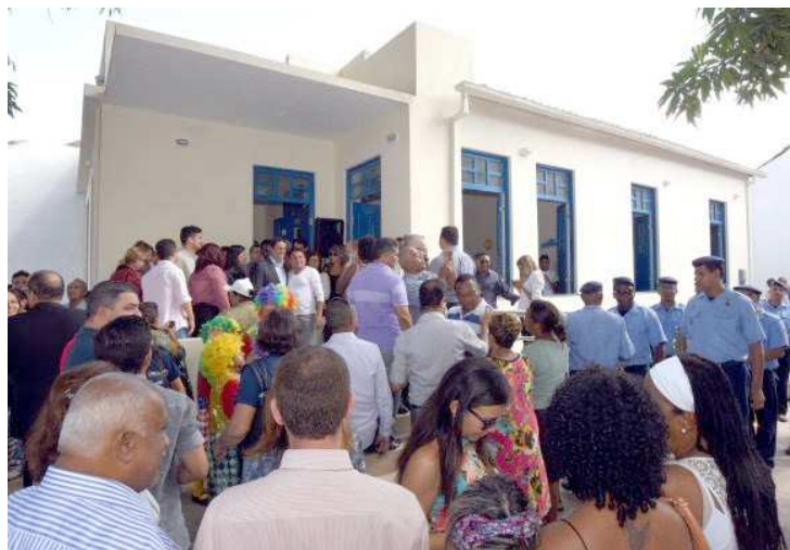
O projeto foi realizado numa ação integrada que envolveu diversos órgãos