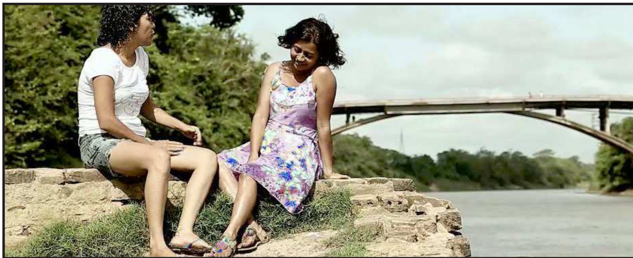
O filme Caminho de Pedras Miúdas teve todo o roteiro gravado na cidade de Itapecuru-Mirim, considerada o berço de uma grande tradição cultural e que lança os filhos da terra como principais protagonistas