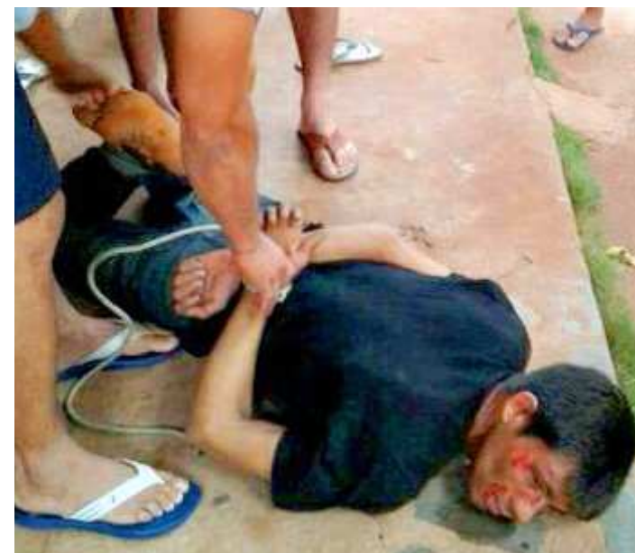
“Evandro” disse à polícia que iria tomar um cafezinho na residência