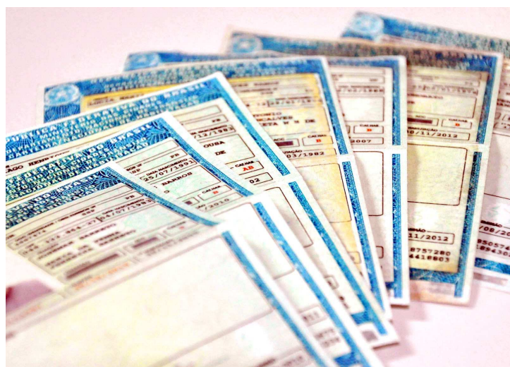
Motoristas podem reaver documento após cumprir penalidade