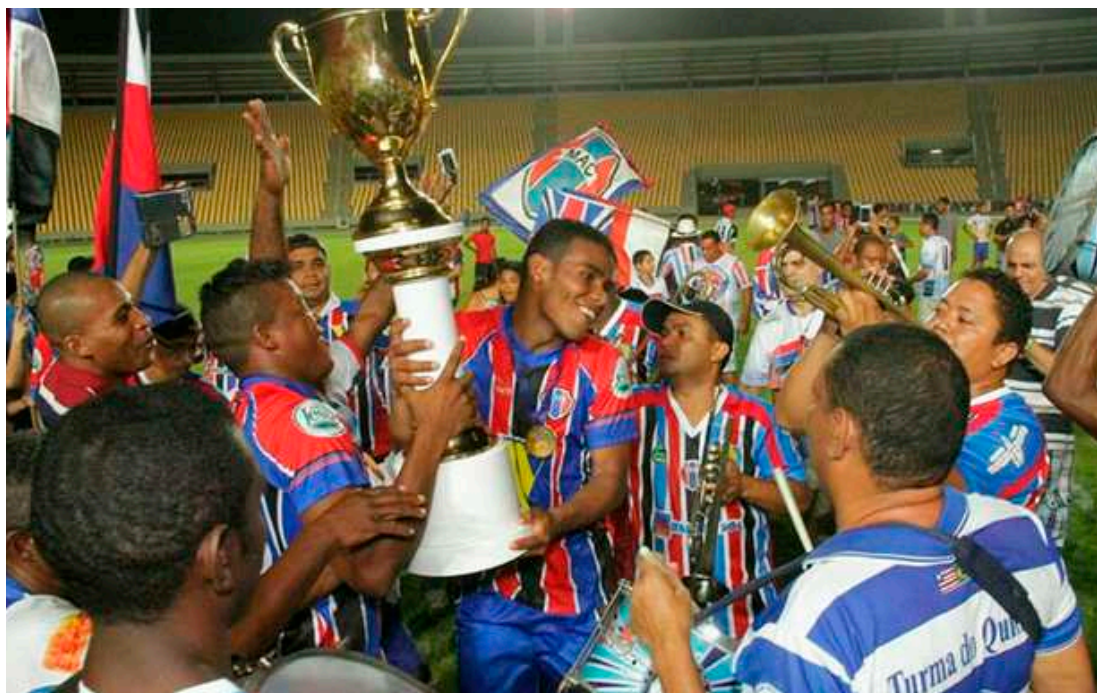
Após ser rebaixado em 2014, o Bode Gregório conquistou o acesso com o título da Série B do Campeonato Maranhense

Já o meia Marquinhos sofreu uma lesão e o volante Otávio cumpre suspensão pendente da Série B do Campeonato Estadual de 2015, quando disputou a competição pelo Marília, time vice-campeão.