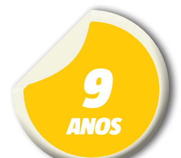
É a idade da garota que foi raptada

De acordo com familiares da garota, as imagens provavelmente teriam sido divulgadas por moradores da região onde aconteceu o crime. O suspeito ainda não foi identificado. Segundo a Secretaria de Segurança Pública (SSP), as imagens podem atrapalhar as investigações que seguem em sigilo.