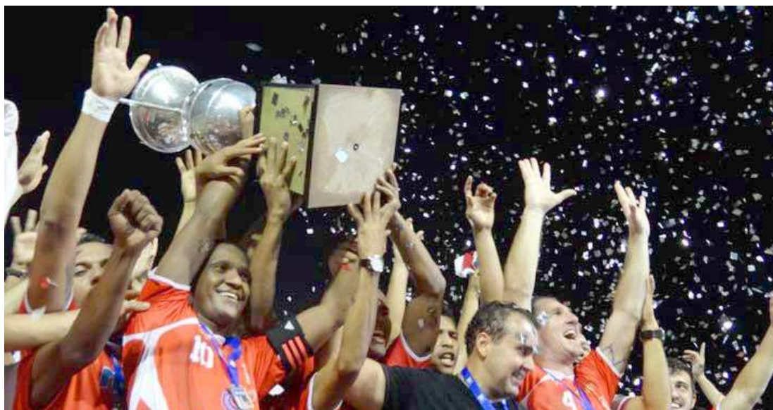
O Imperatriz, atual campeão Estadual, inicia campanha para o bicampeonato e deixar o título no interior