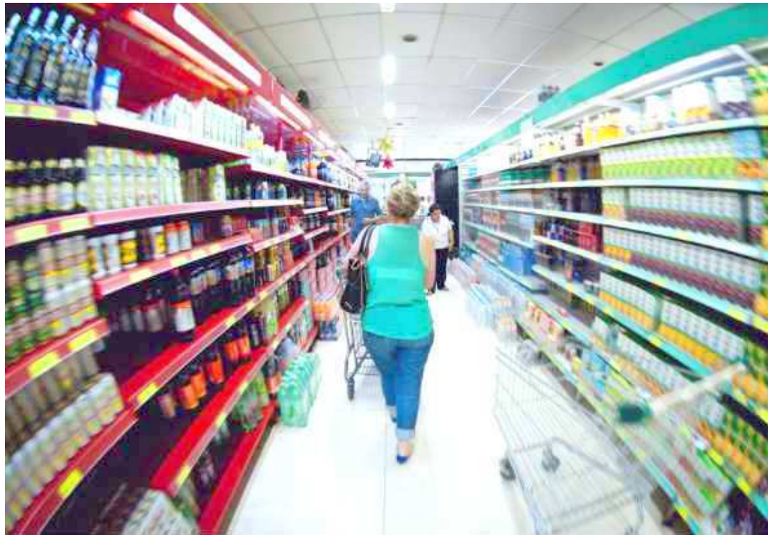
A Selic determina se você poderá encher o carrinho do supermercado ou comprar uma casa própria

“A Selic tem uma influência direta na vida dos brasileiros. As pessoas geralmente acham que a inflação, por encarecer os produtos e atuar na oferta e procura, é a única causa do desequilíbrio financeiro. Mas a taxa básica de juros é fator determinante em toda conjuntura econômica, pois ela atua nas aplicações financeiras, nos fundos