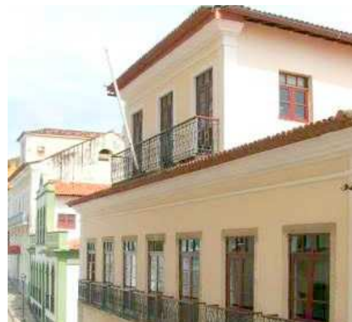
Arquivo Público guarda o maior acervo documental do estado