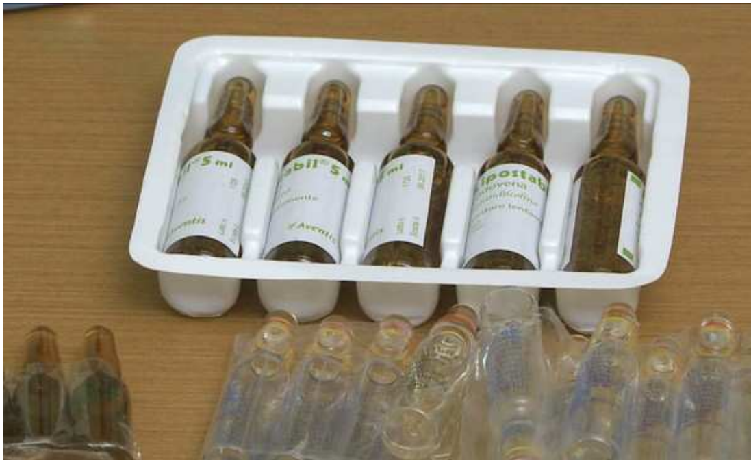
A polícia encontrou com o acusado ampolas de medicamentos usados nos EUA para engordar cavalos