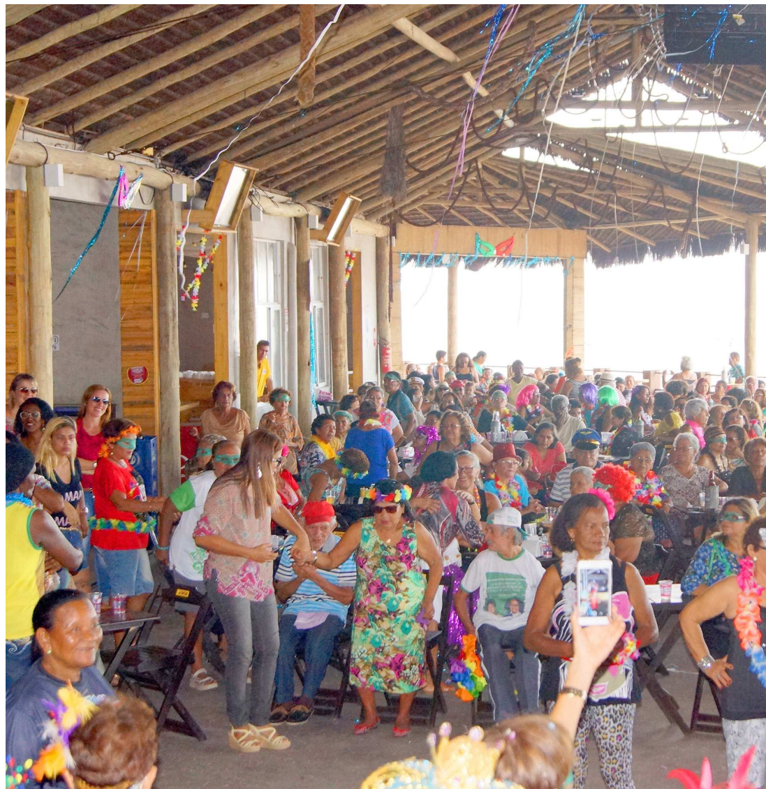
Centenas de servidores aposentados do estado participaram do baile que ocorreu na Casa das Dunas, no Calhau