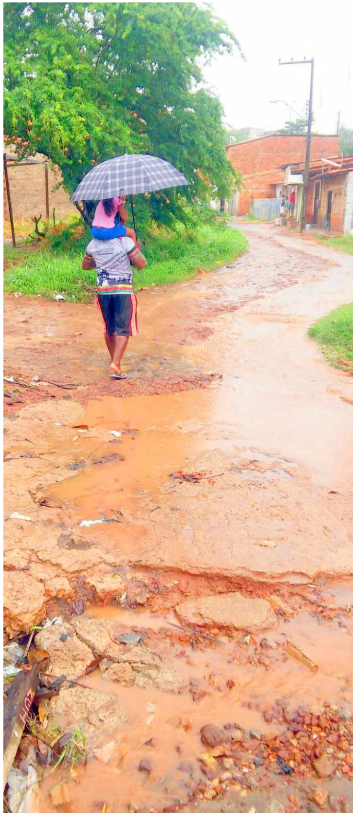
Ocorrências de chuvas tanto na capital, quanto no interior, serão intensas