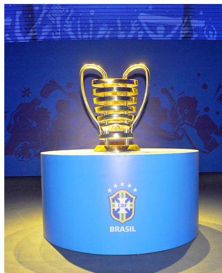
Taça da Copa do Nordeste deve vir em março para São Luís

A Copa do Nordeste começa no dia 13 de fevereiro e terá Sampaio e Imperatriz como representantes maranhenses. O Imperatriz estreia em casa diante do Salgueiro no dia 13, no Frei Epifânio D’Abadia, enquanto o Sampaio estreia fora de casa contra o Flamengo-PI, no dia 14, às 19h15.