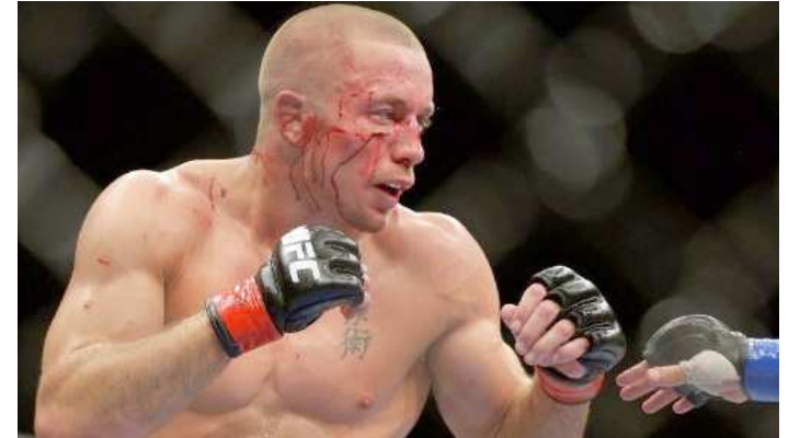
Georges Saint-Pierre se aposentou como campeão dos meio-médios