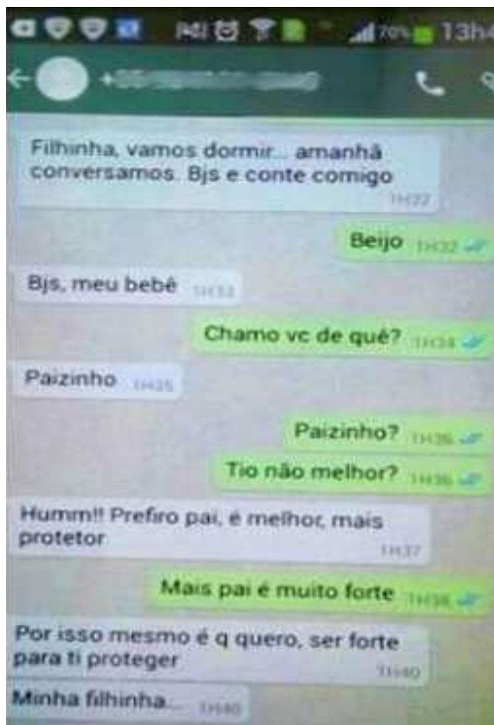
Polícia investiga autenticidade de supostas mensagens do prefeito