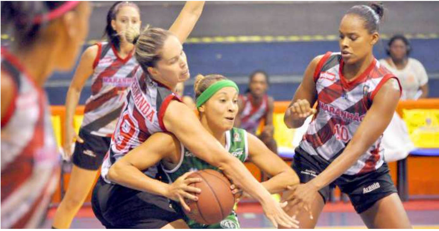
Após dupla derrota em Recife, Maranhão Basquete completou seis jogos sem vencer até aqui na temporada da Liga de Basquete Feminino