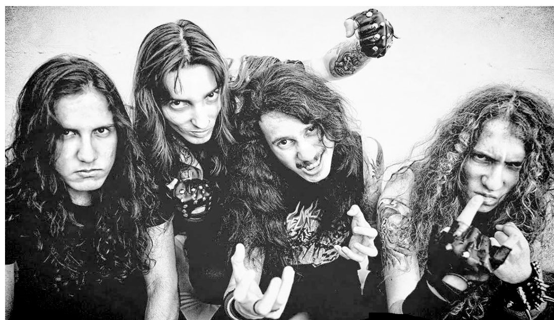
Jackdevil desembarcará em fevereiro para a segunda parte da turnê pela América Latina, em nove países