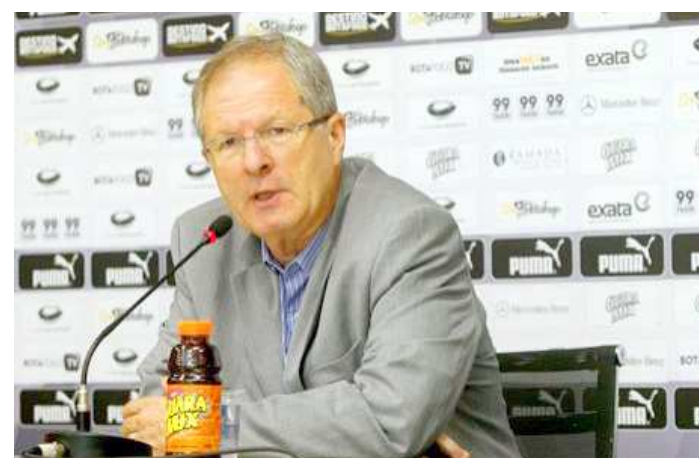
Botafogo busca garantias para disputar o Campeonato Carioca