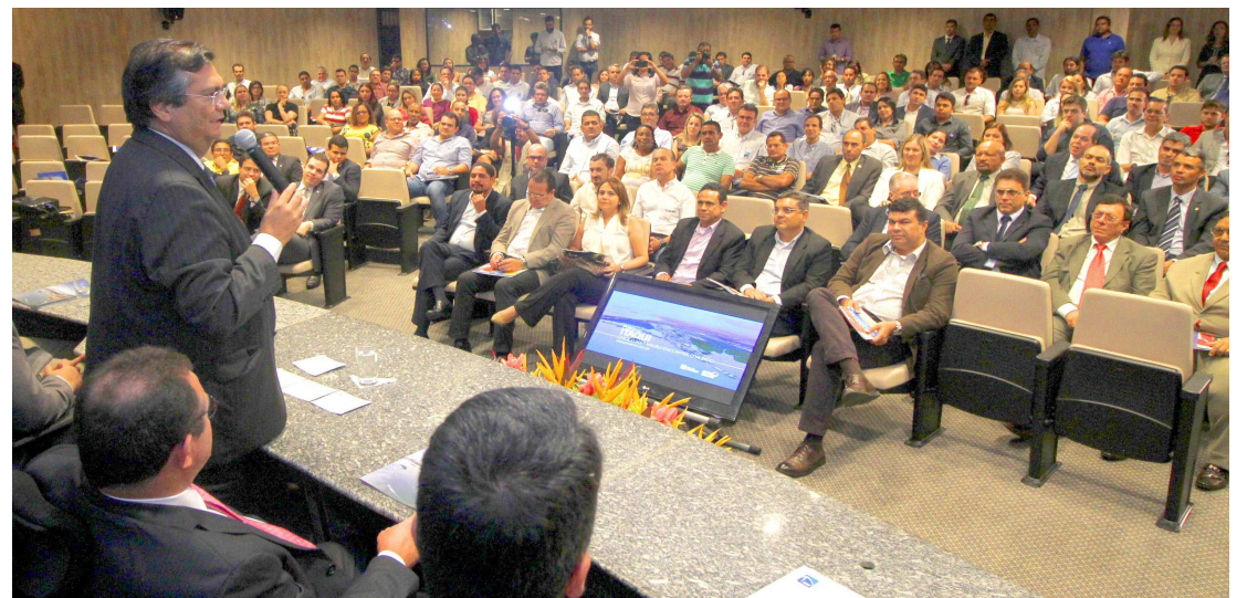
O governador Flávio Dino apresentou os investimentos tanto públicos, como privados, para o Porto em 2016