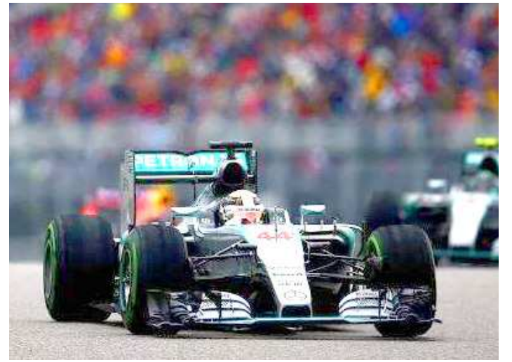
Categoria pode ter uma corrida no sábado e outra no domingo em 2017