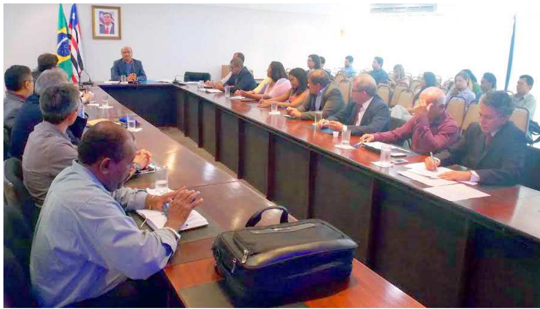
Relatório apresentado em reunião da Coetrae mostrou melhora na fiscalização e combate ao trabalho escravo