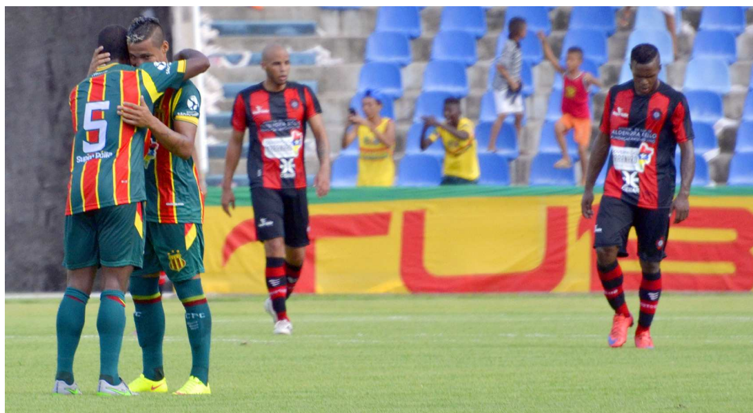
Sampaio Corrêa leva a melhor sobre o rival Moto Club no primeiro clássico maranhense de 2016