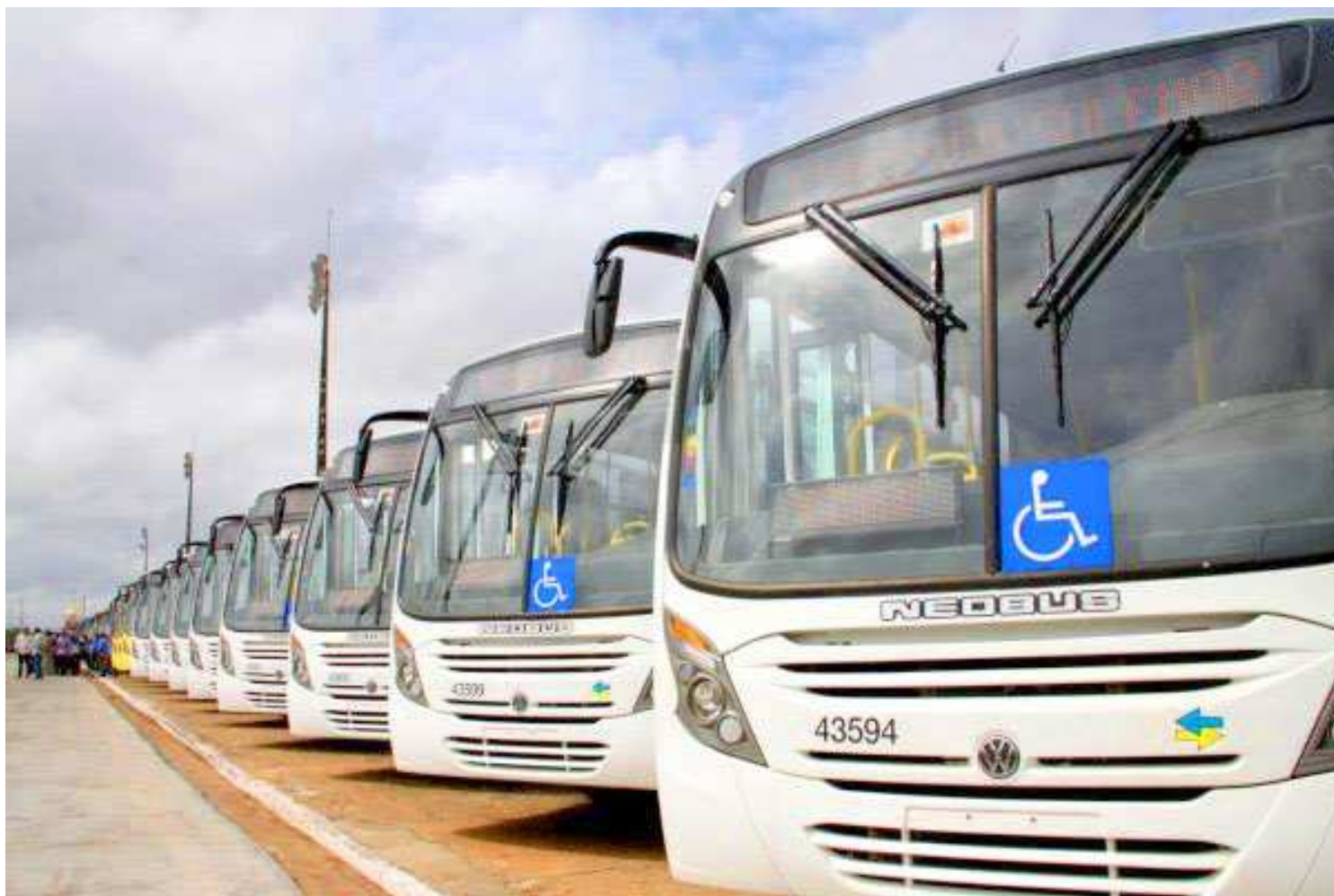
Sistema de transporte público de São Luís conta com uma frota de 874 ônibus. Veículo que estiver irregular será apreendido e empresa pagará multa