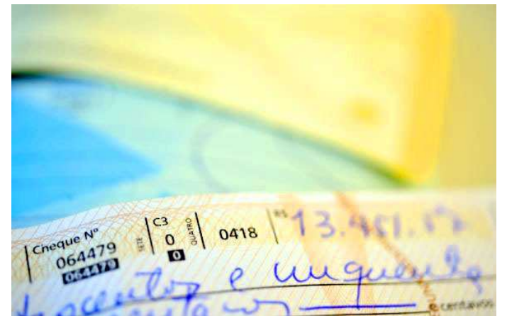
Talões de cheque estão perdendo espaço, diz pesquisa da Febraban

No entanto, ao longo do tempo, a modalidade foi se tornando mais acessível, até ser eliminada a exigência de limite mínimo para a TED, em 13 de janeiro deste ano. Walter Farias lembra que também houve crescimento maciço na utilização dos cartões. “É mais fácil usar o cartão, tanto de crédito quanto de débito, do que passar um cheque e correr o risco de falsificação”, observa.