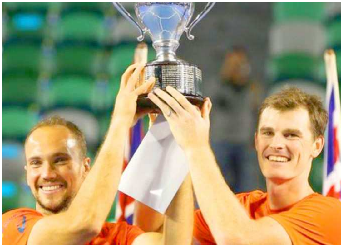
Bruno Soares conquistou o seu quarto troféu de Grand Slam no Aberto da Austrália com Jaime Murray

As vítimas deste domingo foram o romeno Horia Tecau e a americana Coco Vandeweghe. O jogo terminou com dois sets a um com parciais de 6/4, 4/6 e 10/5. Foi uma atuação irregular da parceria formada pelo brasileiro e pela russa, mas que terminou com sucesso graças a um impecável match tie-break de Vesnina, que contou com poucas, mas igualmente precisas