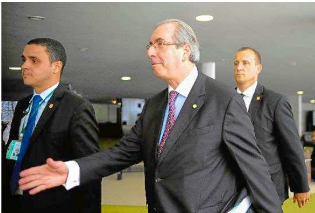
Eduardo Cunha, presidente da Câmara dos Deputados, responde a processos referente a contas na Suíça

Encerrada em 15 de dezembro, a primeira fase do processo de quebra de decoro contra Eduardo Cunha durou mais do que o dobro do tempo consumido nessa etapa nos últimos casos em que o Conselho de Éti-