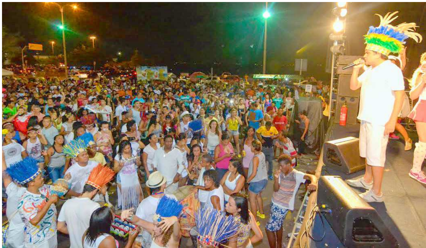
Favela do Samba, Bicho Terra e Banda Bandida foram algumas das dezenas de atrações do pré-'Carnaval de Todos' no Centro Histórico de São Luís

No período de Pré-Carnaval, de 9 a 30 de janeiro, apresentaram-se dezenas de atrações exclu-