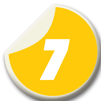
Pontuação do Cordino no Grupo B