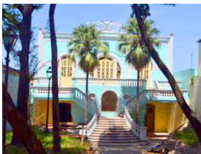
Candidatos devem ficar atentos ao prazo, que se encerra no dia 4

A escola está oferecendo 52 vagas para os cursos técnicos em instrumentos e canto lírico, que exige conhecimentos musicais básicos, e 30 vagas para os cursos fundamental infantil e adulto, que não exigem formação básica. Os custos com o