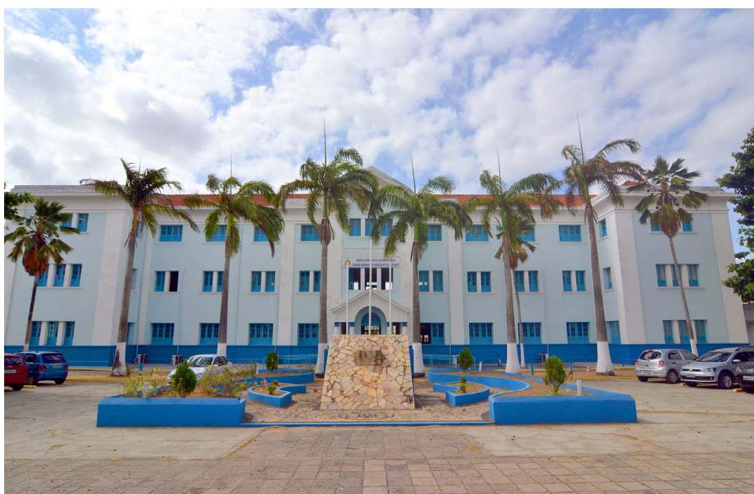
Parte dos convocados vão estudar no lema de São Luís, no Colégio Marcelino Champagnat, antigo Maristas

As listas com os nomes dos candidatos convocados podem ser consultadas no site da Secretaria, no endereço www.secti.ma.gov.br . As matrículas dos candidatos nos Cursos da Educação Profissional Técnica na Forma Integrada ao Ensino Médio devem ser efetivadas por seus representantes legais que comparecerão à unidade para qual o aluno concorre a uma das vagas (em São Luís, Bacabeira ou Pindaré-Mirim).