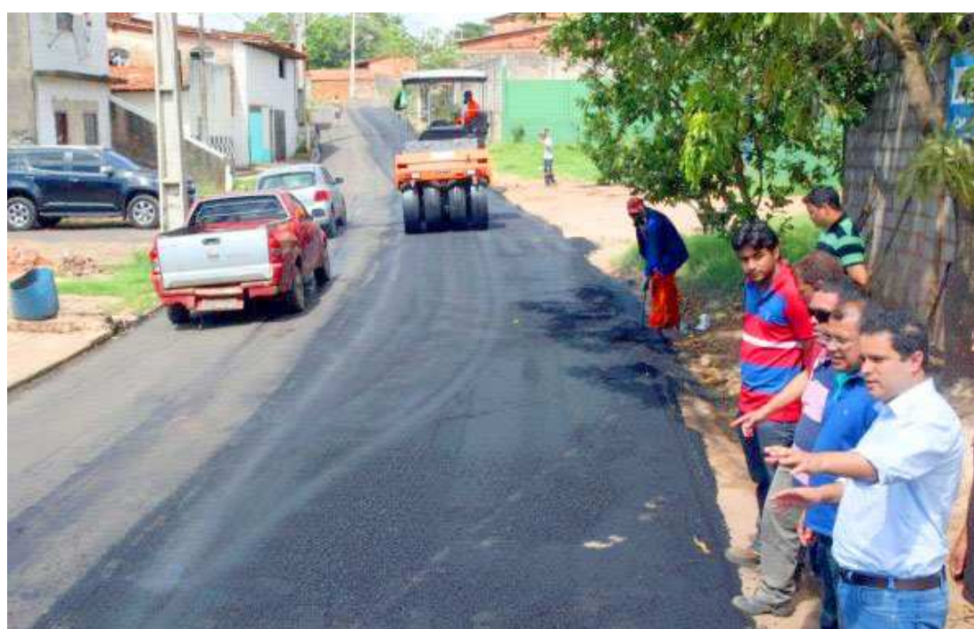
Prefeito adiantou que serão implantados 3km de asfalto na Rua Santo Antônio, principal via do bairro