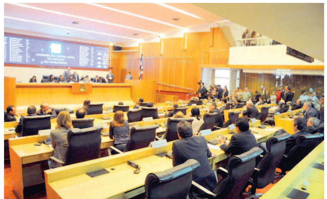
Parlamentares voltam aos trabalhos amanhã em uma sessão que contará com a presença do governador

Coutinho também deixou claro que os resultados obtidos no ano passado devem refletir neste ano por conta de unidade criada entre os parlamentares, independentemente do grupo político ao qual esteja ligado. “Penso que 2016 seja como 2015, com a Assembleia unida, os colegas respeitando uns aos outros. Lá é uma Casa democrática, onde a oposição teve espaço para se expressar, respeitando os