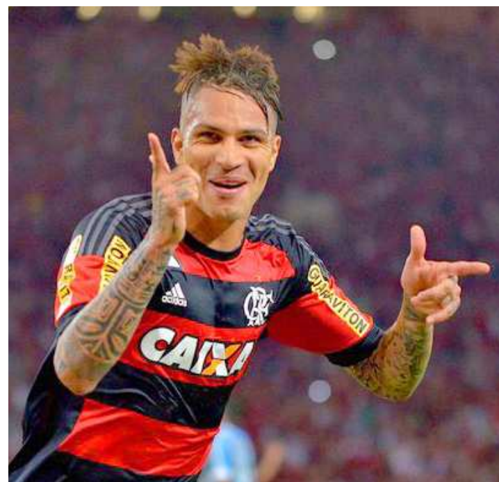
Peruano Paolo Guerrero marcou três gols em dois jogos em 2016

Apesar da vantagem mínima no 2º tempo, o Flamengo não se arriscava na frente no 2º tempo e controlava a bola, explorando a fragilidade do Boavista. Mas a