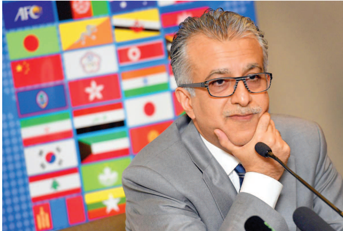
Xeque Salman Bin Ebrahim Al Khalifa passa a ser o favorito para eleições da presidência da Fifa

Além deles, outros candidatos também estão na disputa, mas agora já ficam praticamente sem chances. Jerome Champagne e Tokyo Sexwale também estiveram em Ruanda buscando apoio, enquanto Ali bin Hussein, o príncipe da Jordânia, não esteve presente.