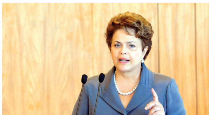
Dilma Rousseff sancionou a Lei ontem e faz alterações pontuais

Outra mudança aprovada com o novo texto é a análise prévia, pelos tribunais estaduais, de recursos submetidos aos tribunais