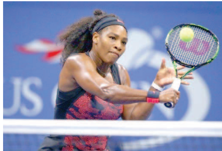
Serena Williams é a atual líder do ranking do tênis feminino

WTA, organização que rege o tênis feminino, confirmou que as Olimpíadas de 2016, no Rio de Janeiro, não valerão pontos no ranking mundial. Anteriormente, a ATP, que comanda a categoria masculina, também havia anunciado que não haveria pontuação para a competição entre os homens.