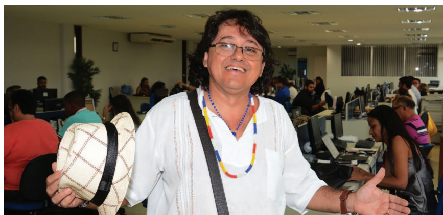
Vandico comandará a alegria com uma grande programação no Centro Histórico

A Turma do Vandico realiza hoje o tradicional grito de carnaval no Centro Histórico, avisando que a temporada de carnaval do Movimento Popular de Samba acontecerá com três bailes, que serão realizados no Casarão Sem Telhado, onde funciona a sede do grupo com várias atrações carnavalescas. A festa tem como objetivo reviver os antigos Carnavais de rua de São Luís, mantendo também a tradição do samba de raiz. Os anfitriões da Turma do Vandico esperam a participação dos amigos e a interação