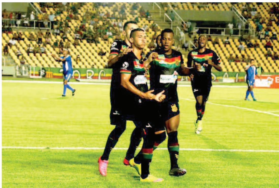
Sampaio Corrêa venceu todos os quatro jogos que disputou no Campeonato Maranhense

o Campeonato Maranhense, Chamusca não esquece a Copa do Nordeste, e admite usar um time alternativo nos próximos jogos: "Com a proximidade de uma nova competição pela frente, existe a possibilidade de mesclarmos o time nos próximos jogos do Maranhense. Nossa intenção é preservar o grupo ao máximo para estrearmos bem na Copa do Nordeste", afirmou.