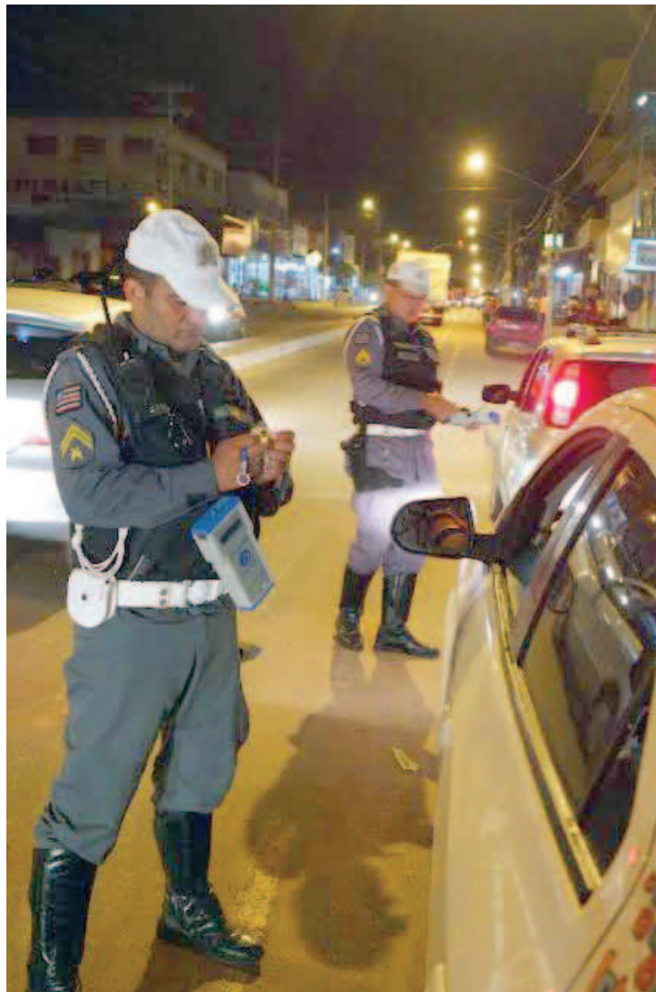
Policiais militares munidos de abômetro aplicam Operação Lei Seca