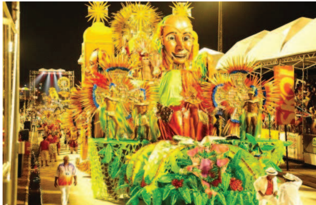
Grandiosidade dos carros alegóricos e o luxo chamaram a atenção de quem foi assistir ao desfile das escolas