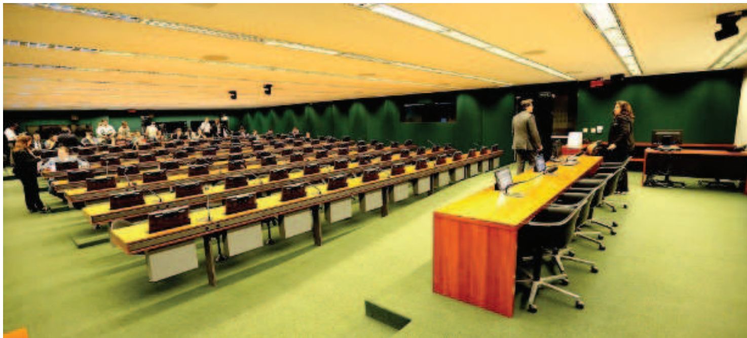
Presidente do Congresso, senador Renan Calheiros, já avisou a aliados que pretende promulgar na próxima semana a emenda constitucional

Atualmente, eles só podem mudar de partido preservando o mandato nos casos de grave discriminação pessoal, mudança