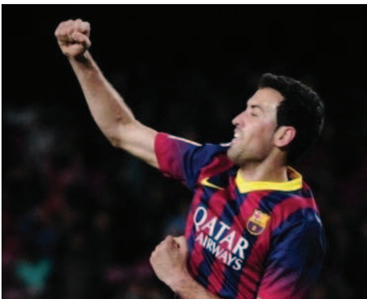
Volante Sergio Busquets está na mira do PSG para esta temporada

O valor da multa é considerado elevado pelo clube francês, que estaria fortalecendo um rival direto na briga pelo título da Liga dos Campeões. Além disso, será preciso convencer o técnico Luis Enrique a liberar o atleta, já que o espanhol o classificou como "o melhor meio-campista do mundo" nesta temporada.