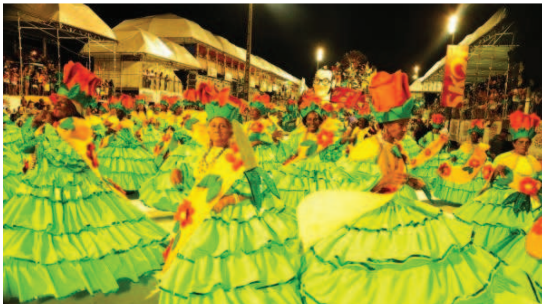
Baianas venceram o cansaço e mostraram alegria e desenvoltura durante o desfile na Passarela do Samba