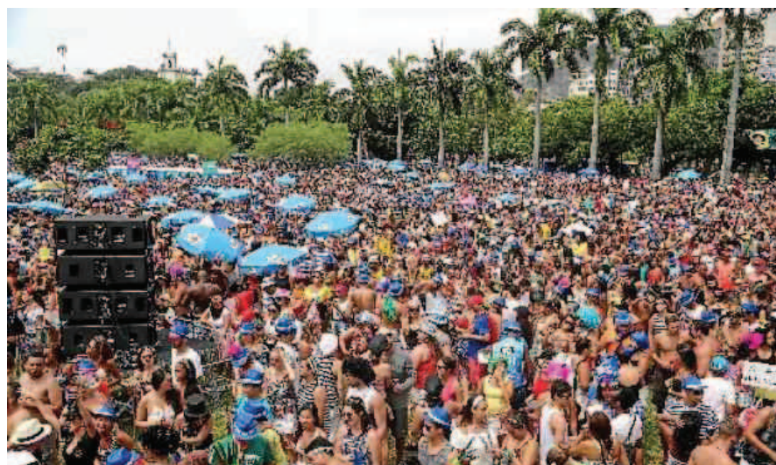
A bateria do Bangalafumenga foi acompanhada por 100 mil pessoas, no Aterro do Flamengo, no domingo

O Cordão do Boitá, um dos ícones da retomada do carnaval de rua carioca, comemorou 20 anos em 2015 com 40 mil foliões reunidos no centro do Rio. Houve quem homenageasse o comunicador Abelardo Barbosa, o Chacrinha, retratasse uma montanha-russa, e até criticasse os governos federal, de Dilma Rousseff, e estadual, de Luiz Fernando Pezão. Professores da rede municipal de ensino vieram vestidos de palhaço e se concentraram nas escadarias da Assembleia Legislativa do Rio de Janeiro. A cantora Teresa Cristina, com 19 anos de Boitá, esteve presente, ao lado de