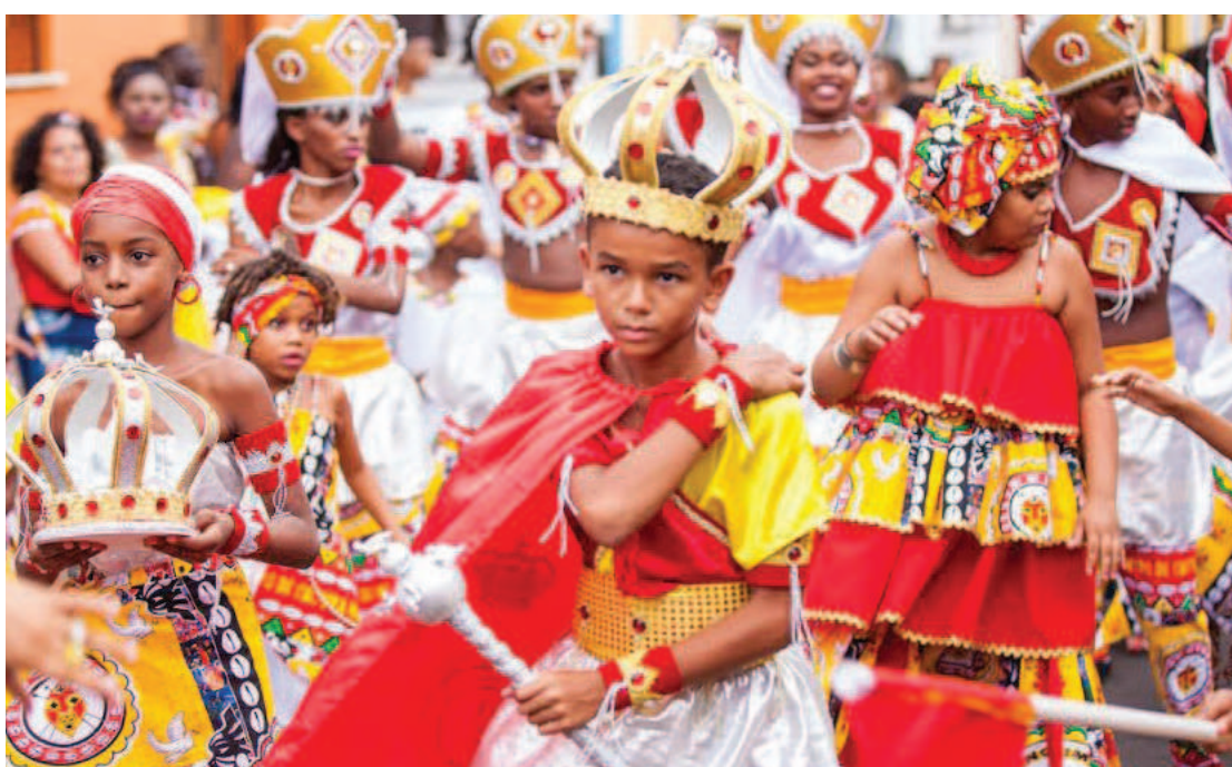
Novas gerações seguem em defesa da igualdade racial expressada através das manifestações culturais

Este é o tempo de fundação do Bloco Akomabu