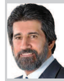
VALDIR RAUPP SENADOR POR RONDÔNIA E VICE-PRESIDENTE NACIONAL DO PMDB

Na pauta dos principais jornais e noticiários de televisão, destacam-se a renitente pressão inflacionária, a crescente recessão e os espectros do desemprego e da redução da renda. Por outro lado, surgem nas colunas econômicas especializadas a questão das contas externas no contexto da redução do rating do Brasil e um eventual refluxo de capitais especulativos. Em consequência, a sociedade brasileira depara-se com clima de pessimismo e derrotismo. Investir em quê?