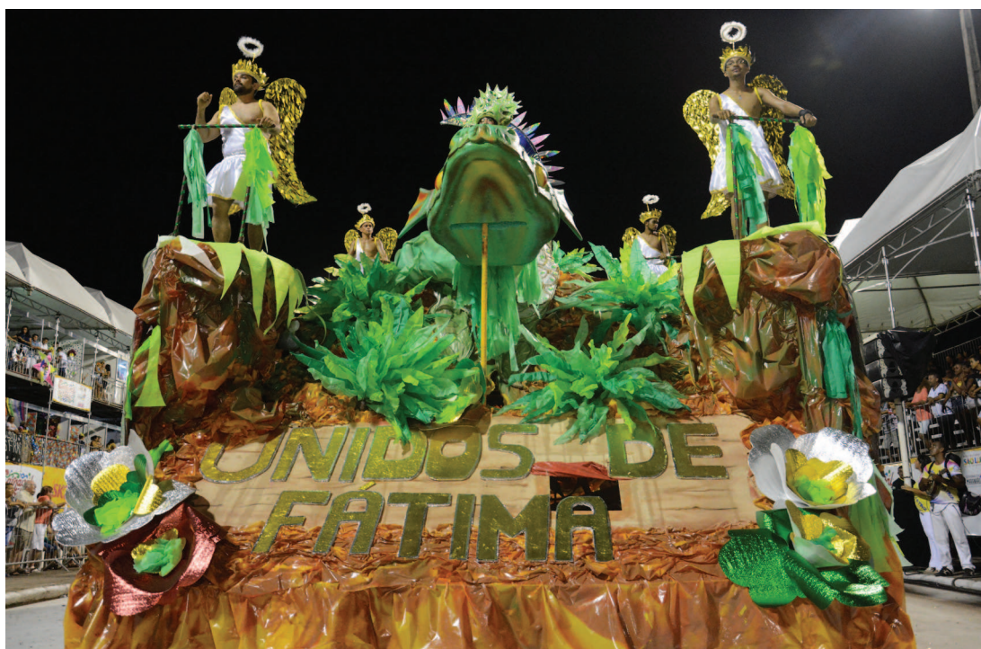
Unidos de Fátima fez uma homenagem a Jackson Lago e voltou a desfilar após três anos de ausência

De uma ave símbolo de uma região para homenagear um político, o desfile passou a ter uma preocupação ambiental com a Terrestre do Samba, que cantou Omundo é meu quintal , para conscientizar o povo da importância da preservação. A escola também deixou bem claro que a Estiva, bairro onde surgiu, tem todo um legado para a construção ambientalista e cultural de São Luís.