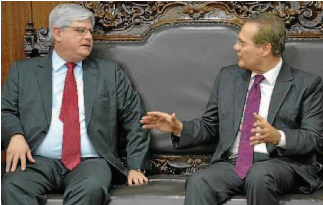
Rodrigo Janot abriu seis inquéritos contra o presidente do Senado, mas nenhum resultou em denúncia

e do STJ mostra que dezenas de procedimentos dependem de novas diligências da Polícia Federal, análise de peritos e analistas, além do enquadramento legal por parte da equipe de procurador-geral da República, Rodrigo Janot. As equipes, tanto em Curitiba (PR), onde começaram as investigações, quanto em Brasília, foram reforçadas. Um investigador da Operação Zelotes se queixa pelos corredores da falta de peritos para apressar as várias denúncias que tem de oferecer nos vários inquéritos do caso, porque praticamente todos estavam trabalhando na Lava-Jato em dedicação exclusiva. À exceção dos delatores, que confessaram seus crimes em troca de redução de punições, todos os investigados negam as acusações.