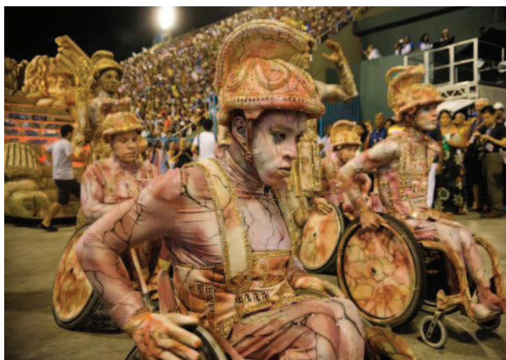
Comissão de frente da União da Ilha formada por tetraplégicos fez sucesso

O abre-alas em tom de terra chamou a atenção porque era uma alegoria viva, que é uma característica da escola quando em outros carnavais eram feitas pelo ex-carnavalesco da Tijuca, Paulo Barros. A alegoria de 2016 trazia seis componentes em movimento para formar o nome da escola. Além dos que participaram da formação da palavra, outros estavam espalhados no carro. Ao todo, segundo o coreógrafo Tony Tara eram 170 integrantes. Todos tiveram que fazer um preparo na concentração e passar argila com água, para manchar todo o corpo e ficarem com a cor de terra. “Chegamos na concentração e cada um ganhou uma lata com argila para