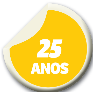
Idade do novo reforço do Grêmio

O meia-atacante, que atuava no Emelec e se destacou na Seleção do Equador, selou vínculo com o Grêmio na madrugada do último sábado para domingo. Segundo o presidente do clube equatoriano, Nasib Neme, o Tricolor gaúcho desembolsará US$ 5 milhões (R$ 20 milhões) por 70% dos seus direitos.