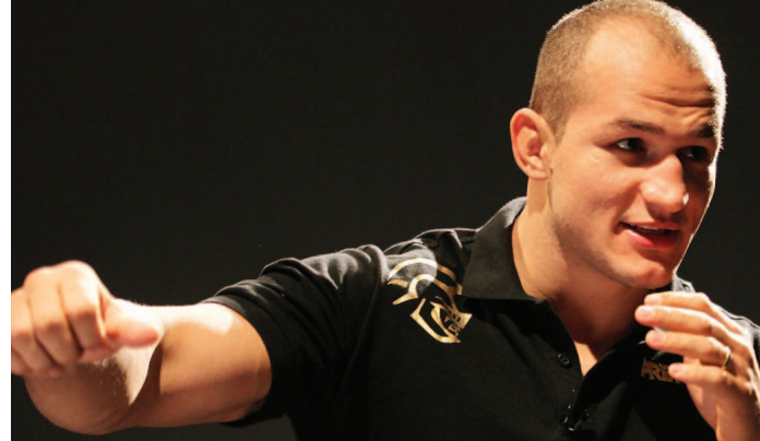
Brasileiro encara americano em boa fase, buscando da recuperação