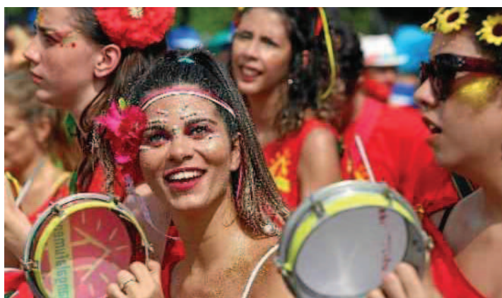
Mulheres entraram no ritmo do samba no carnaval de rua carioca

foram penalizados em R$ 510 no Rio de Janeiro