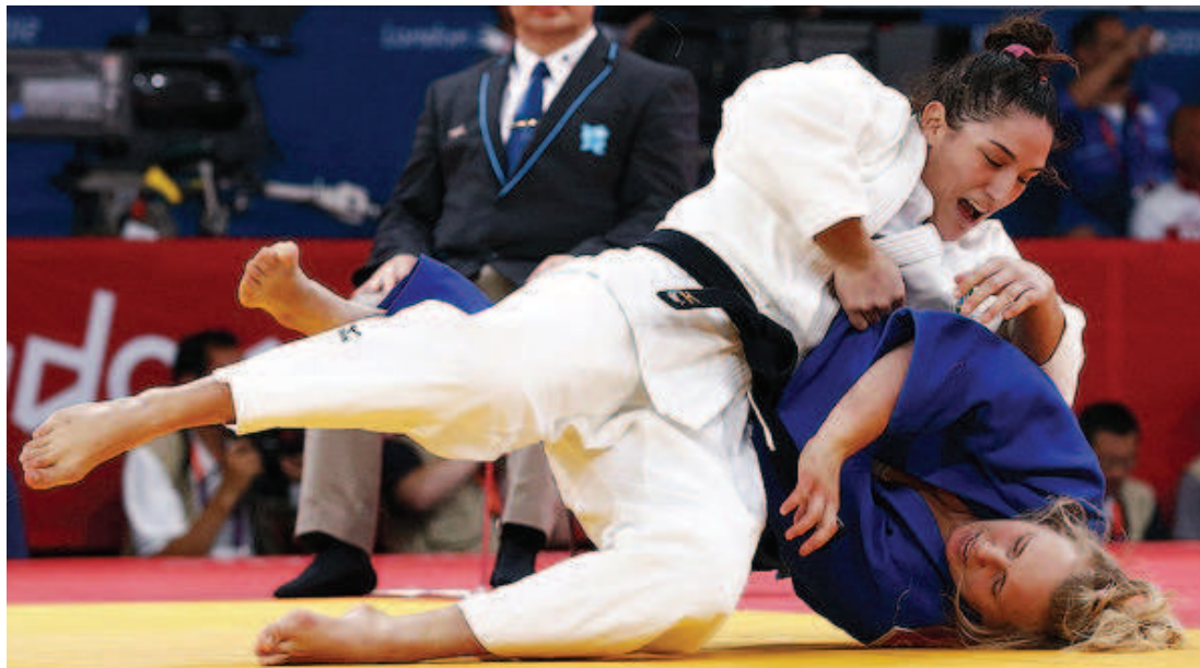
Mayra Aguiar, que levou ouro no Gram Slam de Paris, é uma das forças do judô brasileiro na Olimpíada

Quem também está em terceiro nos meio-leves é Érika Miranda que, embora ainda não tenha disputado competições em 2016, não perdeu posições. Rafaela Silva, diferentemente, ganhou medalhas nos dois torneios, e está em 10º do peso-leve.