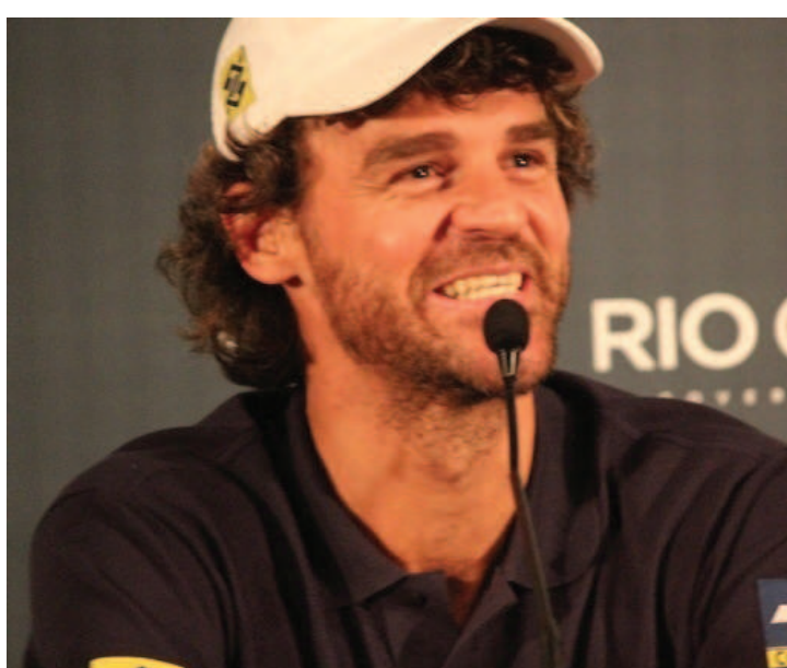
Gustavo Kuerten será homenageado na noite do próximo dia 15, no Rio

No ano passado, Guga também prestigiou o torneio e chegou a interromper uma partida de Nadal quando entrou na arquibancada para assistir ao jogo. O público, ao avistá-lo, deu início aos aplausos que forçaram a interrupção temporária da partida.