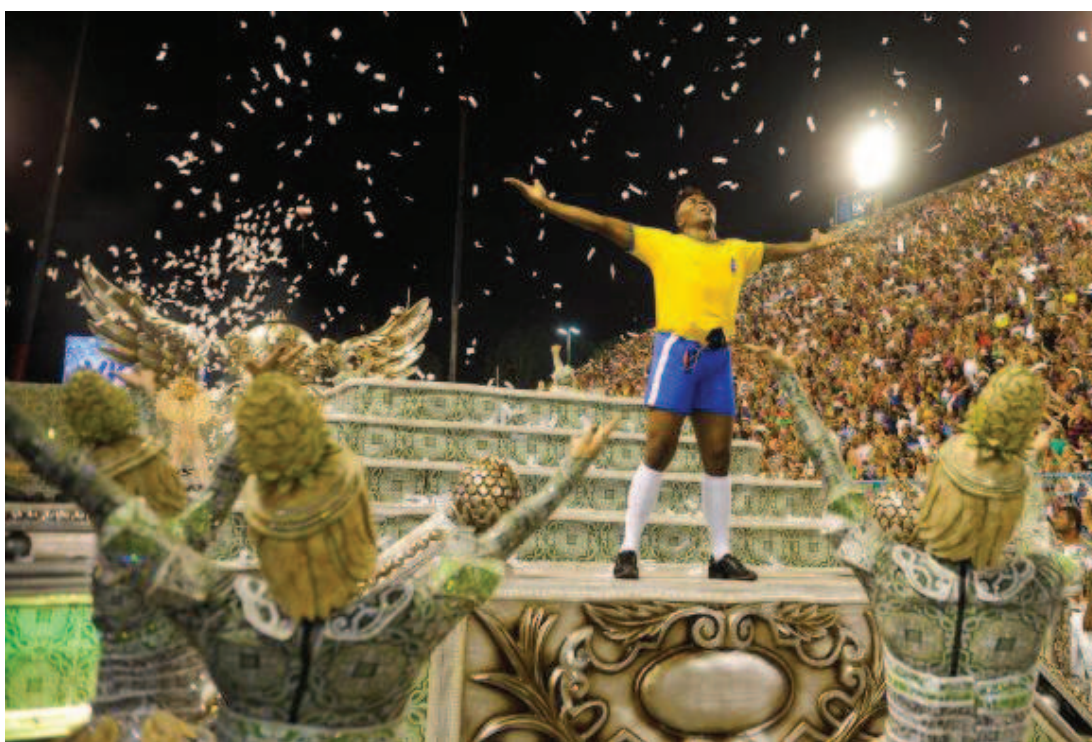
Acadêmicos do Grande Rio homenageia o Santos, com famosas e citações a Pelé e Neymar

Na comissão de frente, o enredo fez uma homenagem a Pelé. Um ator representava o rei do futebol e destacou do Santos Futebol Clube. Vestido com um short azul e uma camisa da seleção brasileira com o número 10 nas costas, ele subia no alto da alegoria que caracterizava uma bola e fazia movimentos que eram respon-