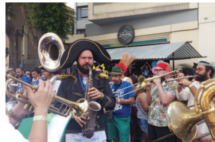
Músicos do Bloco da Charanga do França arrastaram uma multidão

De acordo com o organizador, em janeiro de 2015 o grupo fez o estandarte e camisetas do bloco e tudo aconteceu de forma espontânea. A banda serviu de núcleo, mas quem mais quis participar, tocando algum instrumento ou curtindo a música, foi muito bem-vindo.