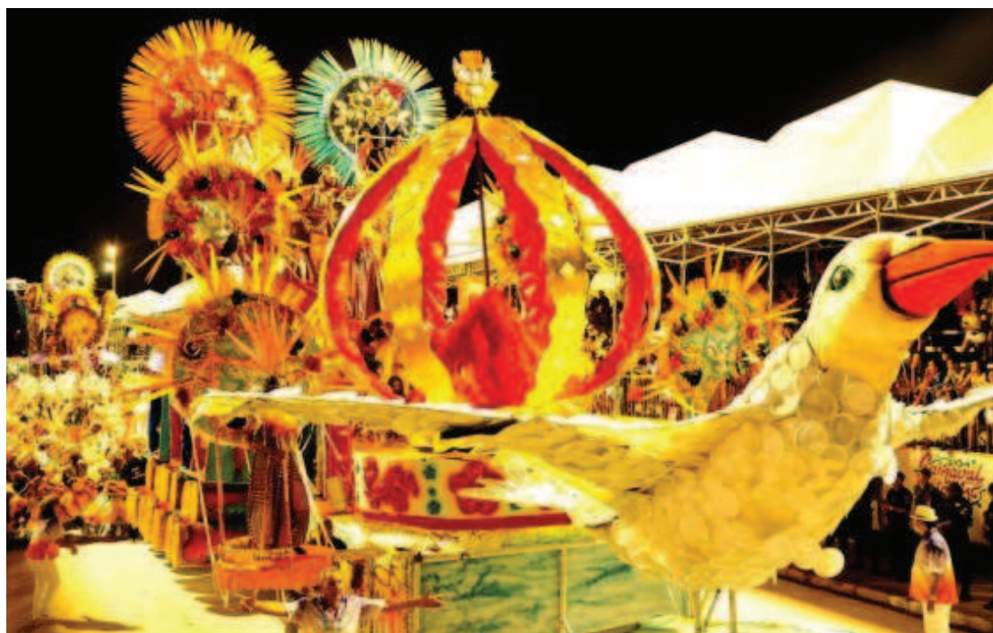
Carros alegóricos da Escola de Samba Império Serrano mostrou a riqueza ambiental da Baixada Maranhense