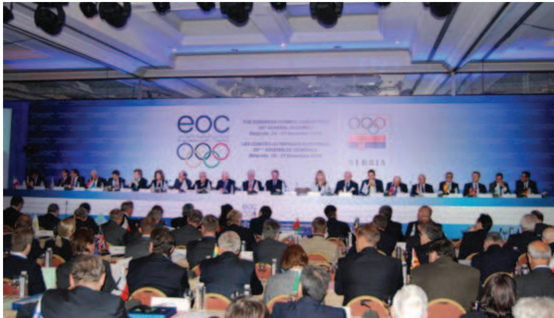
Representantes dos comitês internacionais da Europa estiveram reunidos para discutir a ameaça do zika no Rio

A postura dos comitês europeus contrasta com a do Comitê Olímpico dos Estados Unidos (USOC), que lançou um alerta às federações esportivas do país sobre os riscos causados pelo vírus zika, cujo maior vetor de