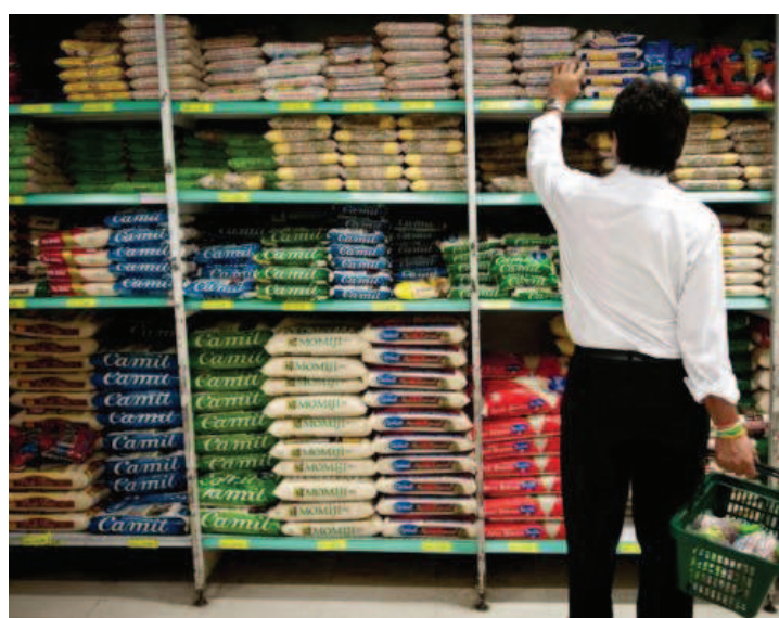
Entre os produtos que mais subiram de preço está o feijão

Já o feijão encareceu em 26 cidades, com destaque para Belém (20,43%). De acordo com a análise técnica do Dieese, fatores climáticos, como a seca no Centro-oeste e as fortes chuvas no Sul e Sudeste, afetaram a produção da leguminosa. "Mesmo com a entrada da safra, o feijão está escasso para o consumo interno", diz a nota técnica.