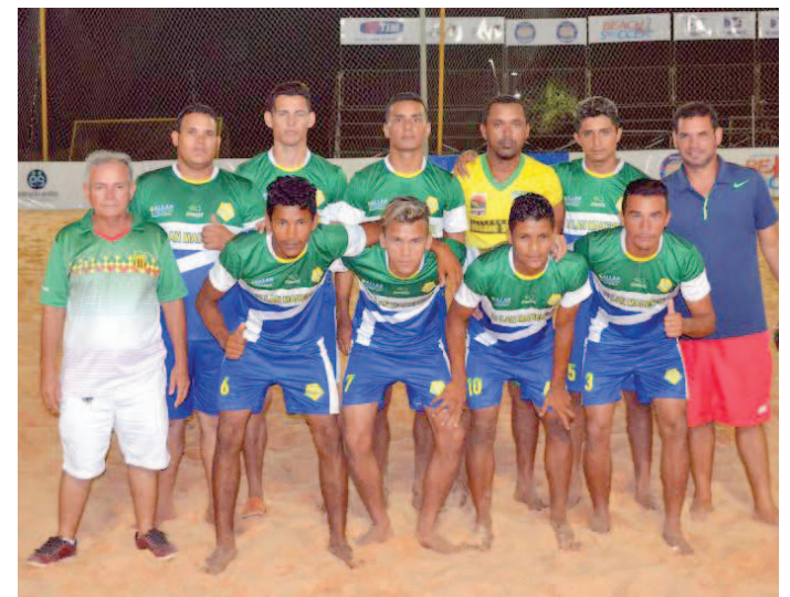
Seleção da Raposa aplica goleada de 8 a 4 na equipe caxiense