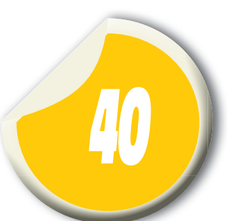
É o total de horas semanais de trabalho

Para participar, o candidato deve se inscrever entre 19 de fevereiro a 10 de março de 2016, por meio do site www.ibfc.org.br . A classificação dos candidatos ocorre por meio de Prova Objetiva e de Títulos, cuja primeira etapa é prevista para o dia 3 de abril de 2016. Esta seleção é válida por um ano, com possibilidade de prorrogação, a critério da Administração.