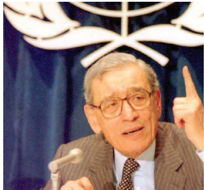
O diplomata egípcio de 93 anos foi o primeiro africano a ocupar o posto