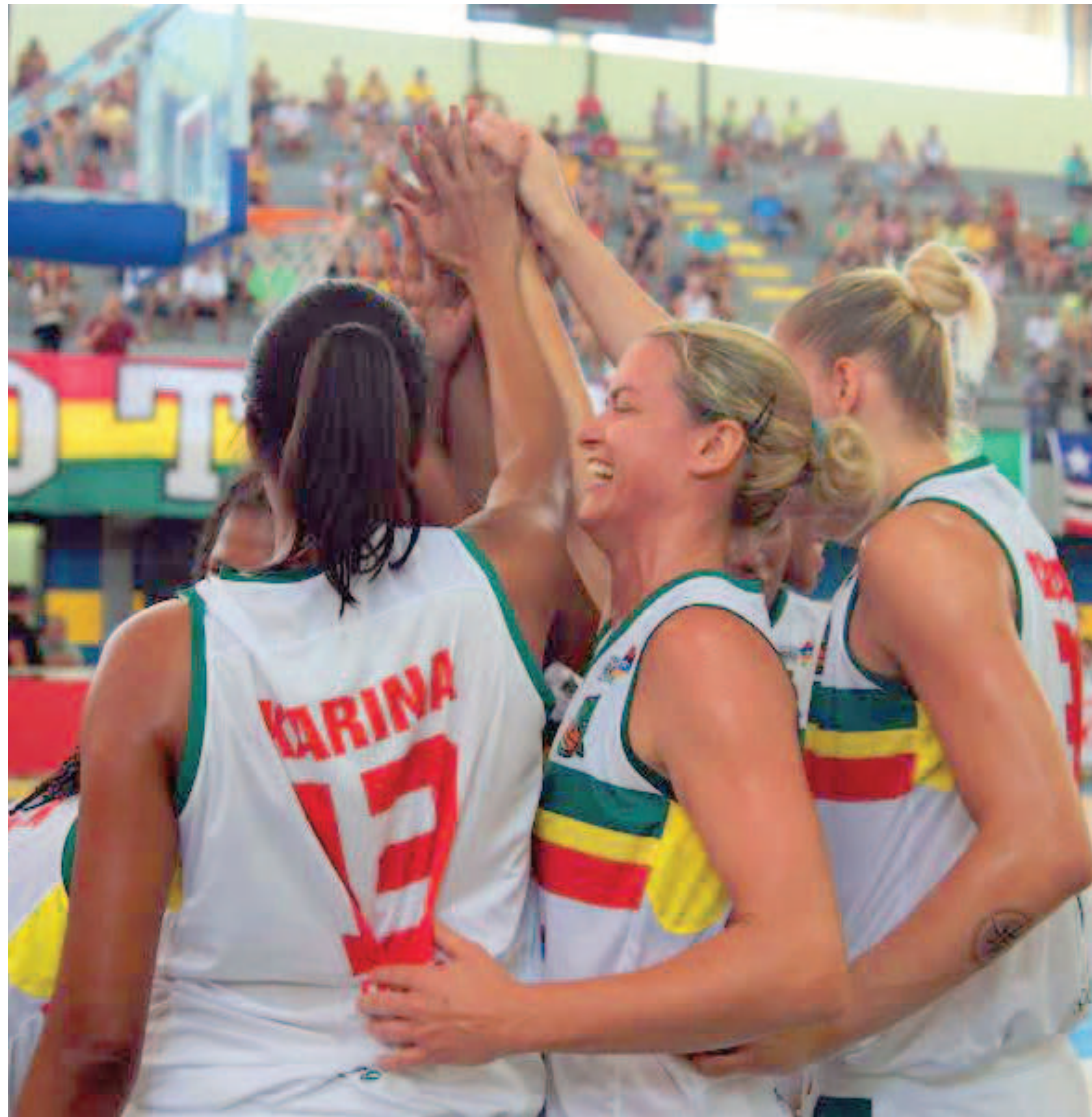
Este pode ser mais um gesto a ser repetido pelas meninas do basquete tricolor, no jogo desta noite

A última vez que jogo fora de casa foi no dia 22 de dezembro do ano passado. Na ocasião, o time maranhense derrotou o Santo André por 82 a 63. O único tropeço do Sampaio Corrêa Basquete nesta edição da LBF