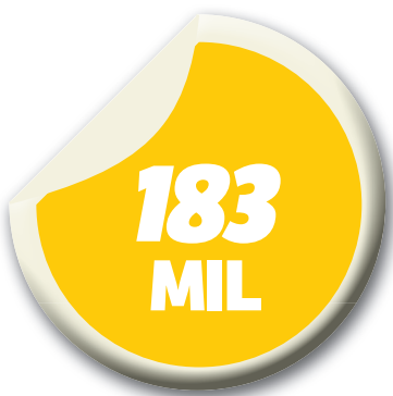
páginas do pedido de afastamento indicam vários "crimes de natureza grave"

"Eduardo Cunha tem adotado, há muito, posicionamentos absolutamente incompatíveis com o devido processo legal, valendo-se de sua prerrogativa de presidente da Câmara dos Deputados unicamente com o propósito de autoproteção mediante ações espúrias para evitar a apuração de sua conduta, tanto na esfera penal como na esfera política", escreveu Janot na peça.