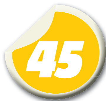
Total de colaboradores que atuam no projeto

Na primeira edição, a Caravana será realizada nos municípios de Alcântara, Alto Parnaíba, Amapá do Maranhão, Anajatuba, Arari, Bacabeira, Bacuri, Balsas, Bequimão, Buriticupu, Carutapera, Cururupu, Caxias, Edson Lobão, Paço do Lumiar, Parnaíba, Porto Franco, Presidente Dutra, Tuntum e Vargem Grande.