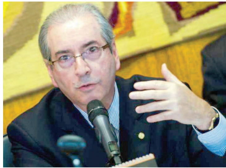
Cunha foi notificado para se manifestar sobre afastamento do cargo

O pedido foi protocolado em 16 de dezembro no gabinete do ministro Teori Zavascki, relator da Operação Lava-Jato no Supremo Tribunal Federal, e deve ser analisado em plenário pelos 11 ministros do tribunal.