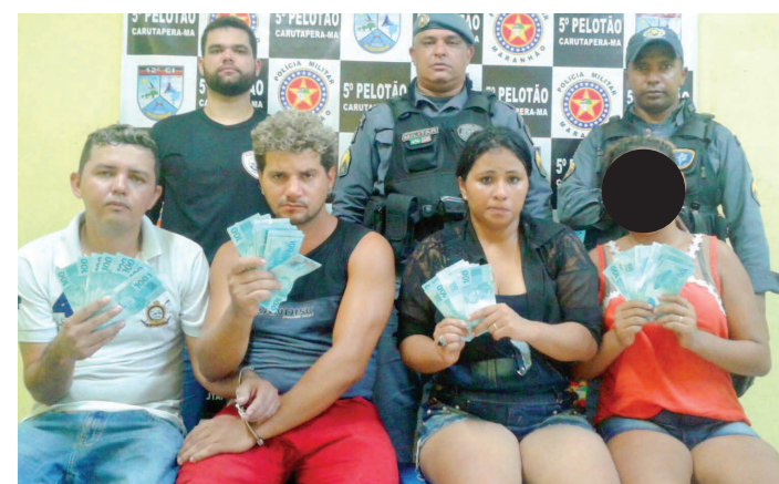
Os suspeitos estavam fazendo pequenas compras com notas de R$ 100