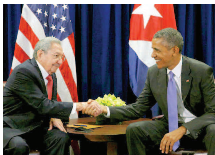
Após aproximação, a relação entre os países vem mudando a cada dia

Os governos de Cuba e dos Estados Unidos (EUA) firmaram ontem um acordo que permitirá a retomada de voos comerciais entre as duas nações, informou o Departamento de Transportes norte-americano. O acordo foi assinado pelos secretários dos Transportes dos EUA, Anthony Foxx, e de Cuba, Adel Yzquierdo Rodriguez, em um hotel em Havana.