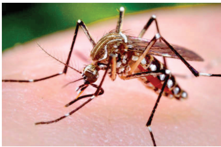
Os projetos serão gerenciados pelo programa de pesquisas da UE

O dinheiro será gerenciado pelo programa de pesquisas da União Europeia, denominado Horizonte 2020.