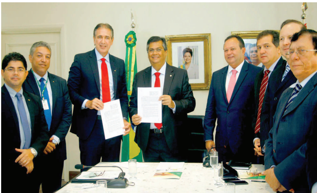
Governador Flávio Dino firma parceria com o Banco da Amazônia para investimento em produção

O governador Flávio Dino destacou que o Governo do estado tem um firme trabalho com as cadeias produtivas. Entre as decisões, a disposição de recursos públicos específicos para que os produtores se sintam apoiados. "Entendemos que o passo que podemos dar para a reorganização da economia do Maranhão depende da ampliação de crédito. Por isso, valorizamos essa parceria com o Basa", afirmou.