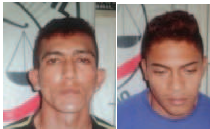
“Cafuringa” e Sabino foram sequestrados de delegacia e executados