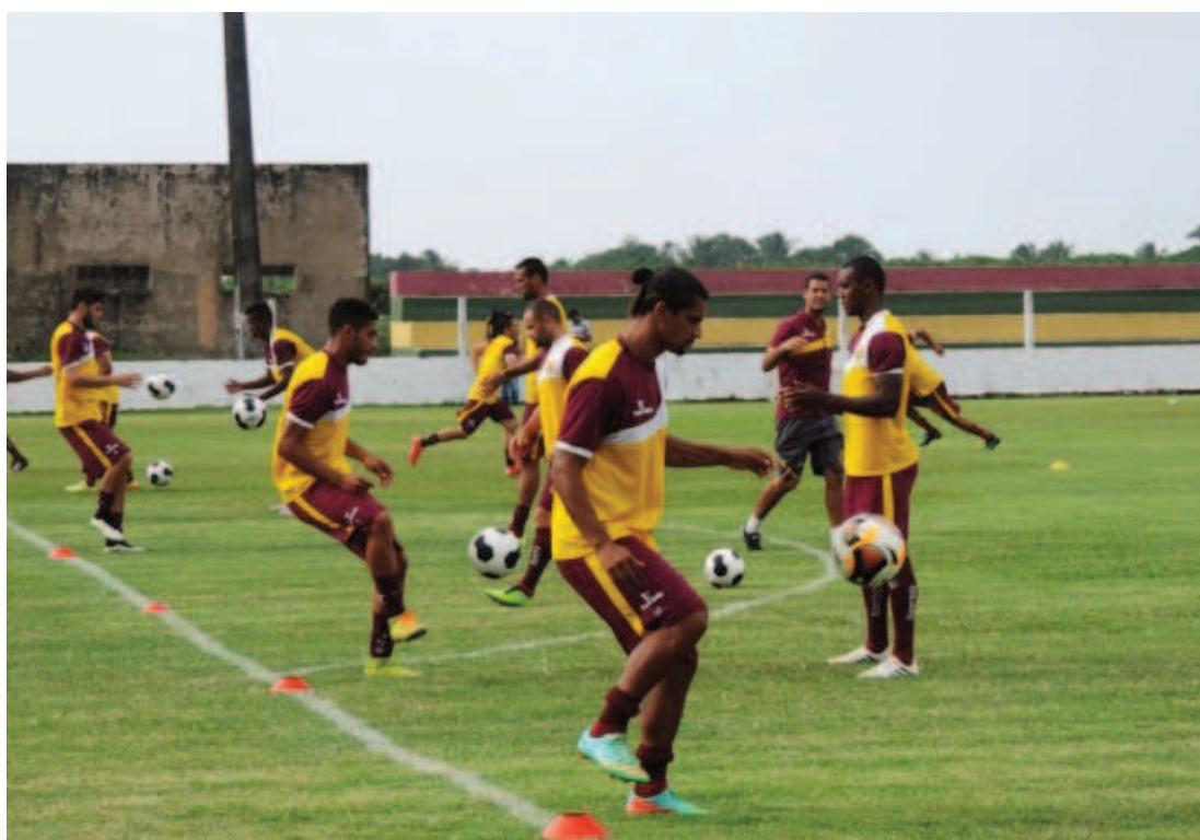
Time do Sampaio treinou com bola visando ao importante duelo de hoje contra o Vitória da Conquista-BA