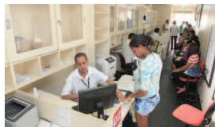
Unidade móvel do Viva Cidadão realiza atendimento à população