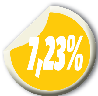
Varição registrada em São Luís