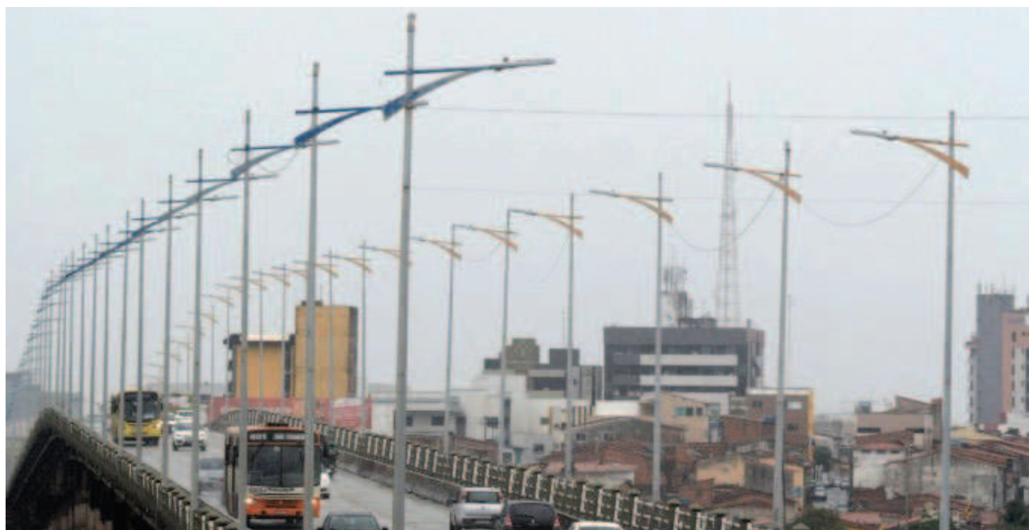
O fenômeno El Niño tem causado a falta de chuvas em São Luís, resultando no forte calor registrado na cidade no mês de fevereiro

Impulsionar as cadeias produtivas maranhenses do agronegócio, indústria e serviços, por meio da concessão de crédito e assistência técnica permanente. Esse é o objetivo do Protocolo de Intenções assinado entre o Governo do Estado e o Banco da Amazônia (Basa), nesta terça-feira, 16, no Palácio dos Leões, em São Luís. URBANO 2