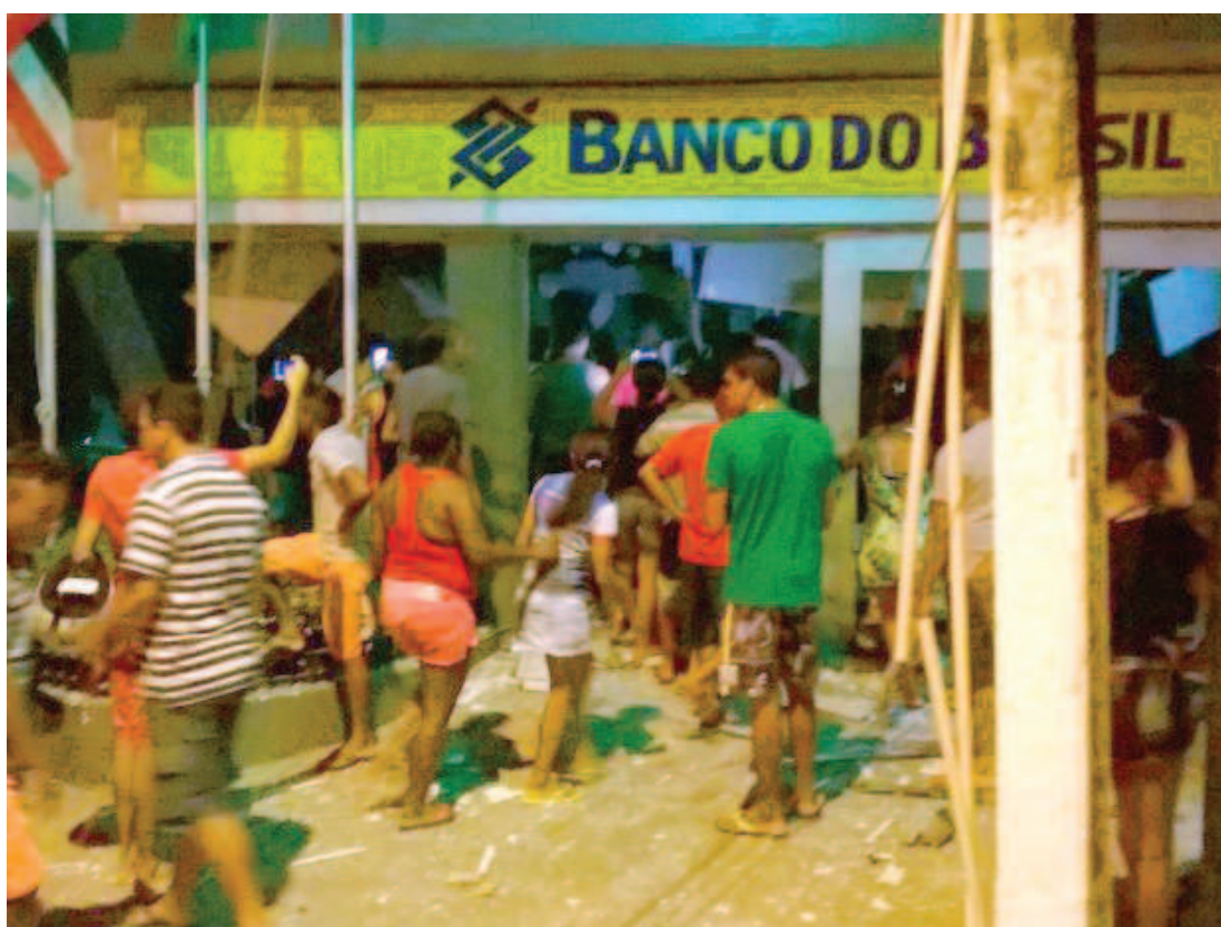
Agência do Banco do Brasil do município de Colinas ficou destruída após ação do grupo criminoso

O comandante-geral da Polícia Militar do Maranhão lidera de perto o trabalho dos policiais militares na operação de busca e captura desde ontem. “Reforçamos o patrulhamento em toda a cidade e na região. Equipes do Cosar e do CTA já estão na região empenhadas em localizar e prender os envolvidos nessa ação criminosa na cidade de Colinas. Os Batalhões e Companhias Independentes também estão integrados na operação de captura dos assaltantes. Não daremos trégua a nenhum criminoso e daremos uma resposta à sociedade”, disse o coronel Frederico Pereira, comandante-geral da Polícia Militar.