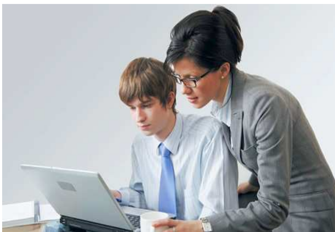
O Núcleo Brasileiro de Estágio estima que sejam ofertadas 31 mil novas vagas no primeiro trimestre de 2016