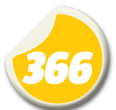
Número de dias do ano bissexto

Elas contou que os amigos sempre lembram. Hoje até o Facebook lembra no dia 28. Contudo, ela diz que gostaria de ter nascido em uma data comum, onde pudesse ter no calendário todos os anos a data do seu aniversário.