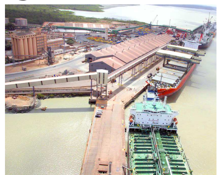
Porto do Itaqui é um dos maiores em produção do Brasil