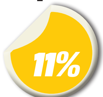
Crescimento da satisfação com o Porto em 2015

A realização da Pesquisa de Satisfação do Cliente (PSC) atende a norma ISO 9001:2008, voltada à Gestão da Qualidade, que exige o monitoramento das infor-