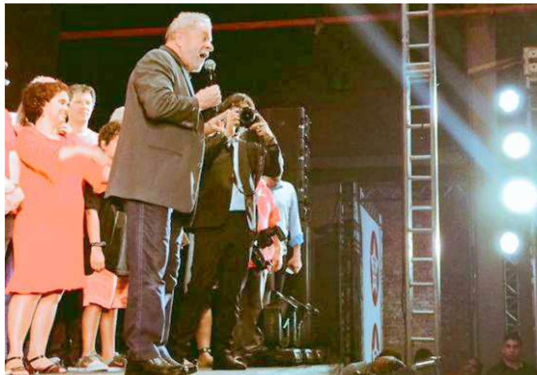
Lula foi o grande homenageado da festa de 36 anos do PT, no Armazém da Utopia, no Rio de Janeiro