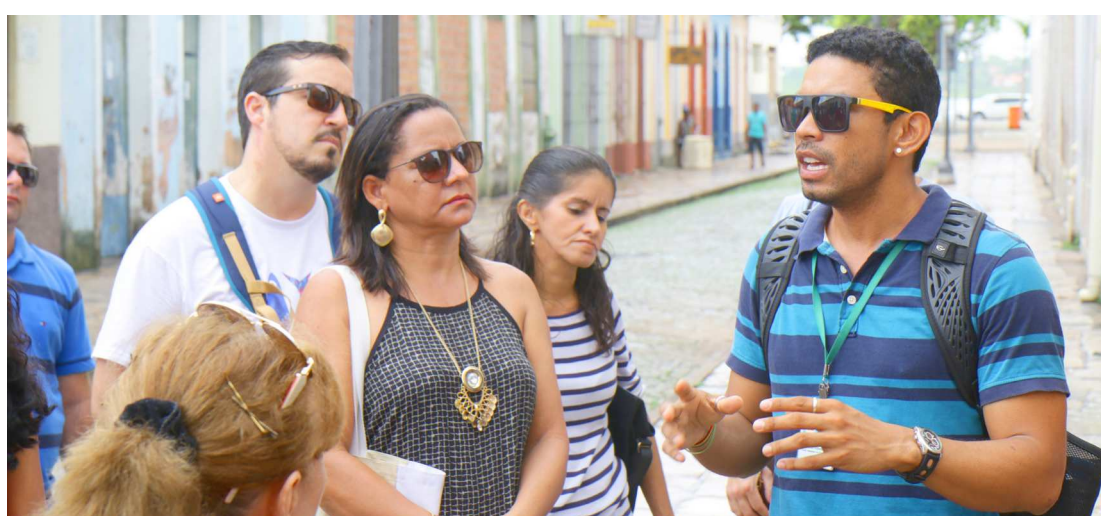
Um dos guias do município passa informações para os participantes da visita técnica nos pontos históricos

A segunda são as visitas técnicas a lugares da cidade que tenham relevância histórica, social e cultural, promovendo assim, um maior conhecimento sobre o processo de ocupação, a expansão e a formação de outros núcleos urbanos de São Luís. Os roteiros do Caminhos da Memória estão publicados em um livreto, material utilizado como apoio pedagógico nestas ações.