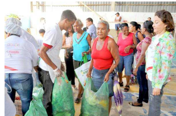
Prefeitura mantém o programa de aquisição de alimentos na Ilha