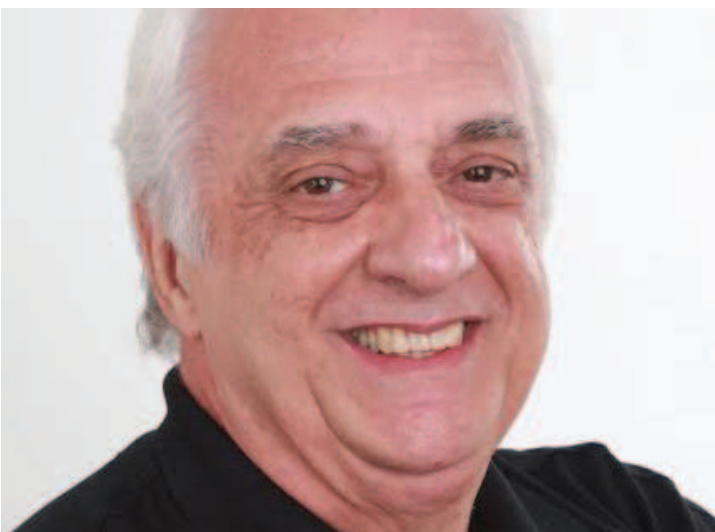
Barbosa profere palestra hoje pela manhã na Universidade Ceuma

O Sampaio Corrêa Basquete, que faz boa campanha nesta competição, tem o apoio do governo do estado do Maranhão, por meio da Secretaria de Estado do Esporte e Lazer (Sedel), e patrocínio da Companhia Energética (Cemar).