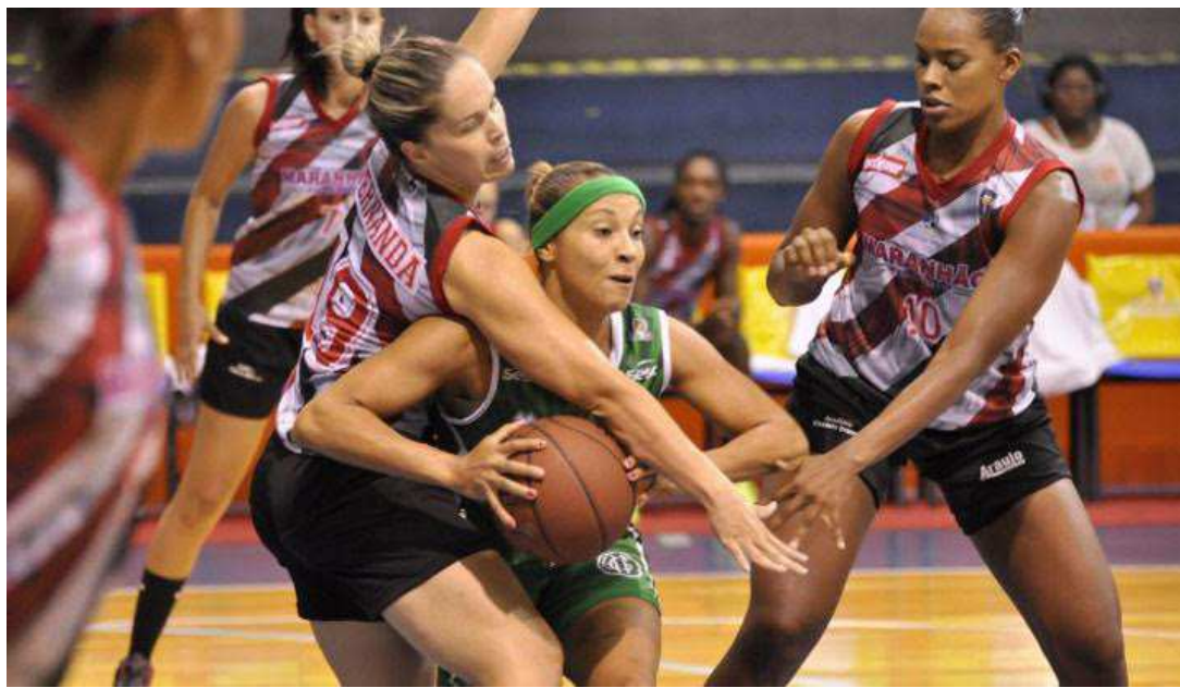
Meninas do Maranhão Basquete têm jogo muito importante na manhã de hoje, no Ginásio Castelinho