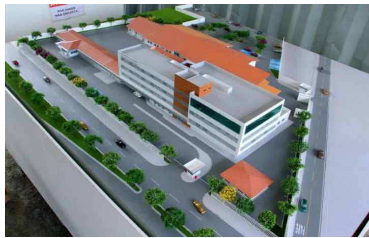
Hospital da Criança deve atender cerca de 10 mil crianças por mês

Segundo números da Secretaria Municipal de Saúde (Semus), somente no mês de fevereiro deste ano foram atendidas na emergência do Hospital da Criança 5.129 pacientes, sendo que foram realizados 10.050 exames laboratoriais, 1.263 radiografias e 62 ultrassons. A média de crianças