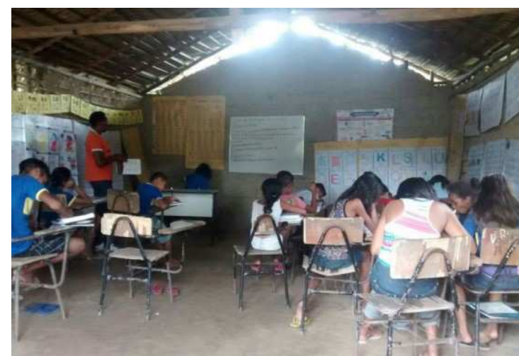
Interior da escola municipal de Peritoró com séries misturadas

"Para nossa surpresa, essa pessoa de maneira irresponsável, sem o conhecimento da Secretaria de Educação, orientado por políticos de oposição, levou as crianças para um case-