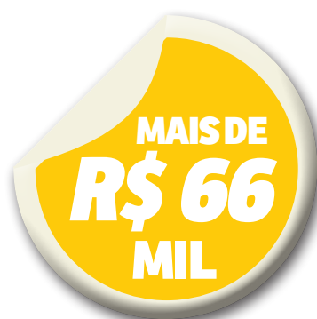
Valor recebido por Peritoró em março de 2016

De acordo com informações do Fundo Nacional de Desenvolvimento da Educação (FNDE), somente no mês de março de 2016, o município de Peritoró recebeu o montante de R$ 66.906 destinado ao Programa Nacional de Alimentação Escolar (Pnae), que visa oferecer alimentação escolar aos alunos da educação básica (educação infantil, ensino fundamental, ensino médio e educação de jovens e adultos). No ano de 2015, o governo federal repassou à Prefeitura de Peritoró o valor de R$ 757.940 para aquisição de merenda escolar.