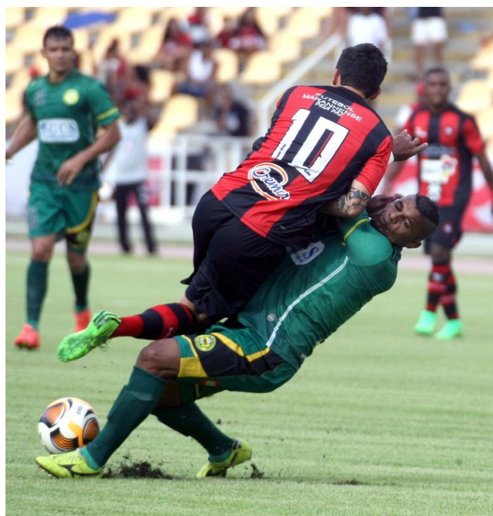
Após passar pelo Cordino, Moto também tem vantagem sobre o MAC