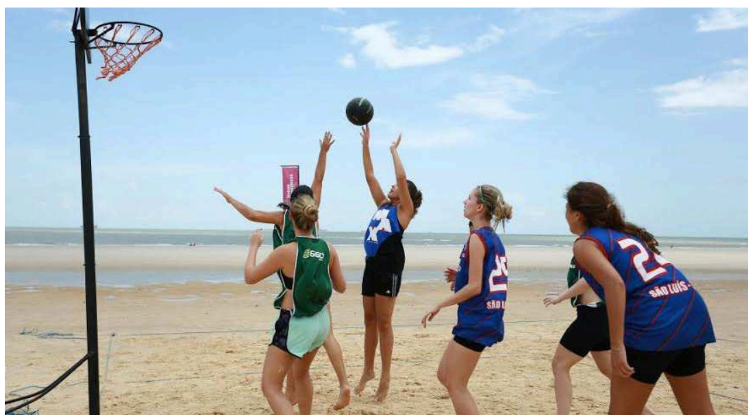
Muitos esportes estão sendo praticados nas praias de São Luís nesta edição dos Jogos Maranhenses de Verão

Patrocinado pela Oi, os Jogos Maranhenses de Verão 2016 deste final de semana contará com mais evento diferenciado: a Trail Running. A corrida com circuito de 5Km traz desafios a serem superados na areia da