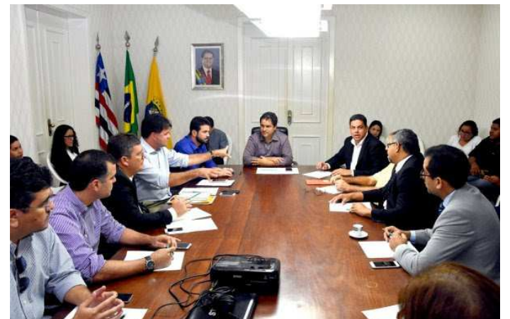
Reunião entre prefeitos de São Luís e São José definiu ações