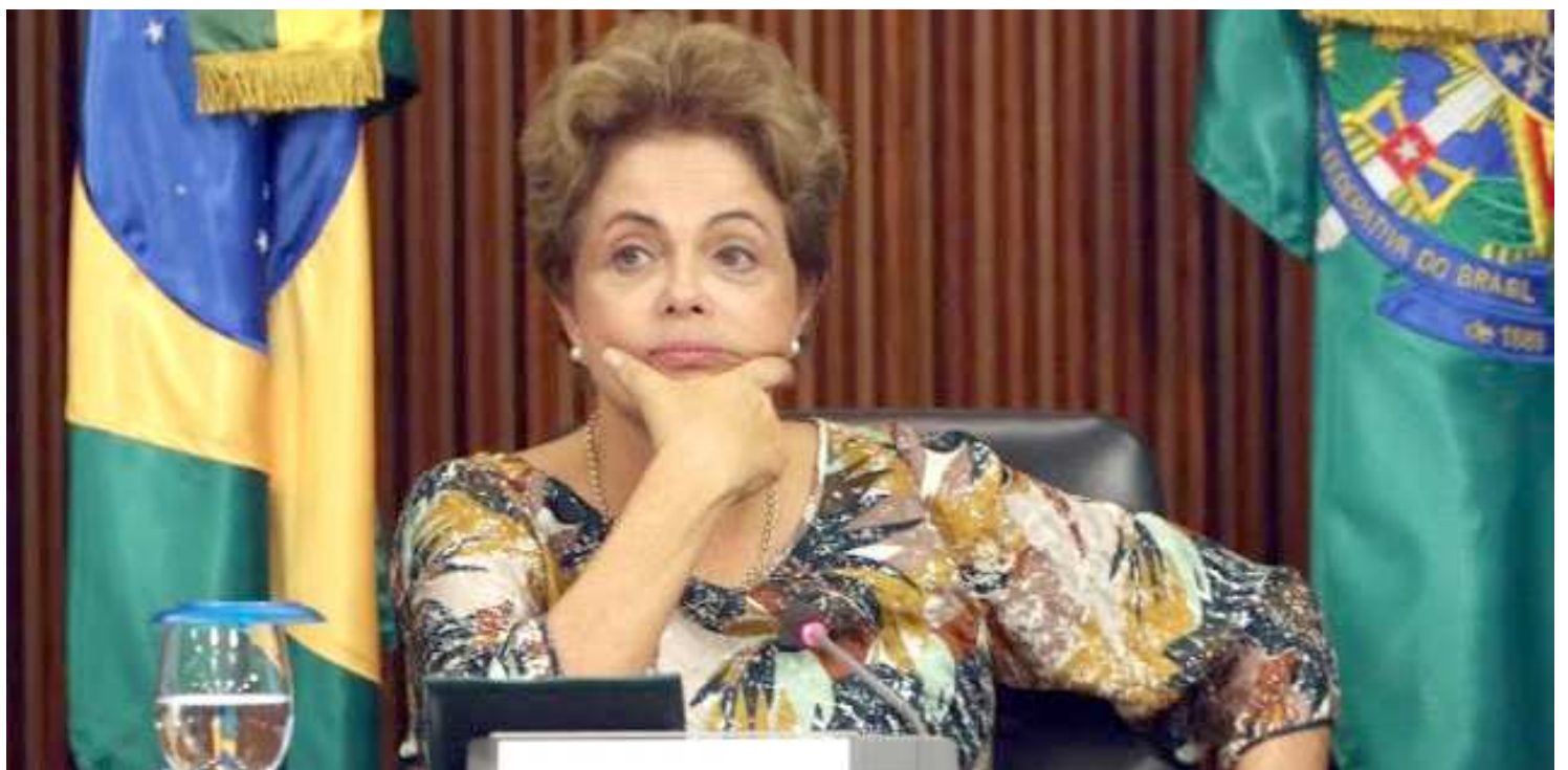
Sobre as manifestações populares previstas amanhã, Dilma Rousseff “apelo às pessoas para que sejam capazes de manifestar de forma pacífica”

Perguntada se vai pedir para ele ficar no cargo, Dilma respondeu: “Eu vou olhar para ele e falar: olha, meu querido, você decida o seu destino de acordo com as suas convicções e aquilo que lhe é interessante. Ele tem 25 anos de Ministério Público, e não cabe a mim fazer nenhum apelo. Eu não posso prejudicar ninguém.”