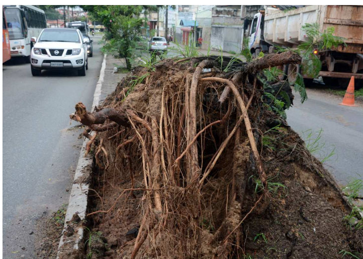
Árvore não resistiu às chuvas e tombou na Avenida Getúlio Vargas