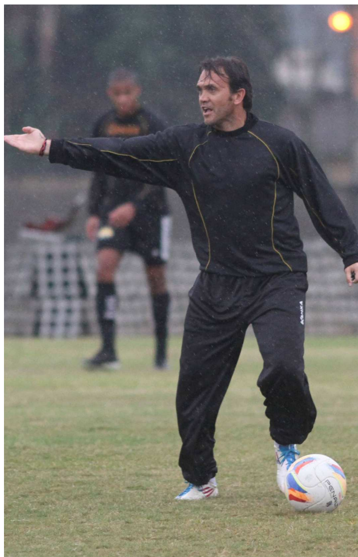
Petkovic está entre os mais cotados para ser o técnico do Sampaio Corrêa