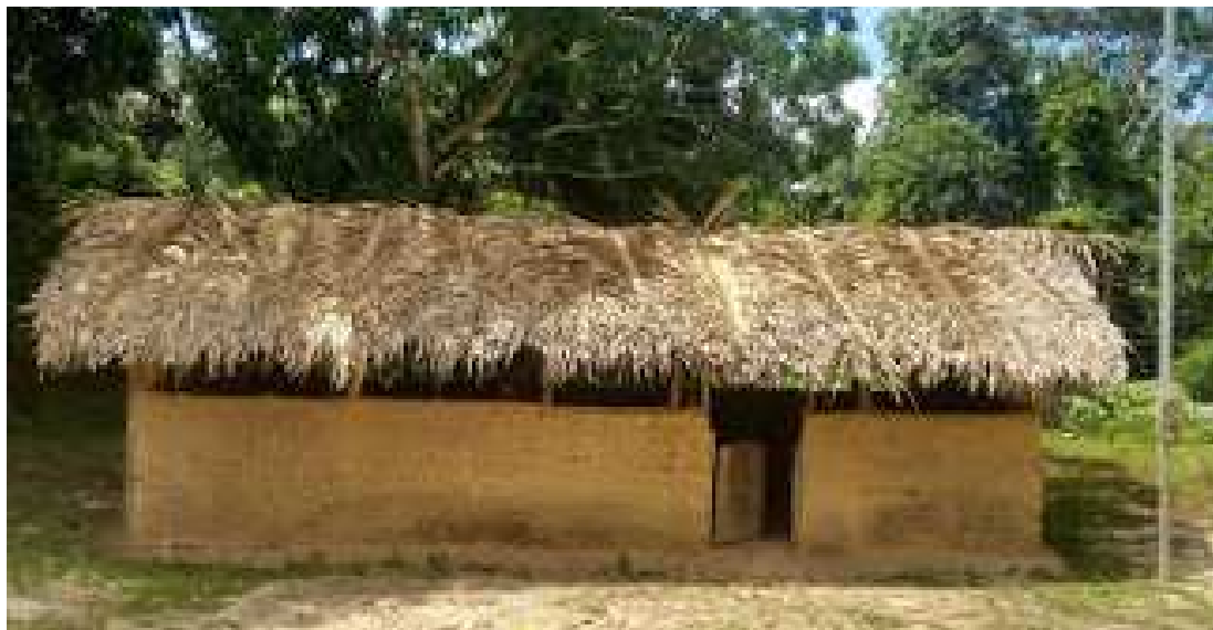
Alunos reclamam que escola municipal de Peritoró não tem nenhuma condição de receber as aulas

De acordo com o deputado, a escola, onde estudam 40 crianças, não tem água, carteiras, filtros, banheiros e merenda escolar; situação é grave e o desespero é grande tanto por parte dos pais e professores, quanto dos alunos que lá estudam.