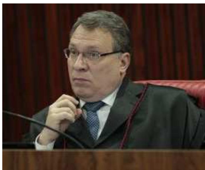
Eugênio José Guilherme de Aragão é subprocurador-geral da República

mo Tribunal Federal decidiu que Wellington deveria pedir exoneração do cargo de promotor de Justiça do Ministério Público da Bahia, caso quisesse permanecer no cargo. A decisão foi tomada após questionamento feito à Corte sobre a impossibilidade de membros do Ministério