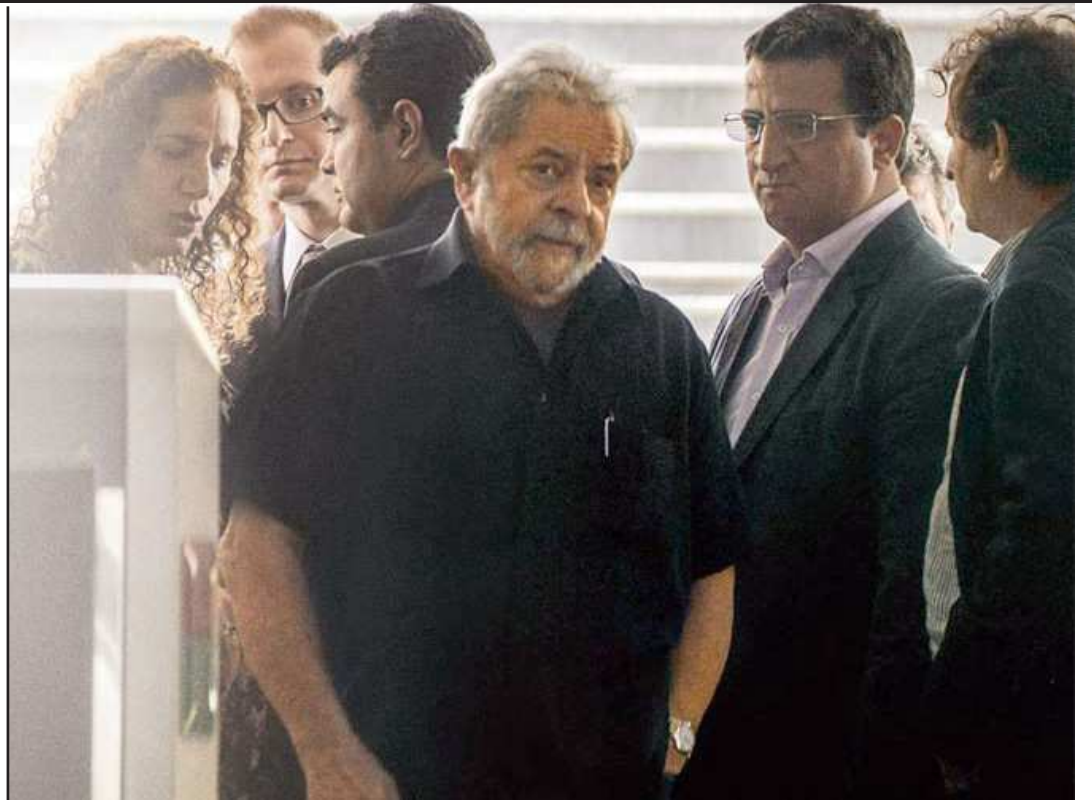
Imagem de Lula quando recebeu o mandado de condução coercitiva

Em um momento de irritação, Lula afirmou que “é possível” que o presidente do Instituto Lula, Paulo Okamoto, ou a ex-assessora Clara Ant, que integra a diretoria da entidade, tenha pedido doações a empreiteiras. “A todas, todas, todas”, resumiu Lula quando indagado.