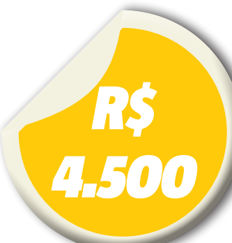
Limite de variação dos salários

Este Processo Seletivo Público será um ano, a contar da data da publicação da homologação de seu resultado final, podendo ser prorrogado, uma vez, por igual período.