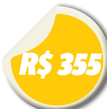
Valor da cesta básica em São Luís

O preço da batata diminuiu em dez capitais do Centro-Sul, menos em Florianópolis, onde o aumento foi de 0,55%. As quedas principais foram registradas em Vitória (-22,00%), Campo Grande (19,96%) e Brasília (-18,12%). O tomate apresentou queda em 18 das 27 cidades pesquisadas, com variação entre -43,49%, em Vitória, e -1,20%, em Rio Branco. Nove ci-