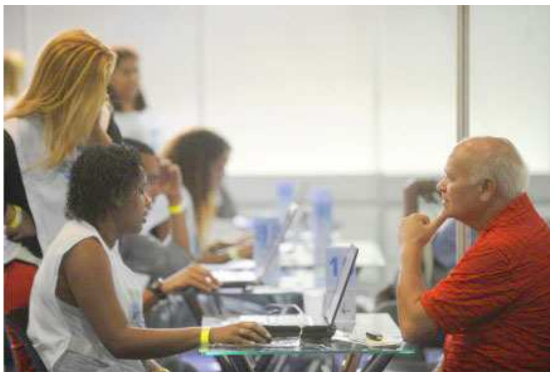
Os níveis de confiança continuam impedindo a procura por crédito em todo o país, aponta Serasa

De acordo com os economistas da Serasa Experian, o aprofundamento da recessão econômica, o nível elevado das taxas de juros e o patamar deprimido dos níveis de confiança do consumidor continuam impedindo um desempenho mais favorável da procura dos consumidores por crédito no