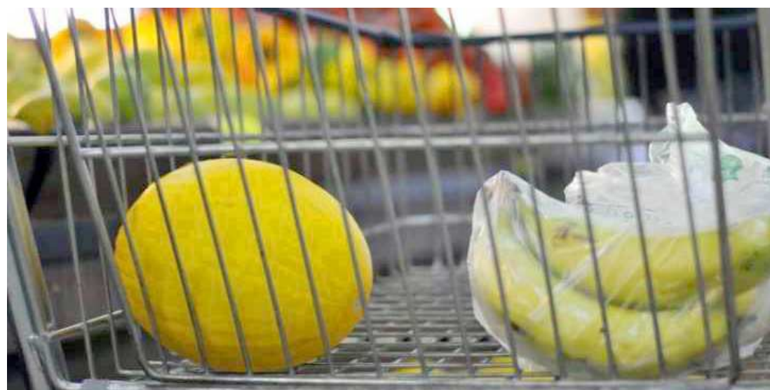
Em São Luís, a cesta básica teve um aumento de 1,17% em fevereiro

Em fevereiro, a maioria dos preços dos produtos da cesta aumentou. Todas as capitais registraram alta no óleo de soja, com variações oscilando entre 1,54%, em