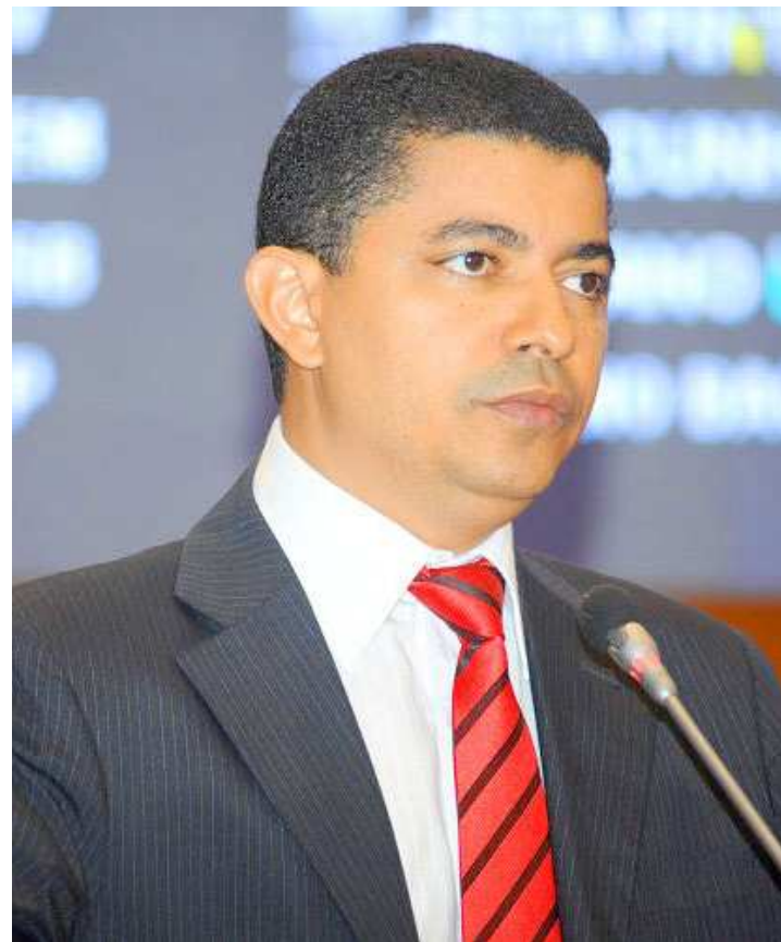
Para o partido, Bira do Pindaré tem amplas chances de ganhar as eleições

Os militantes do partido fizeram questão de frisar que o compromisso com Bira foi firmado diante do presidente nacional do PSB, Carlos Siqueira, durante visita dele ao estado. “Na presença