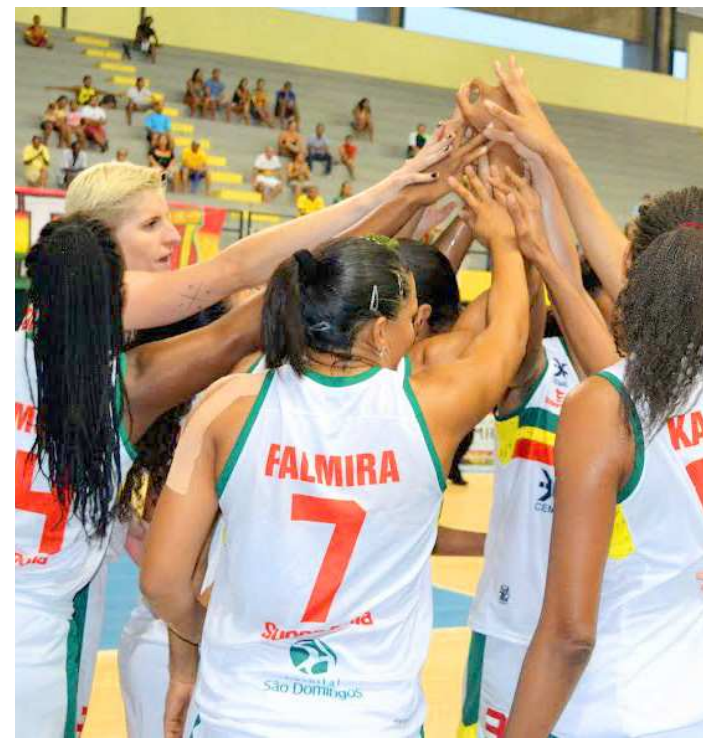
Meninas do Sampaio Basquete precisam vencer a qualquer custo