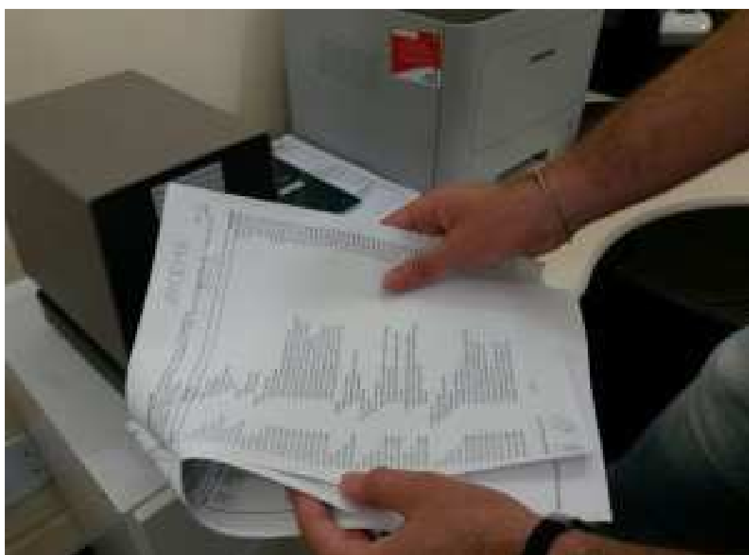
A chancela eletrônica é mais um mecanismo para dar segurança aos documentos, pois é criptografado

A chancela será impressa no documento físico, e depois de digitalizado será inserida uma assinatura digital da Junta Comercial. Assim, quando o cliente for ao site ele poderá verificar