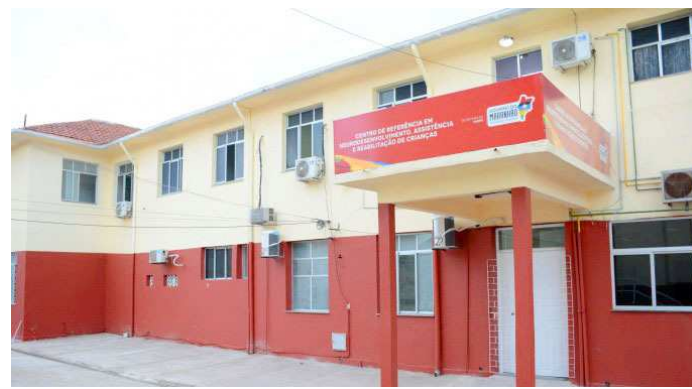
Centro de tratamento irá funcionar em hospital no Centro da cidade

O Ninar possui sete consultórios e duas salas de acolhimento, além de espaços para reabilitação em fisioterapia, fonoaudiologia e terapia ocupacional.