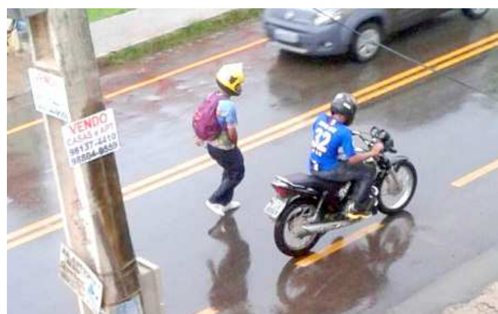
Bandidos foram flagrados por testemunhas após espancarem o policial

Na ação, os bandidos espancaram o policial com capacete, socos e pontapés, tentando roubar o celular da vítima.