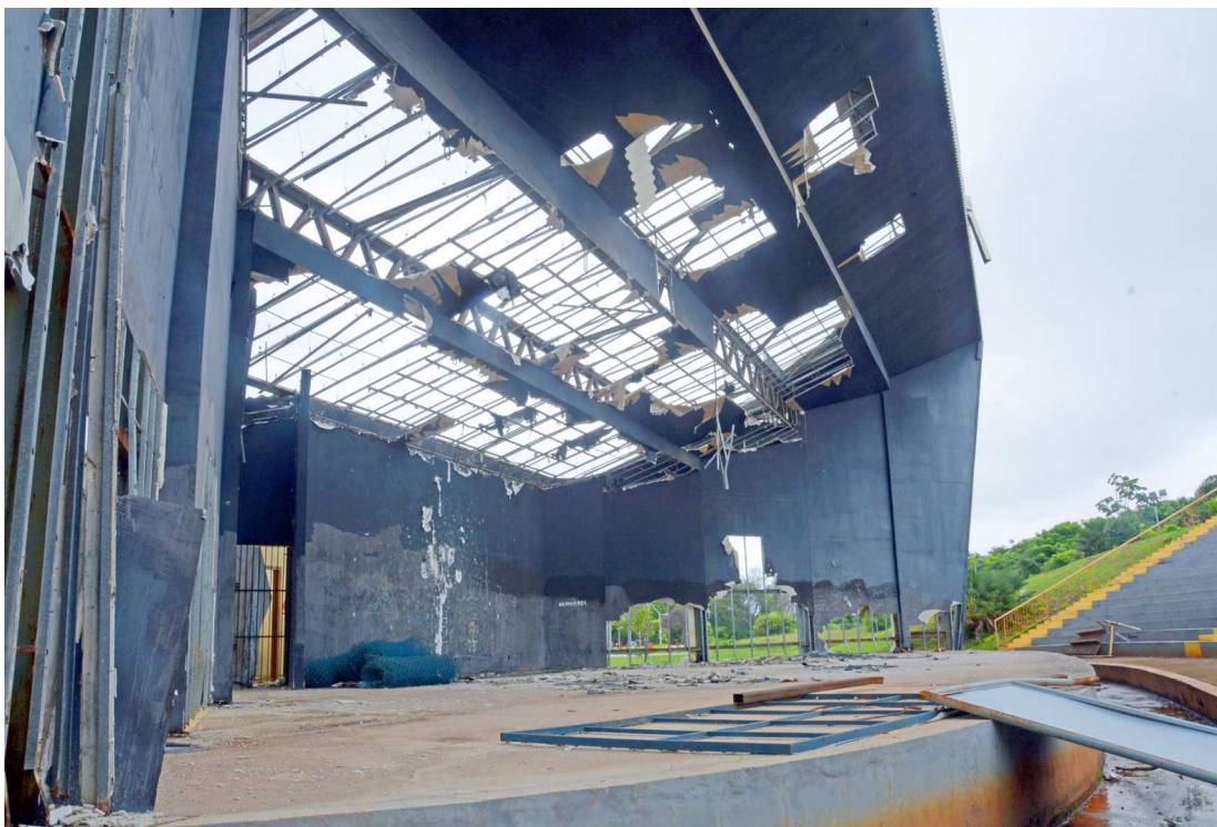
Concha Acústica da Lagoa da Jansen está em condições precárias e completamente depredada

De acordo com a Secretaria de Estado de Meio Ambiente e Recursos Naturais (Sema), existe um projeto de recuperação que já está em fase de elaboração.