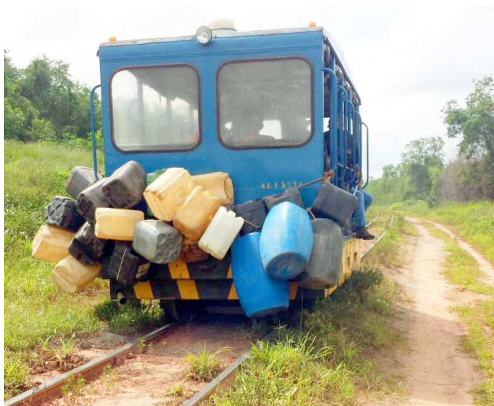
Dois suspeitos da quadrilha foram presos no local onde estavam vários recipientes com combustível

Durante a operação foram presos Chirlene da Con-