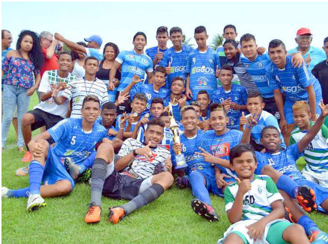
Com essa garotada, o time do Afasca conquistou a primeira etapa da Copa e se garantiu na fase final da disputa

Apesar de ter ficado com o vice-campeonato da etapa, o Olímpicos também está classificado para a fase final da Copa Maranhão de Futebol Sub-17. Desta primeira etapa, os times do Sampaio e Comercial, que foram eliminados nas semifinais, também estão garantidos na fase final do torneio.