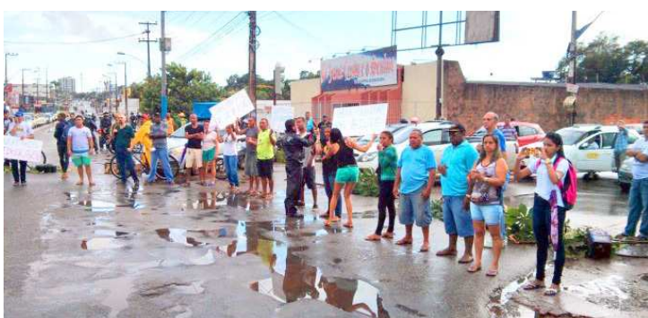
Manifestantes ocuparam a Avenida São Luís Rei de França, no Turu