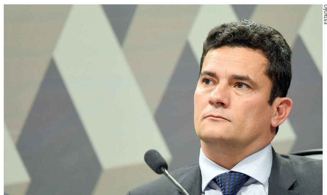
O processo passará a integrar o conjunto sob responsabilidade do juiz Sérgio Moro, da Operação na Lava-jato