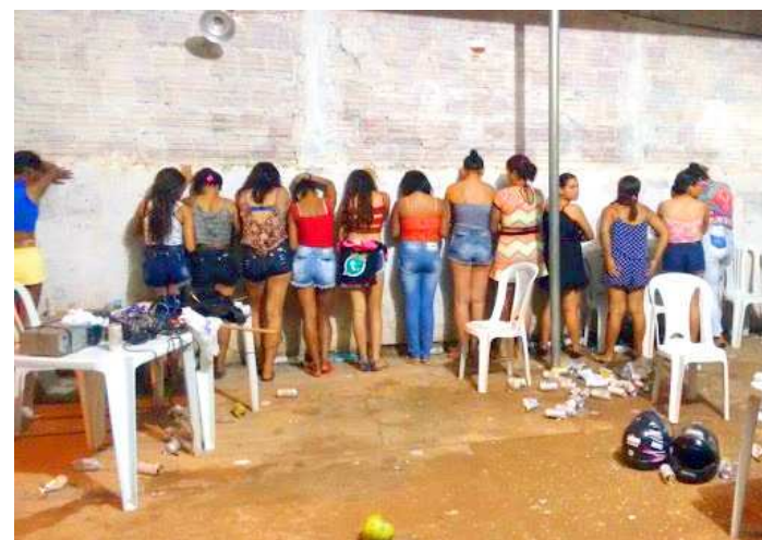
Policiais apreenderam armas durante festa no Parque das Estrelas