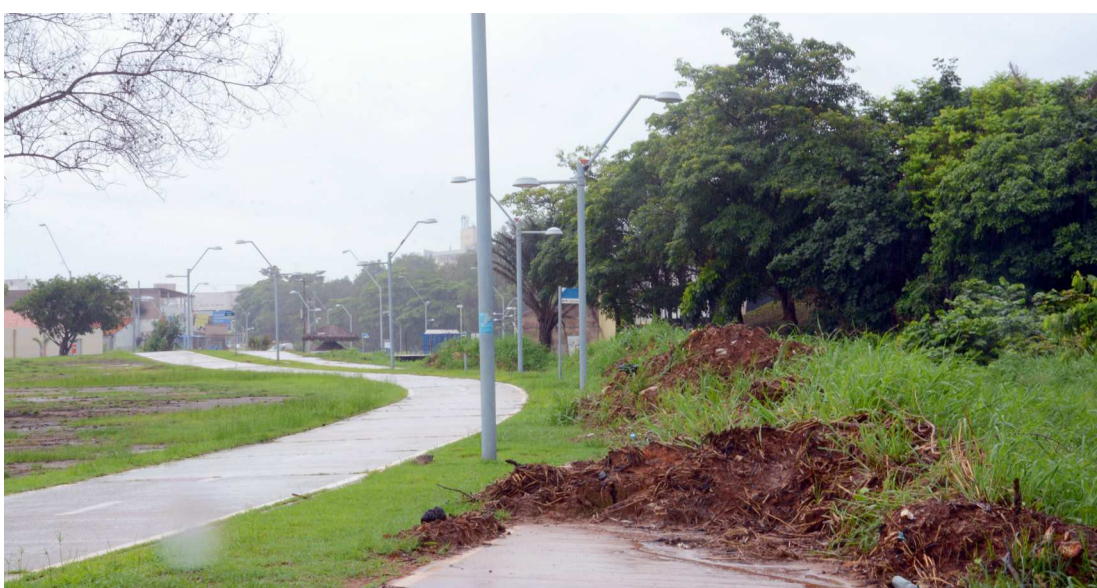
Acúmulo de entulhos e buracos tem atrapalhado a caminhada dos moradores da Lagoa da Jansen

Trata-se do projeto de reforma de Concha Acústica da Lagoa da Jansen. A obra deverá ser licitada até o final de março de 2016.