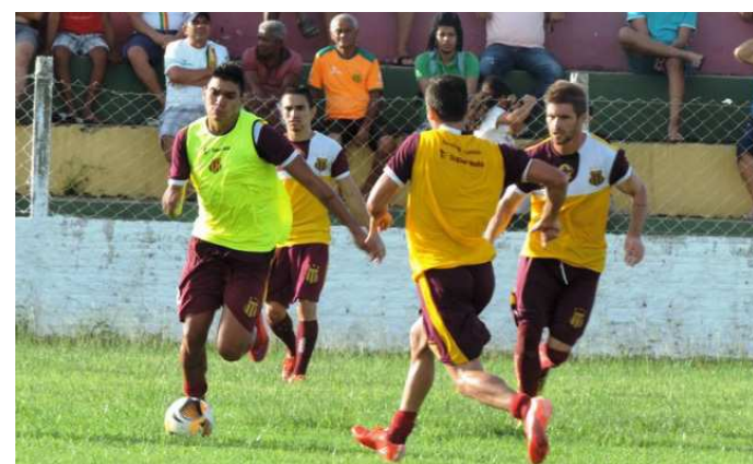
SITE DO SAMPAIO CORRÊA