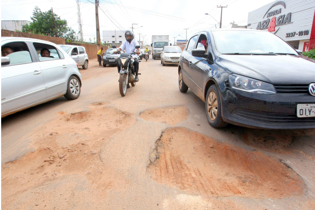
Para amenizar situação, equipes da Sinfra estão realizando serviços emergenciais de tapa-buracos