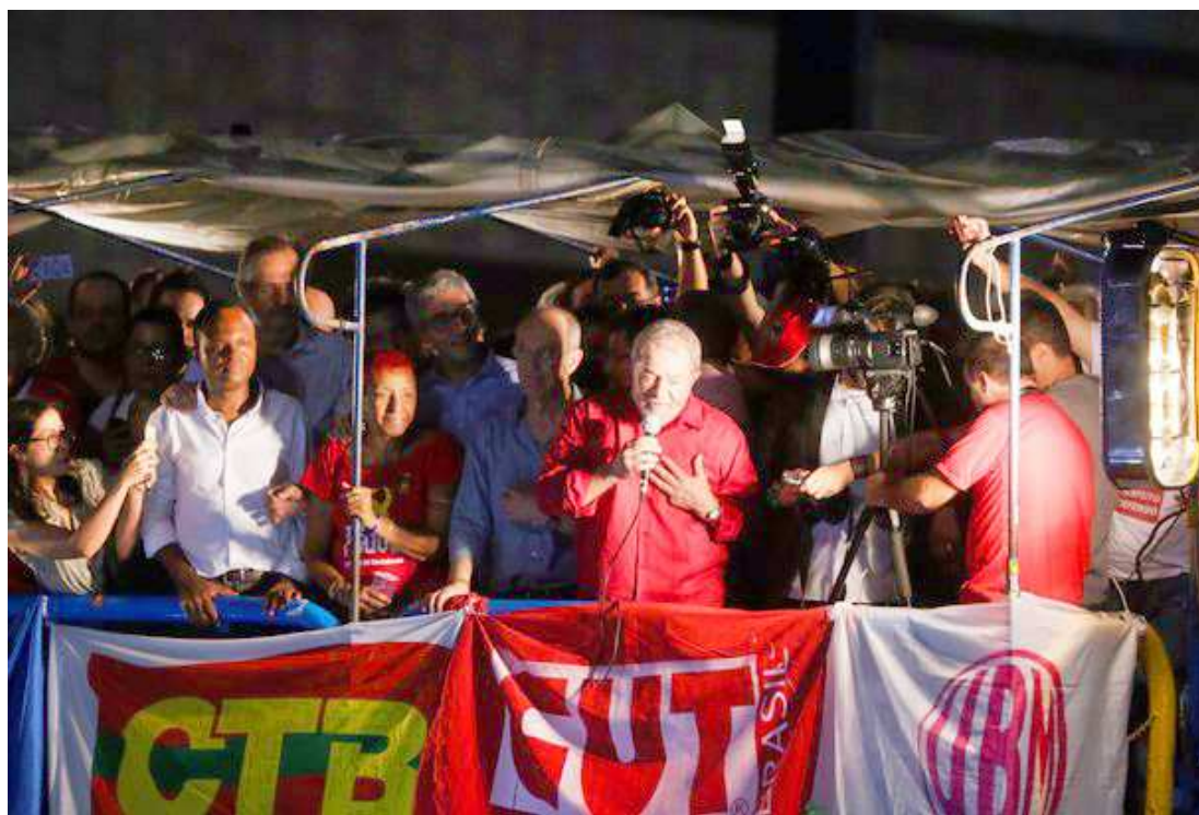
Lula voltou a discursar na Avenida Paulista quase 14 anos depois, quando foi eleito presidente em 2002

A CUT, organizadora do protesto, estima em 250 mil pessoas na Paulista no início da noite de ontem. A PM ainda não divulgou estimativa de público. O ato começou às 16h. No pico da manifestação, 11