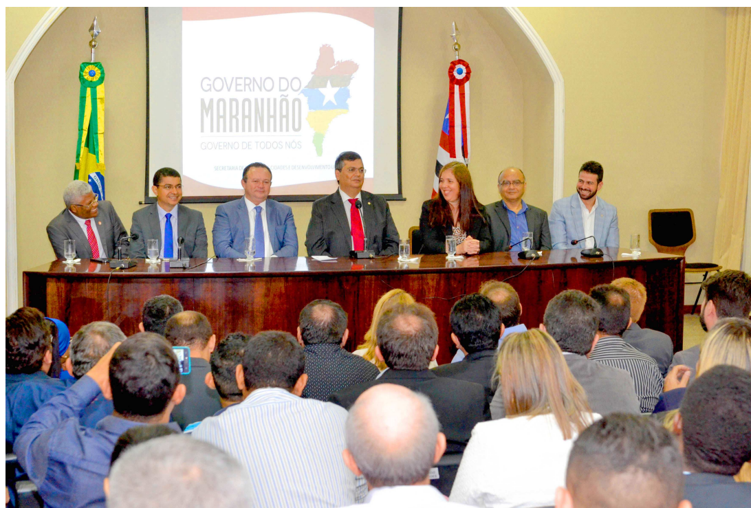
A assinatura para a construção do espaço cultural foi realizada ontem pelo governador do estado, Flávio Dino

"Essa região à margem esquerda do rio Anil é habitada por comunidades quilombolas que vieram para São Luís e é para esse povo que está sen-