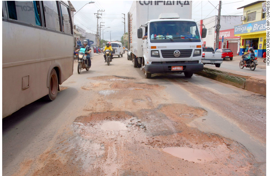
Outra medida que está sendo tomada para dar maior fluidez ao trânsito é a desobstrução do Rio Paciência