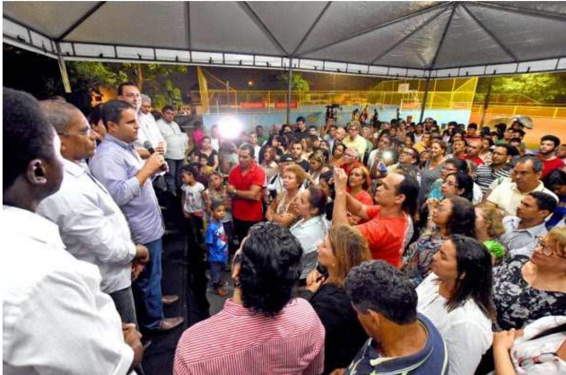
Edivaldo Holanda Júnior entregou o espaço público todo revitalizado para moradores do bairro do Vinhais

Edivaldo falou do ineditismo de ações conjuntas entre Prefeitura e governo do Estado. "Hoje temos um governador parceiro da cidade. A população conta com dois gestores que trabalham com muita responsabilidade e vamos seguir com o ritmo intenso de inaugurações, lançamentos e fiscalizações de obras", ressaltou o prefeito Edivaldo.