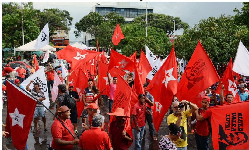
Na capital maranhense, os manifestantes se concentraram na Praça Deodoro

Militantes e representantes de entidades do Partido dos Trabalhadores (PT), Partido Socialista do Brasil (PCdoB), Partido Comunista Brasileiro (PCB), (PDT), Partido Progressista (PP), Partido Geral dos Trabalhadores (PGT), e Central Única dos Trabalhadores (CUT), que, unidos, formam “o conjunto da sociedade contra o golpe”, a favor do governo Dilma Rousseff em um movimento contra o impeachment, realizaram na tarde de ontem mais um ato popular na Praça Deodoro, no Centro de São Luís, para marcar posição de apoio a Dilma e à nomeação do ex-presidente Luiz Inácio Lula da Silva como ministro da Casa Civil.