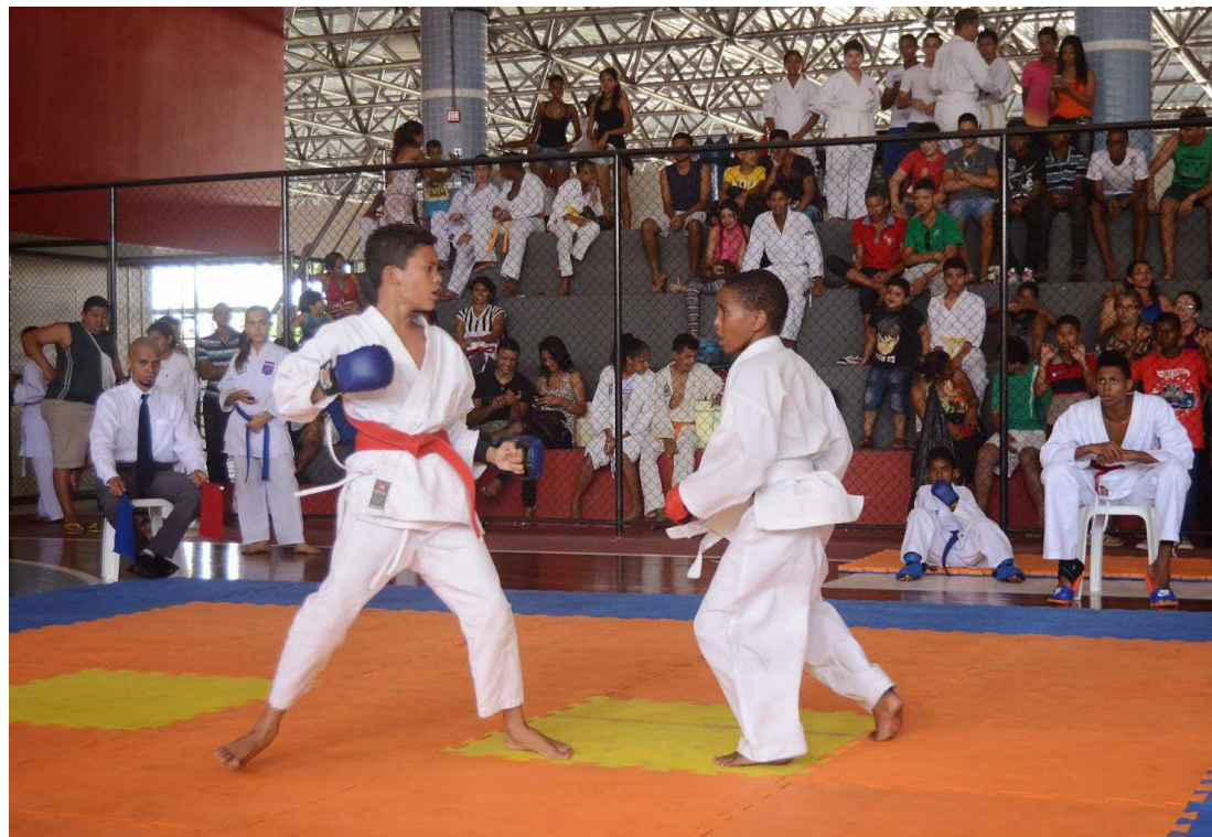
Karatê está entre as modalidades esportivas prestigiadas pelo Serviço Social do Comércio (Sesc) no Maranhão