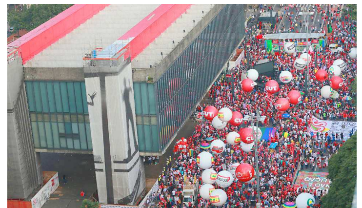
Segundo Datafolha, 95 mil pessoas foram à Avenida Paulista ontem

tações de grupos contrários ao governo e pregou a convivência pacífica. “Precisa entender que democracia é a convivência da diversidade. Não que-