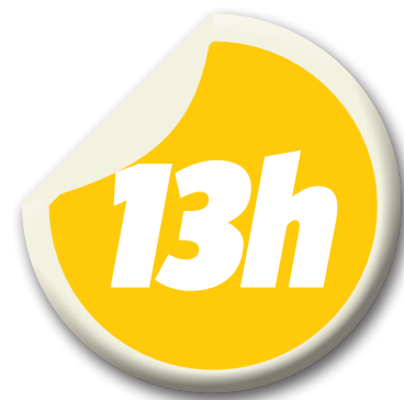
Início das competições de karatê

O Sesc atua nas áreas de saúde, cultura, lazer, educação e assistência. A prática esportiva é um dos segmentos de destaque na instituição e, no quadro de atividades esportivas oferecidas, o karatê é um dos mais antigos. No Sesc Deodoro, crianças a partir de seis anos podem iniciar na modalidade que fortalece o corpo e desenvolve disciplina, paciência e perseverança. As aulas são ministradas todas as terças e quintas com turmas durante todo o dia.