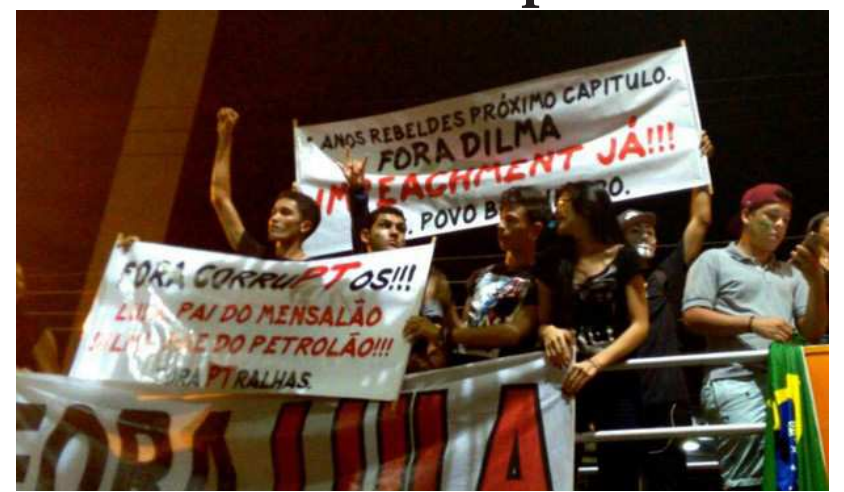
Em Brasília, o movimento foi organizado pela CUT e pela Frente Brasil Popular

Manifestantes a favor do governo Dilma e do PT realizaram ontem um ato no Complexo da República, no início da Esplanada dos Ministérios, em Brasília. O evento “em defesa da democracia, contra o golpe e contra os retrocessos políticos e sociais” foi organizado pela CUT e pela Frente Brasil Popular do DF.