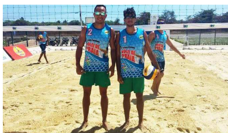
premição para os três primeiros colocados no torneio masculino.