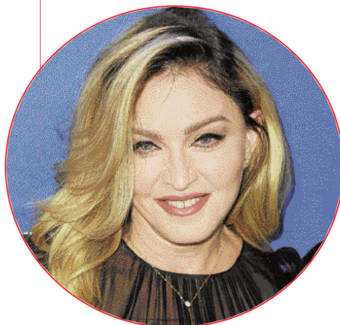
Angela Weiss/AFP - 10/7/16

Um juiz britânico deu por encerrado nessa segunda-feira (20) o processo judicial em Londres pela custódia do filho de 15 anos da cantora americana Madonna e do cineasta inglês Guy Ritchie, divorciados desde 2008. O processo seguirá agora somente em Nova York, nos Estados Unidos. A artista abriu nos Estados Unidos um processo para que seu filho, Rocco, volte a viver com ela, depois que o menino decidiu morar com o pai na capital britânica em dezembro do ano passado. "Se um acordo não for possível hoje, não significa que não possa ser amanhã", manifestou o juiz.