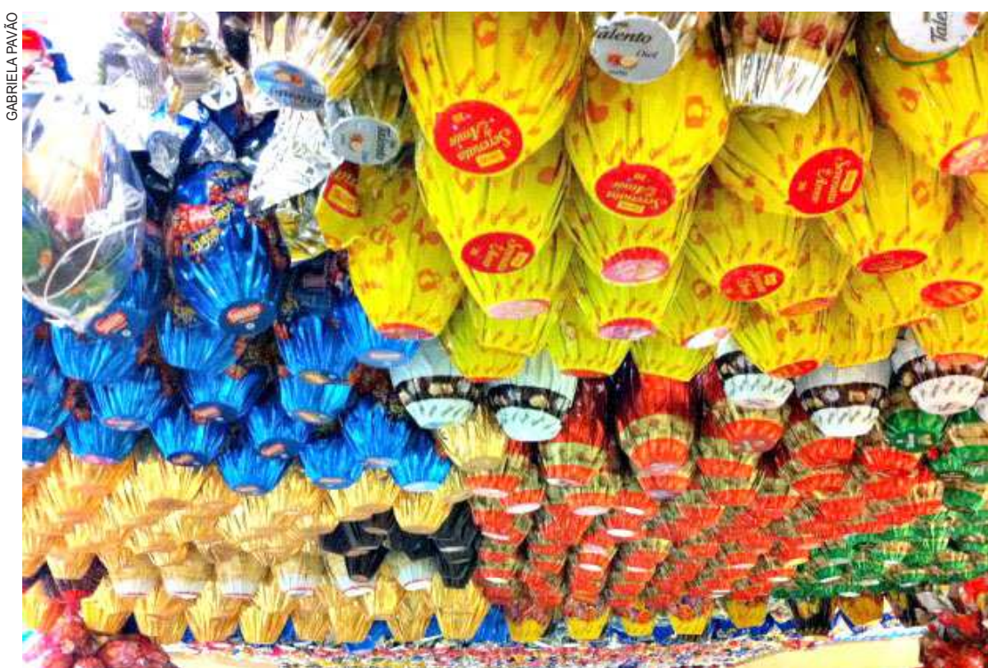
Segundo pesquisa da Boa Vista SCPC, apenas 45% dos consumidores pretendem comprar ovos de Páscoa

A retração dos consumidores para a Páscoa ficou clara também quando se compararam os números deste ano com o levantamento de 2015 da Boa Vista SCPC. A porcentagem dos que pretendem comprar ovos de Páscoa em 2016 é de 45%, ou 15 pontos percentuais abaixo