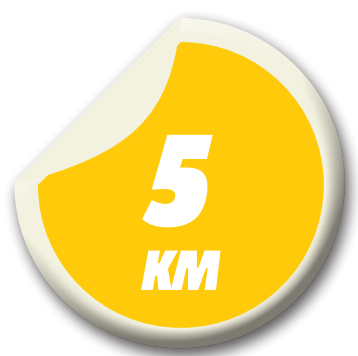
Percurso da prova, na Avenida Litorânea

Além dos campeonatos, teve espaço para algumas modalidades esportivas como o frescobol, slackline, bodyboard, SUP e caiaque, por meio de oficinas com profissionais das áreas. O domingo reuniu muita gente logo cedo pela manhã na Corrida Ol, com mais de 500 atletas dispu-