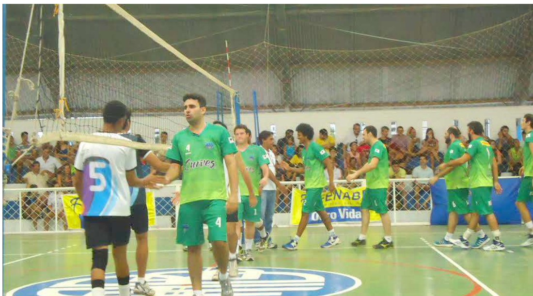
Vôlei de quadra estará bastante movimentado durante a Copa Adulto, nas categorias masculino e feminino

As inscrições para a disputa da Copa de Vôleibol Adulto custam o valor de R$ 500 e serão realizadas no período de 28 a 31 deste mês. O congresso técnico será realizado no dia 31, às 20h, no Colégio Batista no bairro do João Paulo. As equipes que participarem da competição, vão receber duas bolas de vôlei da marca Mikasa. Maiores informações poderão ser obtidas pelos telefones: 98828-7492 e 99112-4359.