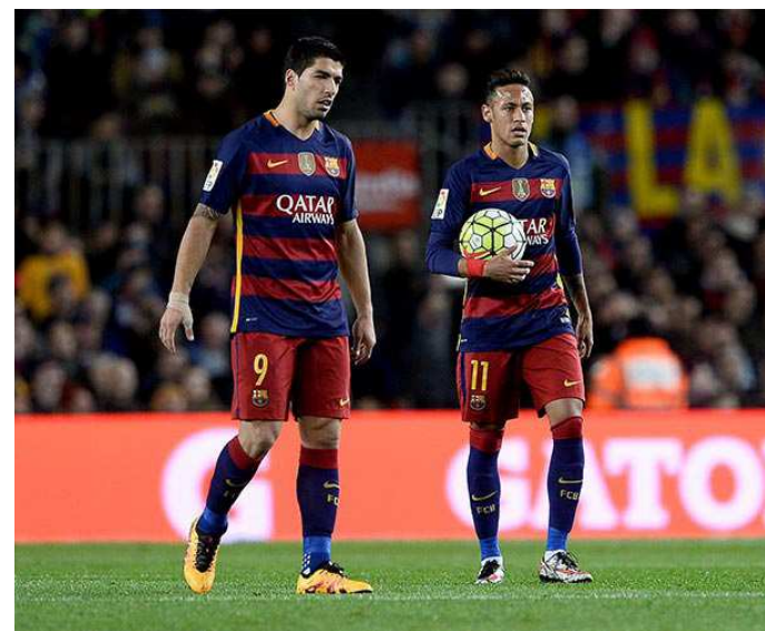
Suárez e Neymar: companheiros no Barça, adversários amanhã