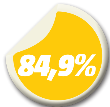
Foi a taxa de homicídios na microrregião de São Luís em 2014

No Maranhão, não existem dados da Secretaria de Segurança Pública sobre estatísticas da violência no interior do estado. Em reportagem recente, O Imparcial mostrou com exclusividade a escalada do crime organizado na Baixada Maranhense, após repressão intensiva da atividade de organizações criminosas como o PCM na capital do Estado.