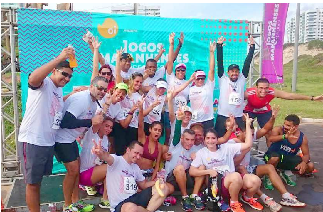
Uma corrida na Avenida Litorânea, com 5km, marcou a programação de encerramento dos Jogos Maranhenses

No sábado (19), teve campeonato de travinha, futevôlei e basquete, na Barraca Landruá, Praia do Calhau. No Caolho, foram disputadas competições de bodyboard. O Cross Training ofereceu um aula de cross fit no Espigão Costeiro de São Luís, com um dos grandes nomes da modalidade no Brasil, Rafael Santos.