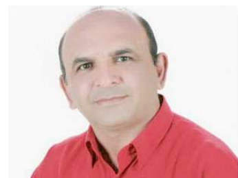
CIBA pré-candidato em Coroatá