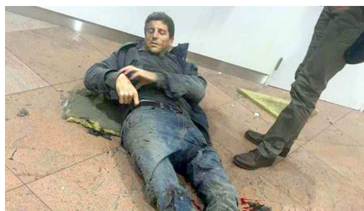
Ataque deixou 187 pessoas feridas na estação do metrô de Maelbeek

"qualquer ato de terrorismo é criminoso e injustificável" e exortou todos os Estados-membros a combaterem os terroristas "com todos os meios" dentro do direito internacional. O comunicado ressaltou também a necessidade de levar à justiça os que cometem, organizam, financiam e apoiam os ataques, enfatizando que, para isso, é necessária a cooperação de todos os países. Para o colegiado, é preciso ainda "tomar medidas para prevenir e eliminar o financiamento do terrorismo", área na qual aprovou, em 2015, várias resoluções com ações concretas.