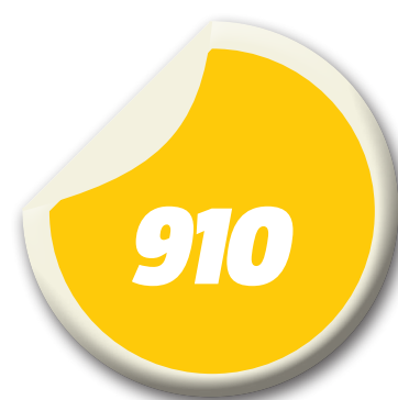
homicídios na capital maranhense em 2014

O relatório chama ainda atenção para o aumento do número de homicídios em localidades interioranas, regiões até pouco tempo consideradas pacíficas. Para o Instituto, essa nova realidade coloca em questão o Pacto Nacional pela Redução de Ho-