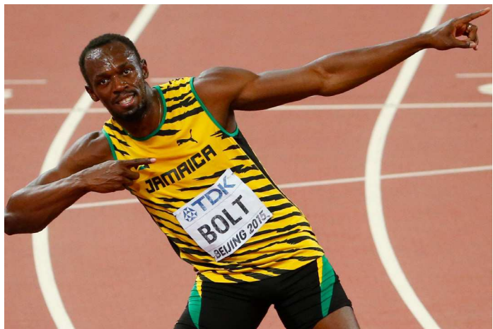
Jamaicano Bolt diz que está se preparando para deixar de correr