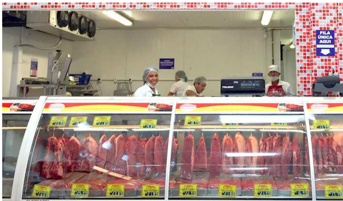
Os frigoríficos já se abasteceram de carne para os consumidores que não se absterem durante a semana santa

Nas feiras, os frigoríficos e as barracas que vendem carne bovina e suína encontram-se abastecidos para os consumidores que optarem pela carne no cardápio da semana santa. Muitas opções