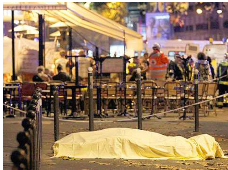
Vinte pessoas morreram na estação do metrô e 106 ficaram feridas

Autores dos ataques utilizaram "cintos explosivos, bombas e espingardas metralhadoras" no Aeroporto de Zaventem e numa estação de metrô. Ação terrorista foi condenada por líderes