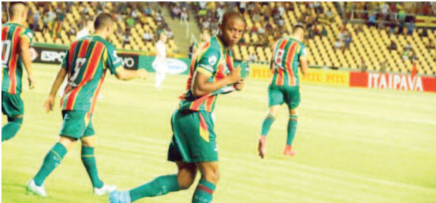
SAMPAlO CORRÊA F.C.