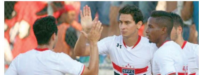
SÃO PAULO FC

Paulo Henrique Ganso recusou proposta de renovação contratual