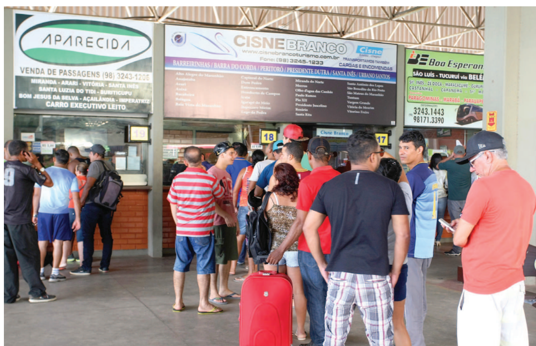
Procura por passagens para o interior foi intensa na manhã de quarta-feira na rodoviária de São Luís