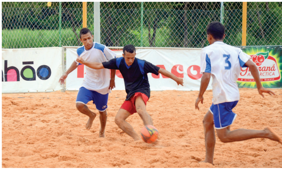
O beach soccer vai movimentar várias equipes do Maranhão, a partir do próximo mês, em quinze etapas