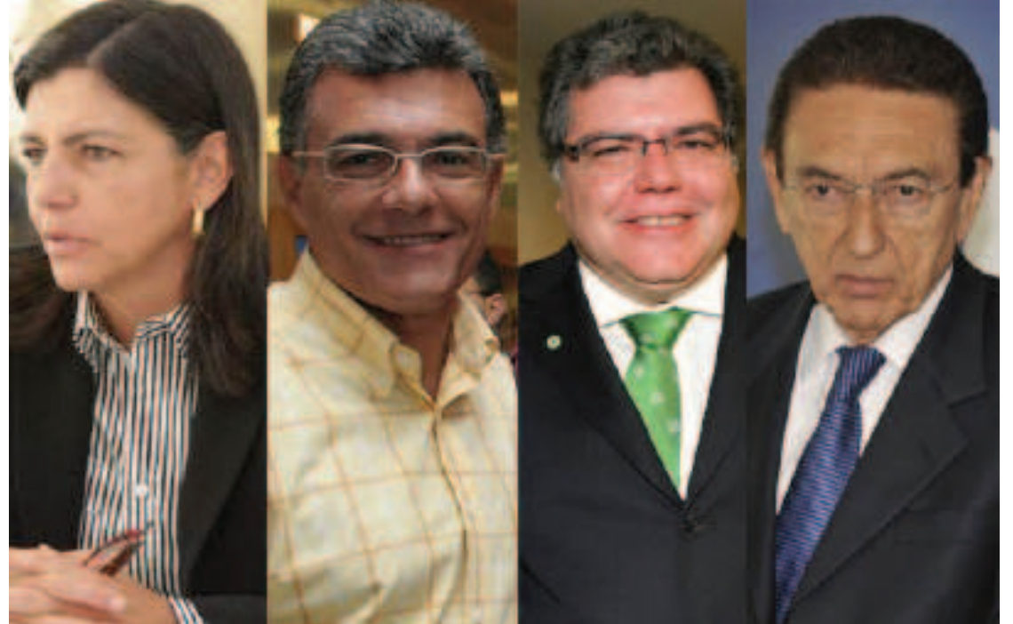
Todos os papéis e arquivos recolhidos estavam na residência do presidente da Odebrecht Infraestrutura