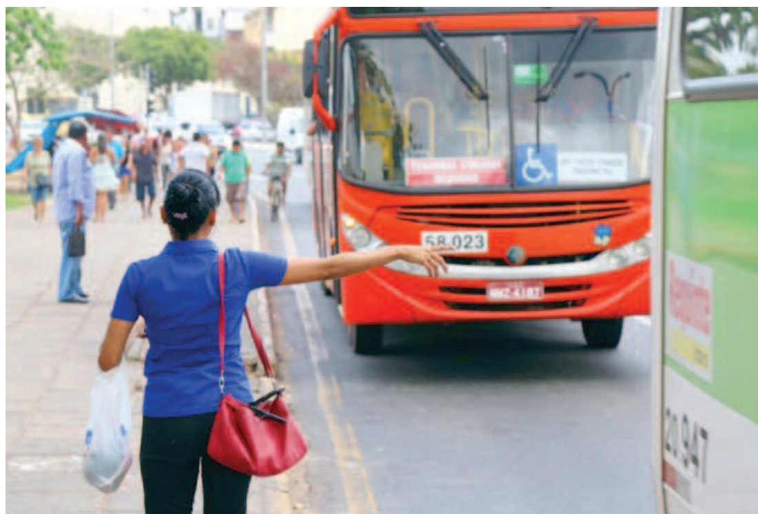
O reajuste, segundo os empresários, tem como objetivo suprir a defasagem do valor das passagens em São Luís