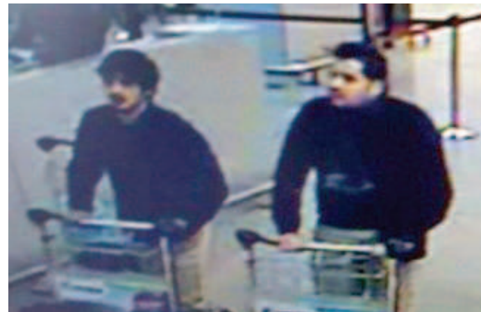
Os irmãos foram identificados entre os supostos homens-bomba

Durante controle policial em setembro, na fronteira entre a Hungria e a Áustria, ele foi identificado com o nome falso de Soufiane Koyal e estava acompanhado por Salah Abdeslam, ligado aos atentados de Paris e capturado na sexta-feira passada (18) em Bruxelas.