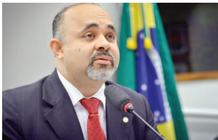
Ministro George Hilton deverá passar a pasta a Ricardo Leyser

O restante da pasta continuará sob o controle do PRB, que poderá ganhar mais postos dentro da Esplanada, como compensação por recuar da decisão de romper com o governo. Oficialmente, o partido se tornou independente, mas voltou a se alinhar informalmente. Na prática, o troca-troca do comando do Esporte mostra a confusão que o governo atravessa internamente por conta da crise política. Insatisfeito com o governo, o PRB anunciou na semana passada que abandonaria a base e