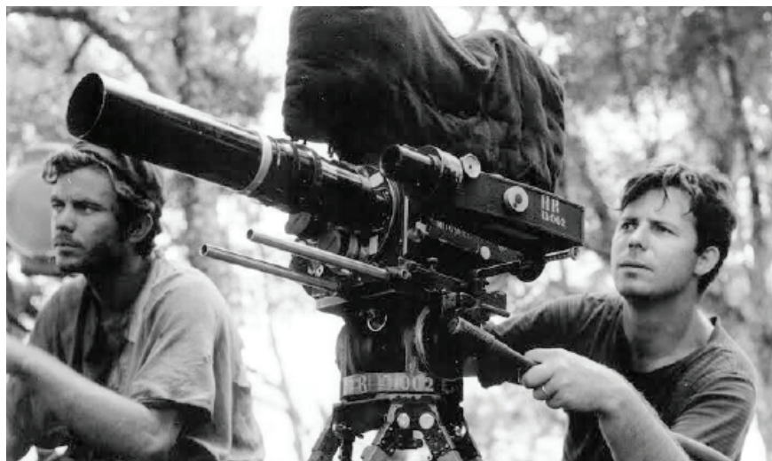
A programação do festival exhibe filmes de cineastas brasileiros renomados