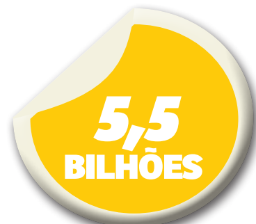
Receita do ICMS estimada para 2016