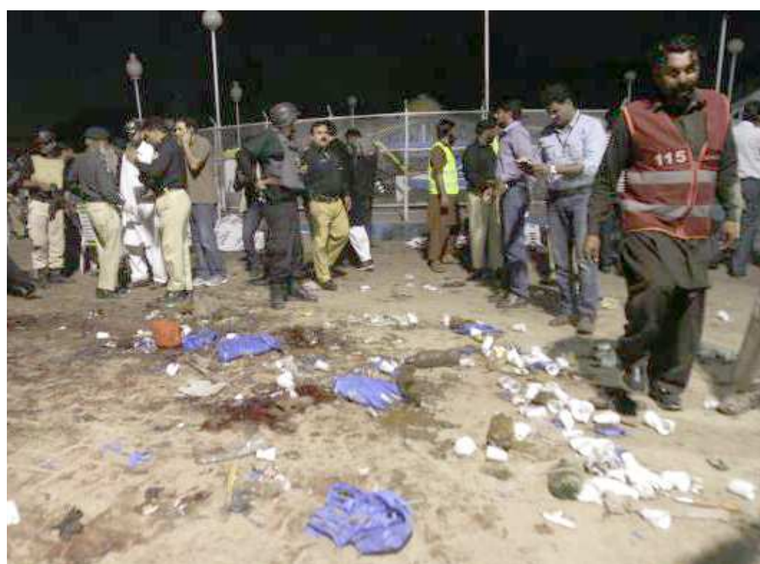
Oficiais de segurança inspecionam todo o local onde ocorreu neste domingo um atentado a bomba suicida

Os membros da coalizão vão respeitar, neste caso, "a soberania de cada país e agirá apenas em cumprimento das leis e convenções internacionais".