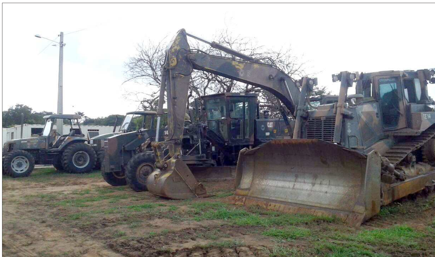
Máquinas do Exército Brasileiro já estão no município de São João dos Patos, onde foi montado o canteiro de obras para início dos trabalhos na MA

A aplicação dos recursos na região do Alto Itapecuru vai beneficiar municípios vizinhos como Nova Iorque, Pastos Bons, Barão de Grajaú, Paraibano e Sucupira do Riachão. Esta é a terceira etapa de investimentos na MA-034. A primeira foi concluída ano passado no trecho Baú/Matões, a segunda está em andamento no trecho Buriti Bravo/ Brejo de São Félix.