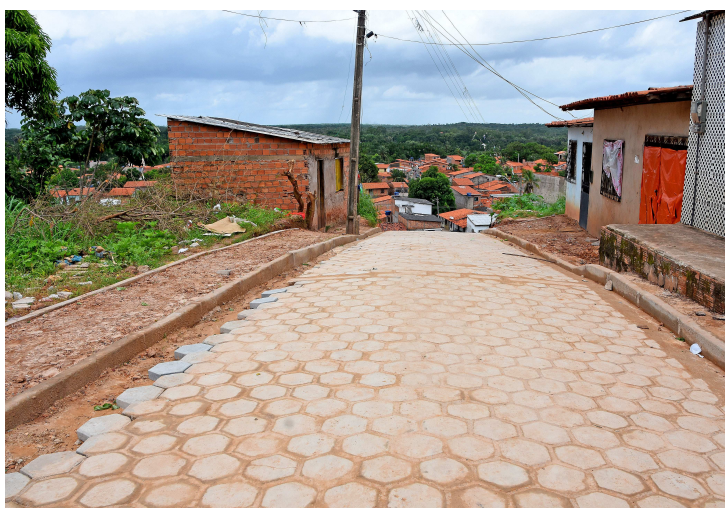
Algumas das vias contempladas nunca haviam recebido pavimentação

Algumas das vias contempladas nunca haviam recebido pavimentação desde a fundação do bairro, há cerca de 40 anos. O