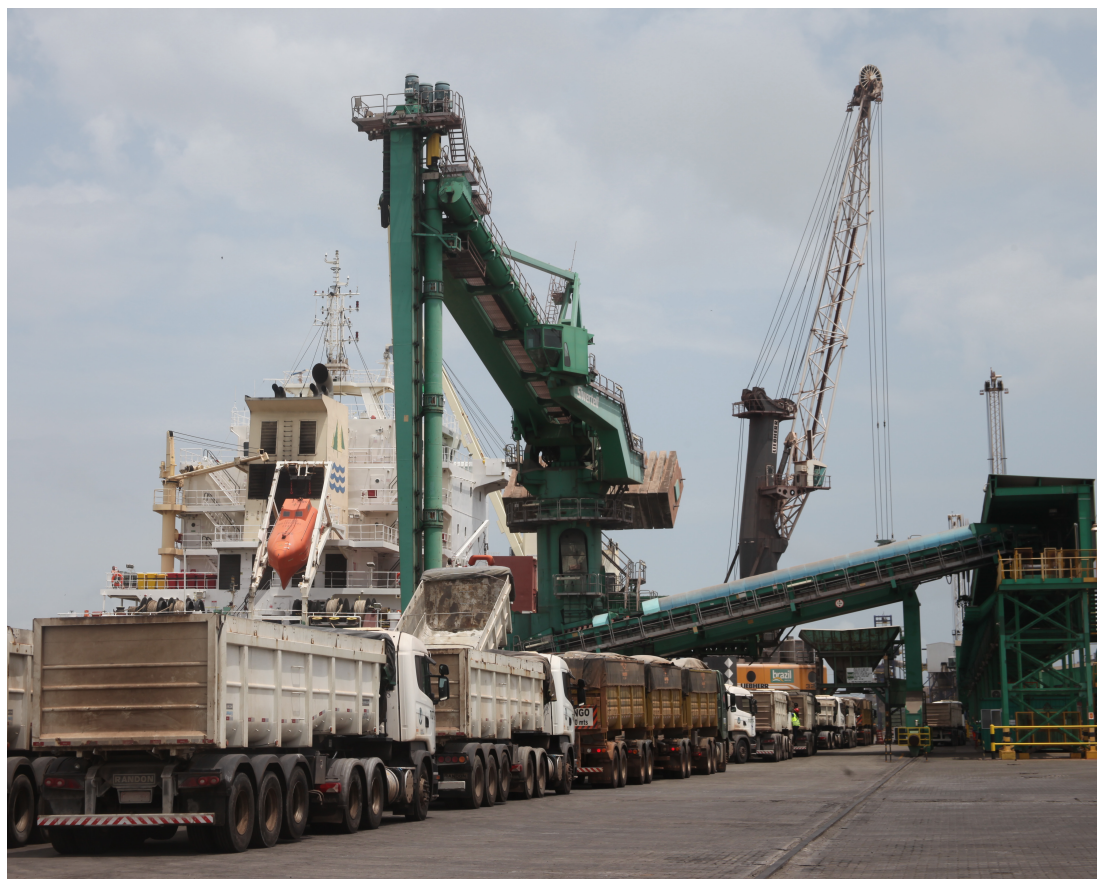
Lucro real supera expectativas das projeções feitas para 2015, que era de apenas R$ 307 mil

"A capacidade recuperada de investimentos da Emap, com