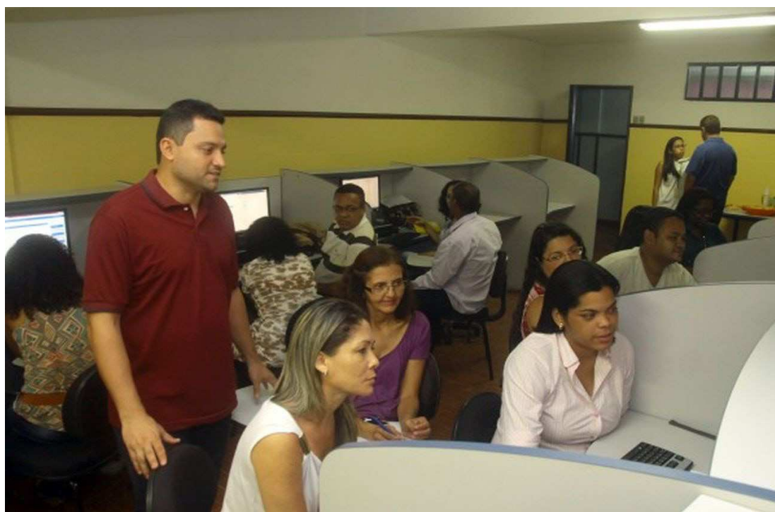
Os cursos fazem parte do programa de valorização dos servidores públicos municipais da capital

Além das capacitações de caráter geral, a instituição também promove cursos de qualificação direcionados a secretarias específicas como Saúde (Semus), Trânsito e Transportes (SMTT), Pla-