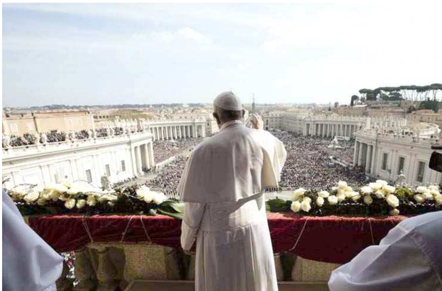
Milhares de fiéis se reuniram na Praça de São Pedro e na Via della Conciliazione para ouvir a mensagem "Urbi et Orbi" especial para a Páscoa

Tendo descrito durante a vigília pascal os "cristãos sem esperança" e "prisioneiros" de seus "problemas", Francisco esboçou o retrato de uma sociedade sem