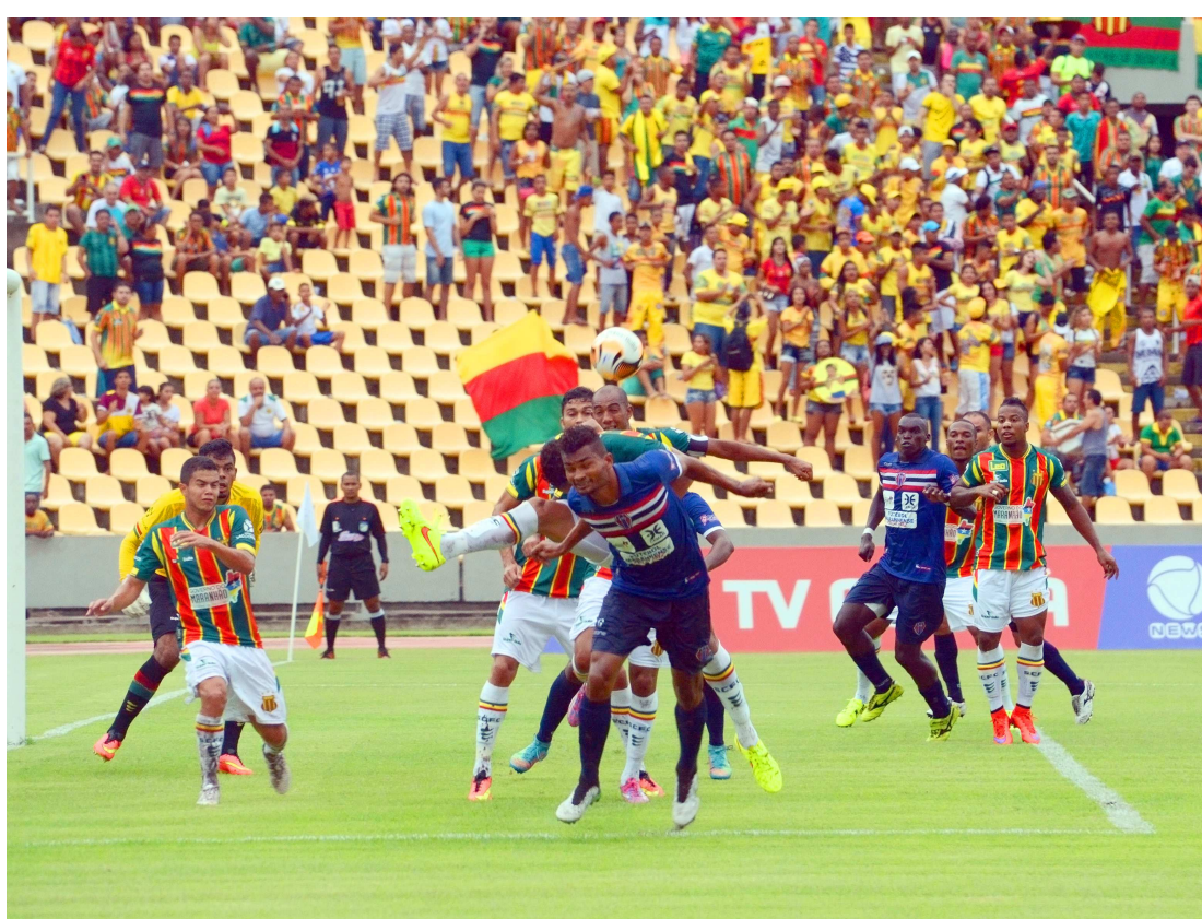
Sampaio e Maranhão Atlético voltam a se encontrar hoje à noite em jogo de muita importância para as duas equipes

Para o MAC, esta partida de hoje é a primeira da série de dois clássicos seguidos que terá pela frente. Com apenas um ponto ganho no empate com o São José, a equipe maqueana pode chegar a quatro, nesta noite. Mas para seguir na luta por uma vaga nas semifinais necessitará ainda de uma vitória sobre o Moto, na última rodada desta fase, ou até mesmo um empate, dependendo do que acontecer com Araioses e São José, que vão enfrentar Santa Quitéria e Imperatriz, respectivamente.