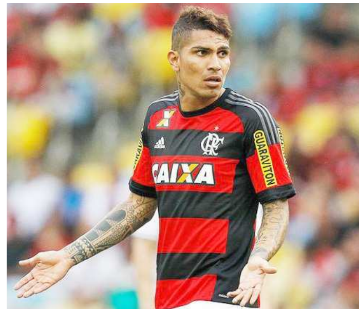
Guerrero é mantido no ataque do Flamengo, apesar do cansaço