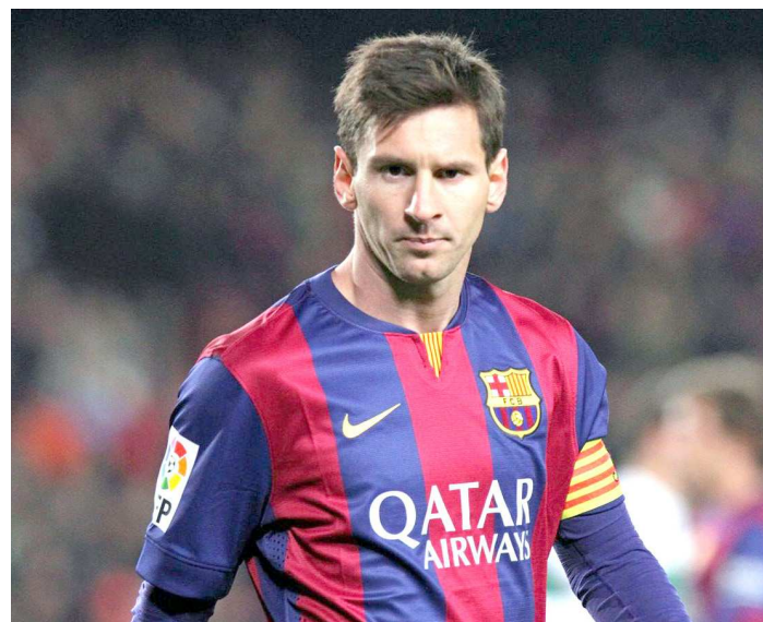
Lionel Messi poderá marcar o seu gol de número 500 na tarde de hoje