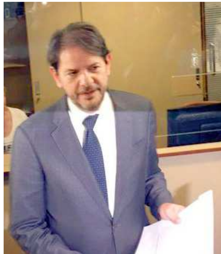
Gomes alega que o Temer é mencionado em investigações da Lava-Jato

"Foi revelado, por força da Operação Catilínarias [uma das fases da Operação Lava-Jato], o pagamento da quantia de R$ 5 milhões ao denunciado, valor cuja suspeita de origem ilícita é marcante, mormente pelas insuficientes explicações ofertadas pelo denunciado após a revelação de mensagens sobre o pagamento de tal quantia, por parte do senhor Léo Pinheiro, trocadas pelo denunciado e o presidente da Câmara dos Deputados, em cobrança por adiamento na quitação de