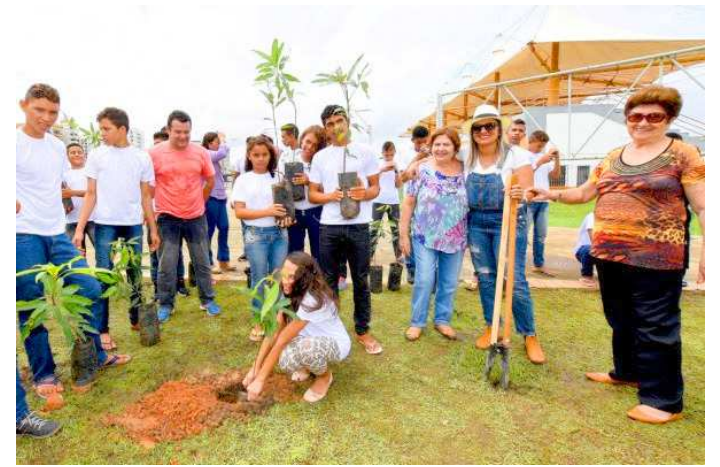
Estudante da Casa Familiar planta mudas na Lagoa da Jansen