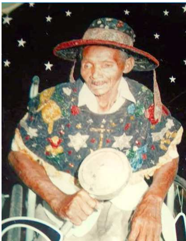
Mestre Coxinho foi um dos mais expressivos nomes da cultura do MA

Fruto da Raça Show Encontro de cantadores de boi da Ilha Encontro de cantadores de boi da Baixada Boi União da Baixada Boi Unidos de Santa Fé Danças portuguesas