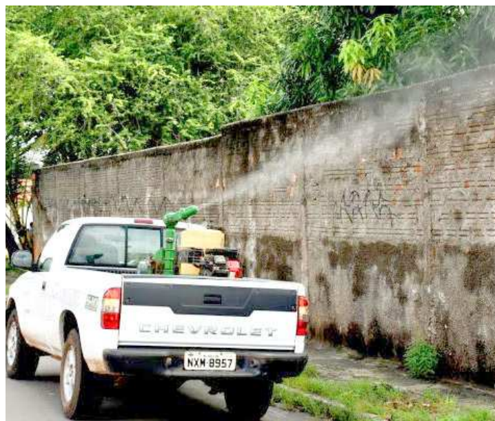
Carro fumacê borrifou veneno que impede a proliferação do Aedes aegypti