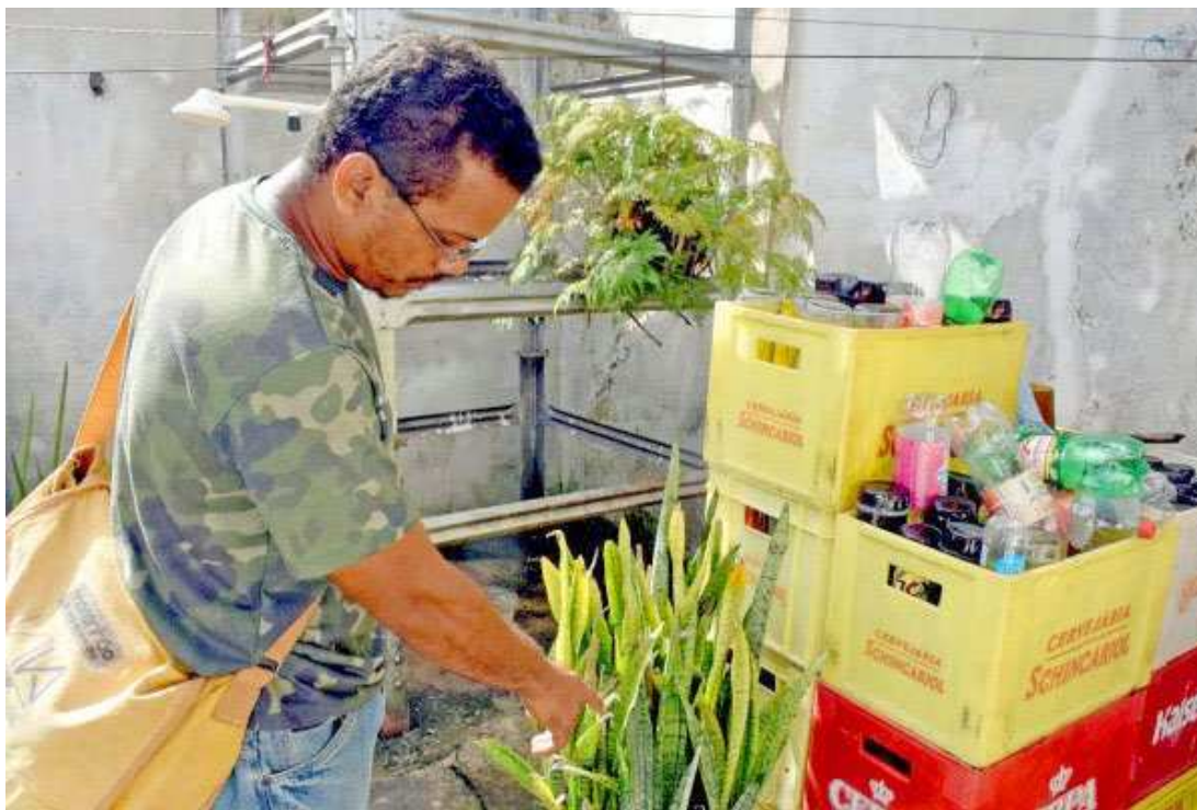
Agentes de saúde realizaram fiscalizações nos quintais das residências à procura de focos do mosquito

Durante a última semana, estudantes da rede municipal de educação participaram de ações de combate ao mosquito Aedes aegypti, transmissor da dengue, chikungunya e zika. A Prefeitura de São Luís, por meio da Secretaria Municipal de Educação (Semed), está desempenhando nas unidades básicas de ensino um projeto de conscientização sobre o Aedes aegypti. A iniciativa pretende fazer com que crianças e a comunidade escolar certifiquem-se sobre os males e percebam a importância da pre-