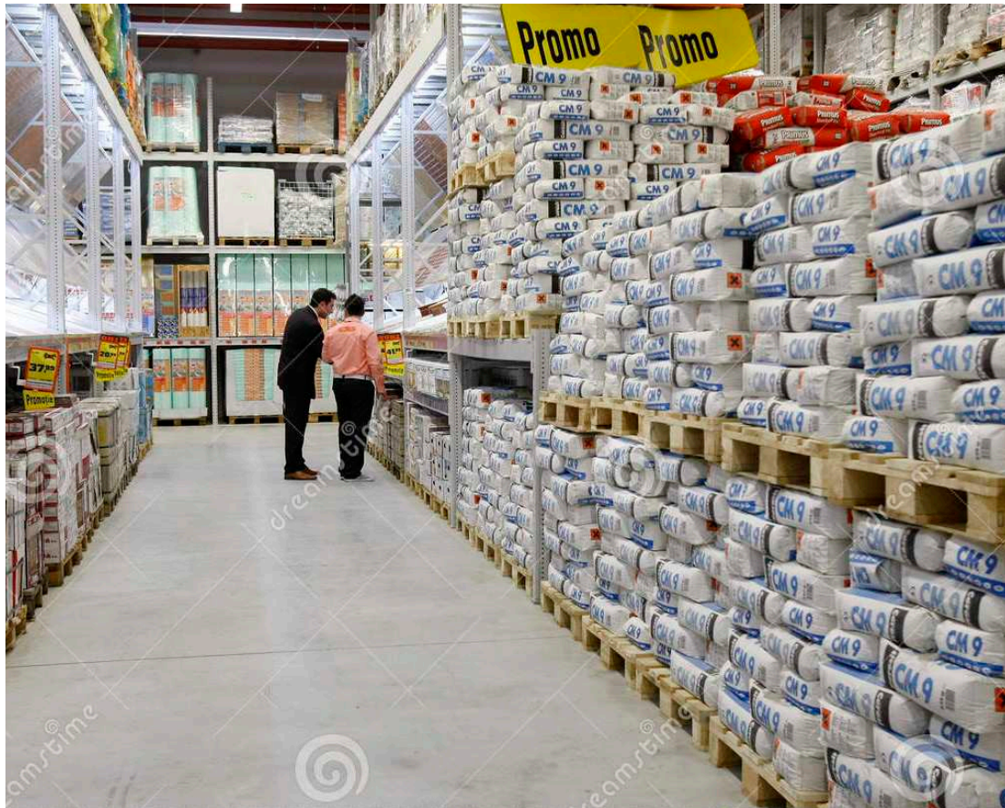
Movimento das lojas de material de construção caiu bastante no último mês de março

O nível de emprego nas indústrias de materiais, porém, continua apresentando queda. A retração de março chegou a 9,3% em comparação com igual mês de 2015. Com relação a fevereiro de 2016, a baixa identificada foi de 0,2%.