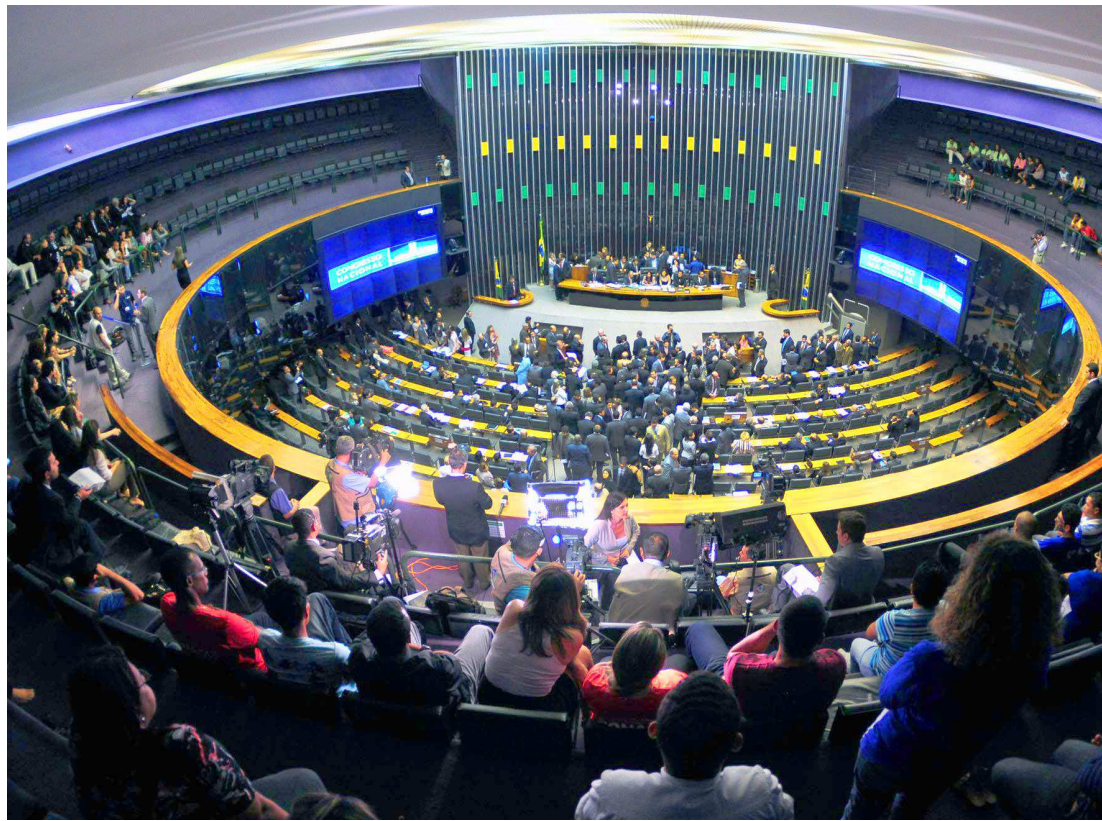
Impeachment de Dilma teria hoje 308 votos, 34 a menos que os 342 necessários para que a ação vá ao Senado

No recorte das quatro maiores bancadas da Câmara (PMDB, PT, PSDB e PP), a situação da pre-