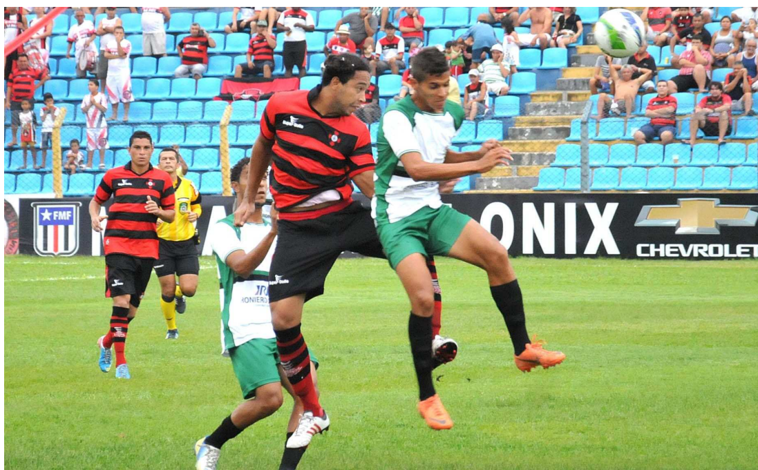
Uma das últimas apresentações do Moto no Nhozinho Santos foi contra o Cordino, em setembro de 2014