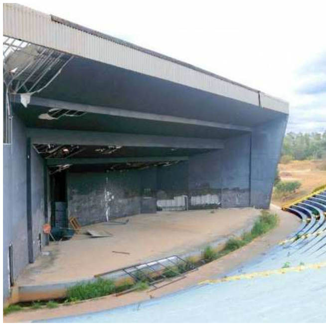
Após as obras a Concha deverá ser utilizada com mais frequência

O secretário afirmou, ainda, que a partir desta reforma, a Concha Acústica deverá ser utilizada com frequência, para