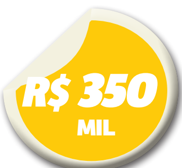
Valor das obras emergenciais do Estádio Nhozinho Santos

o número de jogos no Castelão serão diminuídos, pois o Sampaio Corrêa deverá mandar suas partidas da Série B do Brasileiro no Gigante do Outeiro. Com um orçamento em torno de R$ 350 mil, segundo fontes não oficiais, a Semdel vai fazer as principais intervenções na praça desportiva, como troca de instalações elétricas e hidráulicas, além da troca de estruturas metálicas.