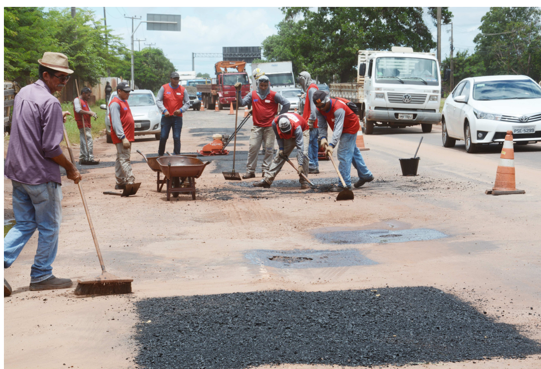
Operários contratados pelo Dint estão realizando serviços de recuperação asfáltica na entrada da BR-135