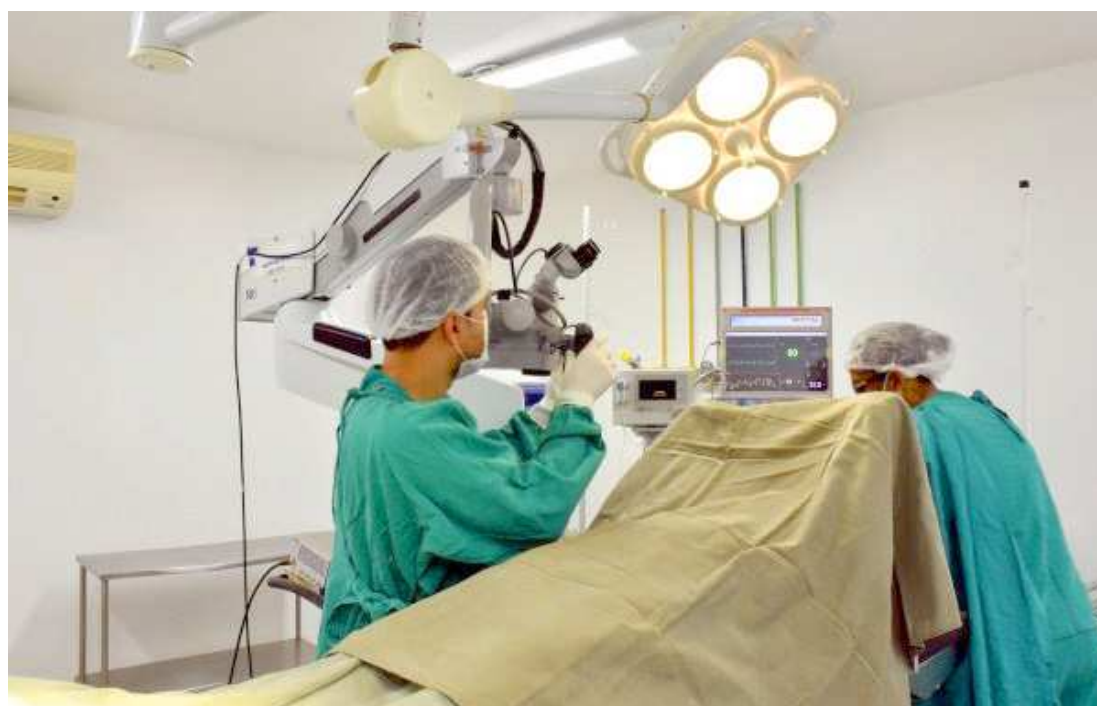
O hospital realiza procedimentos cirúrgicos em aneurismas, tumores e traumas raquimedulares, entre outros

“Antes não havia um serviço de referência na rede pública municipal para onde esses pacientes pudessem ser encaminhados. Hoje, as lesões de aneurisma, os tumores cerebrais e coluna podem ser operados no Hospital da Mulher. A Prefeitura, portanto, criou condições favoráveis para