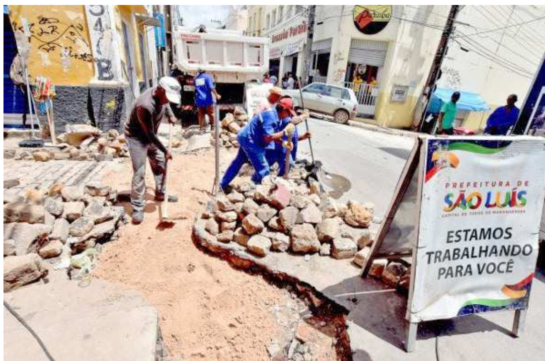
As obras consistem em ampliação do sistema de drenagem, por meio de recuperação de redes profundas

A limpeza de galerias e bueiros também é uma constante em diversos bairros da capital. O trabalho foi desenvolvido na Avenida Guajajaras e também na Avenida Jailson Viana, na Vila Olímpica. A Semosp também realizou a limpeza de galeria de escoamento localizada nas proximidades da Universidade Estadual do Maranhão (Uema), na Cidade Operária e na Avenida Colares Moreira, entre outras localidades. Nos locais onde o pavimento ficou comprometido em razão da obstrução das gale-