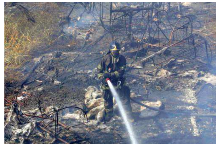
As alegorias tinham autorização para ficar na área até o final de junho