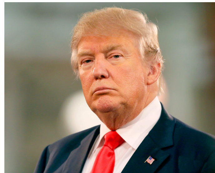
Ameaça em pôr bomba no comício de Donald Trump veio pelo Twitter