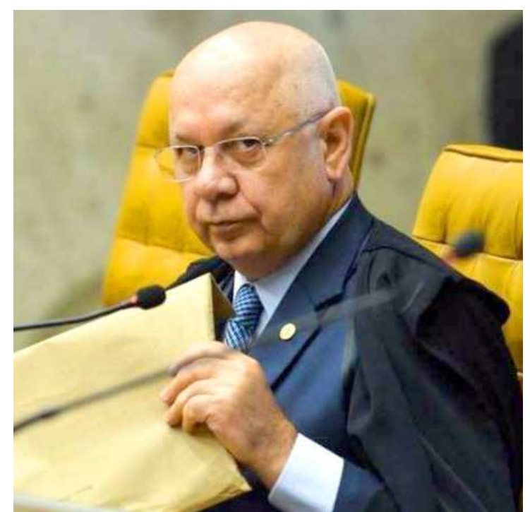
Teori também devolveu a Moro duas investigações remetidas ao STF

Em março, Moro decidiu enviar ao STF os processos decorrentes das duas fases da operação, que incluem a lista que trata dos pagamentos feitos pela Odebrecht a políticos. Moro havia colocado a lista em segredo de Justiça em função do foro privilegiado de alguns dos citados.