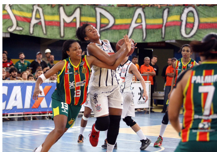
As tricolores erraram muito e o Corinthians reduziu a vantagem