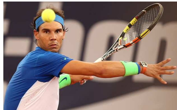
Rafael Nadal conquistou a "coroa do rei" no ATP de Barcelona