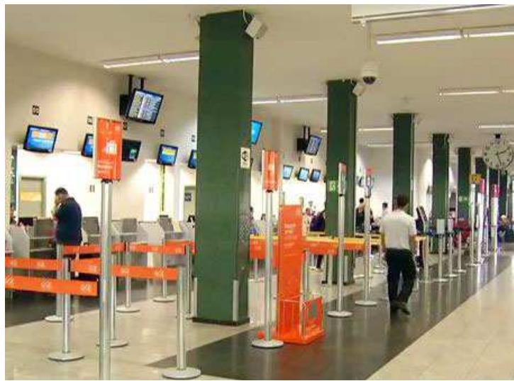
Movimento nos aeroportos do país está cada vez mais reduzido

A oferta, por sua vez, apresentou retração de 7,5% no mês passado em relação a março de 2015. Com isso, a taxa de ocupação doméstica teve alta de 0,2 ponto porcentual (p.p.) no terceiro mês deste ano, para 77,63%. Nos três primeiros meses do ano, a oferta acumula queda de 3,7%, levando a taxa de ocupação doméstica