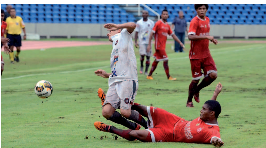
Depois de fazer uma campanha bastante irregular no Campeonato Maranhense, Imperatriz tenta se recuperar

O Imperatriz empatou no primeiro jogo por 1 a 1, e agora vai tentar a classificação na casa do adversário. Se houver