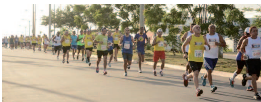
Corrida do Trabalhador vai reunir centenas de participantes no dia 1º de maio, promovida pelo Sesi/Fiema

De acordo com o regulamento, a largada da prova ocorrerá às 7h para corredores das categorias Pessoa com Deficiência (PcD) e Idoso (60 anos e mais) e às 7h05 para os demais corredores, nas proximidades do portão principal de acesso à Unidade de Promoção da Saúde do Araçagy. A corrida possui percursos nas distâncias de 5km (masculino e feminino individual, para trabalhador da indústria e comunidade, inclusive Pessoas com Deficiência) e 10km (masculino e feminino individual, para trabalhador da indústria e comunidade).