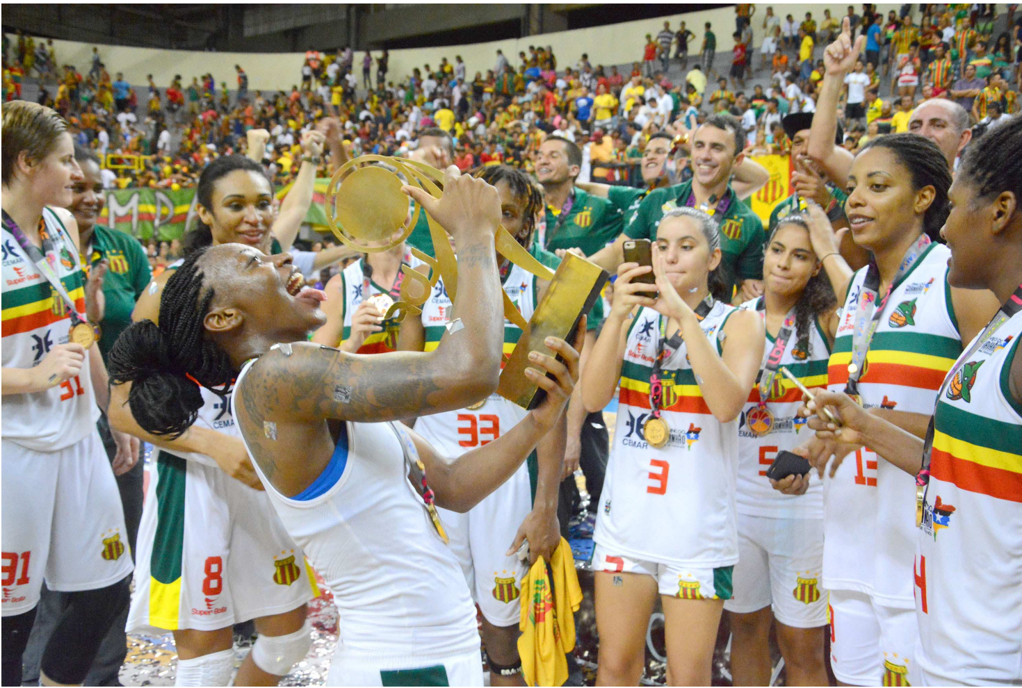
Atletas do Sampaio Corrêa comemoram a conquista do título inédito da Liga de Basquete Feminino depois de vitória sobre bicampeão Americana