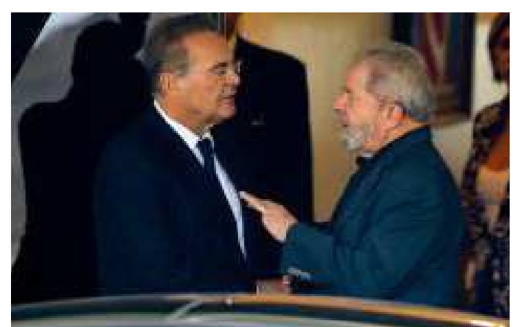
Renan disse que seu papel deve incluir conversas com todos os envolvidos