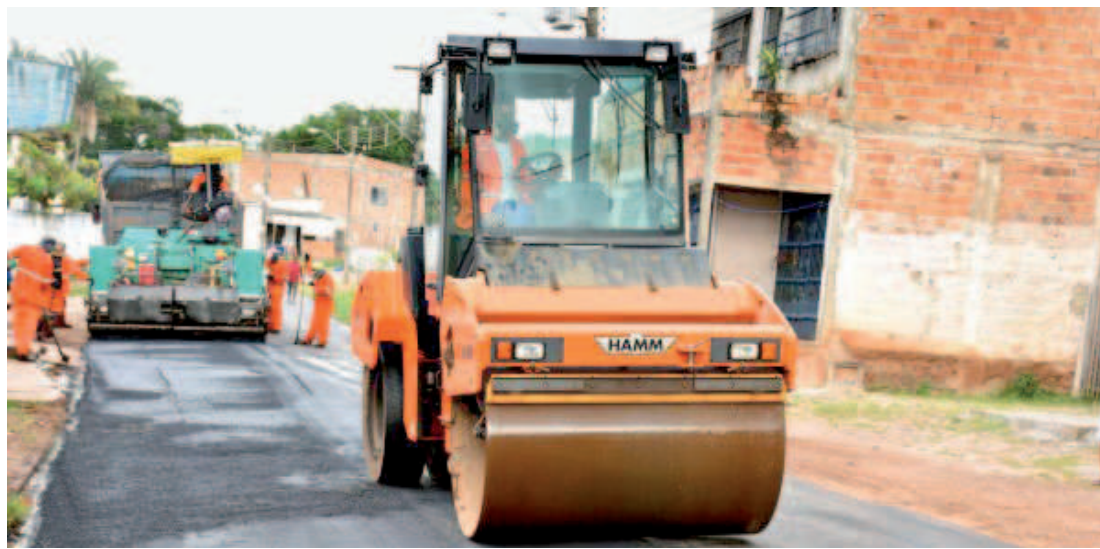
Obras no Residencial Paraíso devem melhorar a urbanização da área, além da drenagem das ruas do bairro