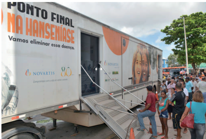
Carreta da Hanseníase atender a 35 municípios nos próximos meses

Desde 2009 ele é executado no Brasil como um centro de saúde móvel atendido por um grupo multidisciplinar de profissionais de saúde locais que viajam para as regiões do país mais afetadas