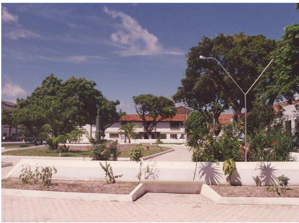
Antigamente denominada Afonso Saulnier de Pierrelévê, em homenagem ao primeiro médico cirurgião do tradicional Hospital Português e da Santa Casa de Misericórdia, sendo assim o primeiro médico cirurgião do Maranhão e um dos primeiros da Região Nordeste do Brasil a implantar uma prótese em membro inferior (perna), em uma escrava de sua propriedade, a praça está situada entre as ruas de Santa Rita e do Norte. Atualmente denomina-se Praça da Misericórdia, em função de estar próxima ao hospital da Santa Casa de Misericórdia.