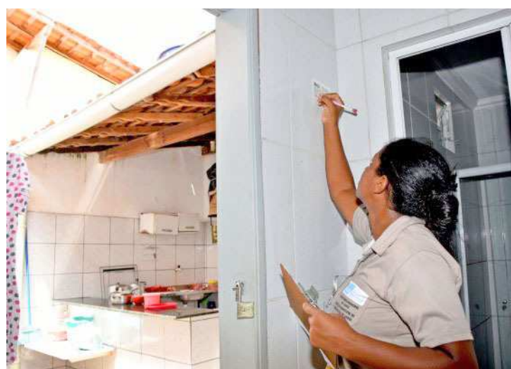
Agentes dos dois municípios visitam casas na região do Cohatrac

A parceria entre os prefeitos Eivaldo e Gil Cutrim será consolidada em um termo de cooperação técnica que será assinado em maio. A partir da assinatura do termo, as prefeituras esten-