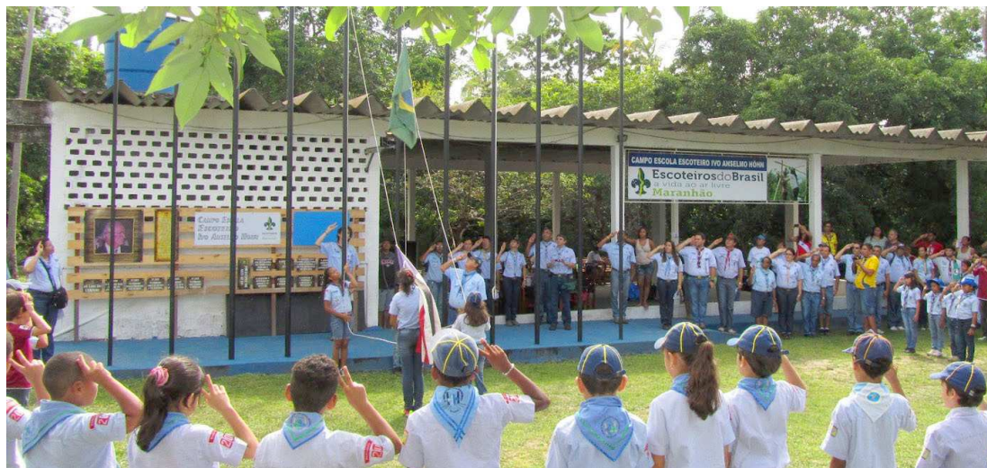
Grupo irá participar do VIII Grande Jogo Escoteiro em comemoração aos 106 anos do escotismo no Brasil

No Maranhão, as festividades foram marcadas para hoje, com a realização do VIII Grande