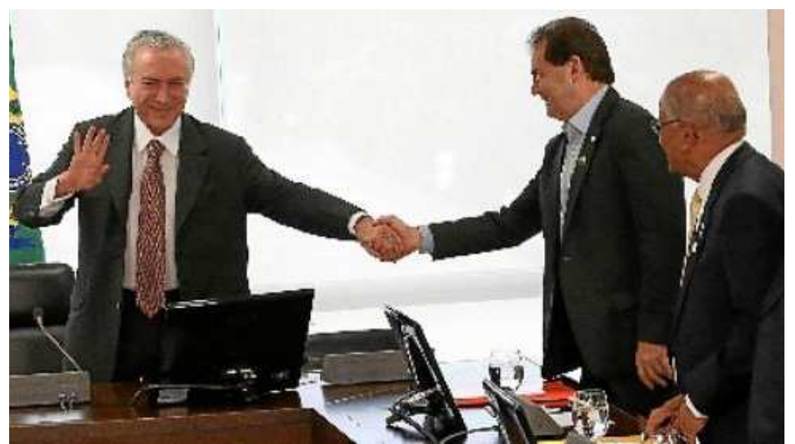
Michel Temer cumprimenta o presidente do Solidariedade, Paulinho da Força, em reunião com líderes da base

O parlamentar é um dos que rejeitaram a proposta de Meirelles de fazer uma reforma da Previdência sem discutir com as centrais, aumentando a idade mínima para 65 anos e unificando direitos de homens e mulheres. Antes mesmo da aprovação da suspensão