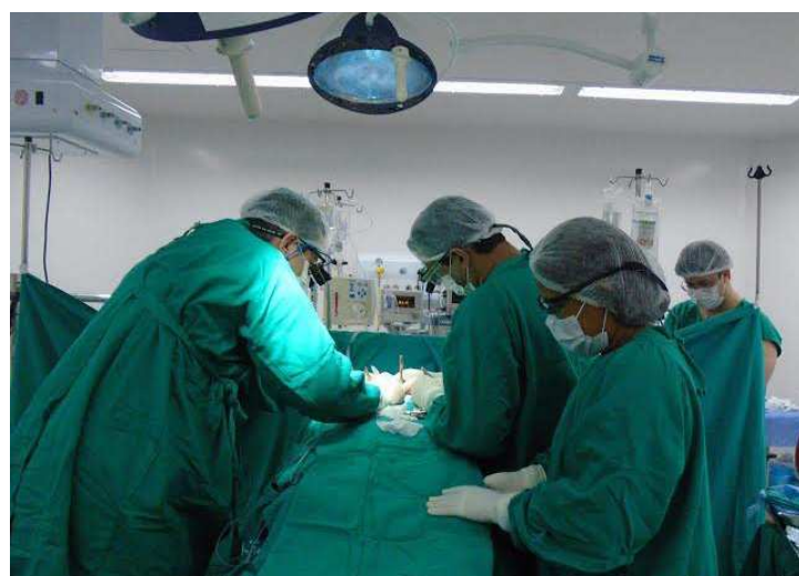
Hospital Carlos Macieira mantém tendência de crescimento desde 2015

Desde julho de 2014, quando o Centro Cirúrgico do HCM passou a funcionar, até dezembro de 2014 foram realizadas