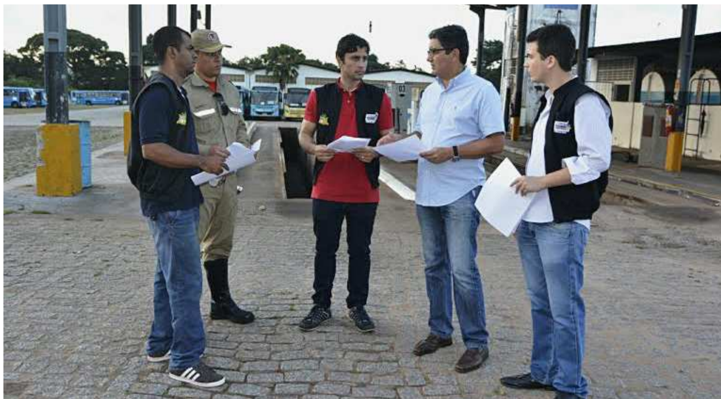
Representantes da Agência de Mobilidade Urbana, Procon, Polícia Militar e Corpo de Bombeiros em ação fiscalizatória nas garagens de ônibus

Uma força-tarefa coordenada pela Secretaria de Segurança Pública do Maranhão (SSP-MA) e a Delegacia Geral levou às ruas, no fim de semana, cerca de 80 policiais civis para realizar incursões e abordagens em áreas da região metropolitana de São Luís, onde ocorreram registros de ataques a coletivos nos últimos dias. A operação foi reforçada na região do bairro Coroadinho, onde os comerciantes teriam sofrido ameaças de criminosos e foram obrigados a fechar os estabelecimentos. Na noite do sábado, o governador Flávio Dino fez uma visita aos bairros da cidade para conferir o policiamento. Ele afirmou que “a polícia está presente para garantir a ordem pública”.