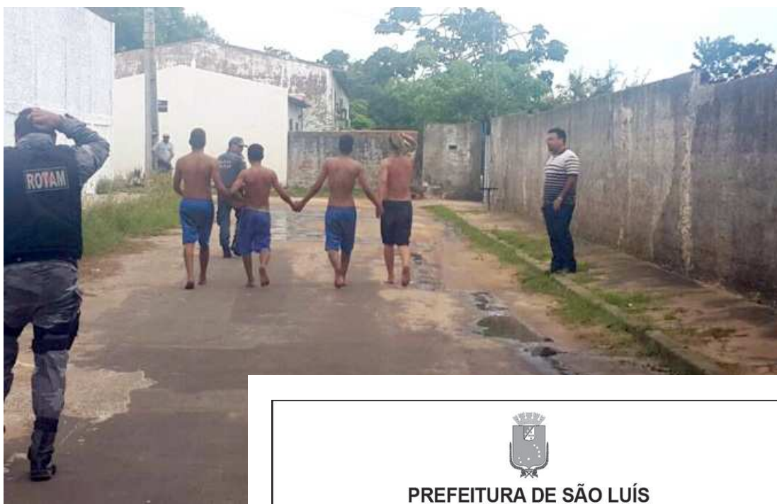
20 jovens foram capturados no início da tarde de domingo pela polícia

A unidade é destinada para adolescentes em internação provisória para cumprir medida socioeducativa e é coordenada pela Fundação da Criança e do Adolescente (Funac), órgão Governo do Estado. Em agosto do ano passado o local foi ampliado e agora possui 42 novos alojamentos individuais. Apesar da reforma recente, esta é segunda fuga registrada na unidade em 2016. A outra ocorreu em abril, quando cerca de 20 adolescentes infratores escaparam. Medidas administrativas estão sendo tomadas para apurar as circunstâncias da recente fuga.